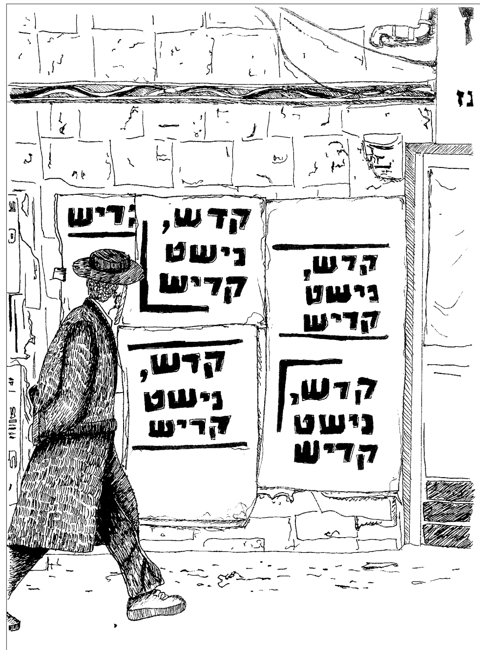
Illustration: Helene Selmer Brøndsted.

Når store dele af Mea She'arims haredi-jøder og jøder bosat andre steder i Israel, ikke adlød statens COVID-19-restriktioner, handler det altså delvist, men ikke udelukkende, om, at restriktionerne var uforenelige med deres religiøse praksis; det handler også om, at staten i deres øjne ikke er en legitim autoritet, der kan kræve haredis loyalitet, fordi dens ordrer ikke kommer fra Gud.