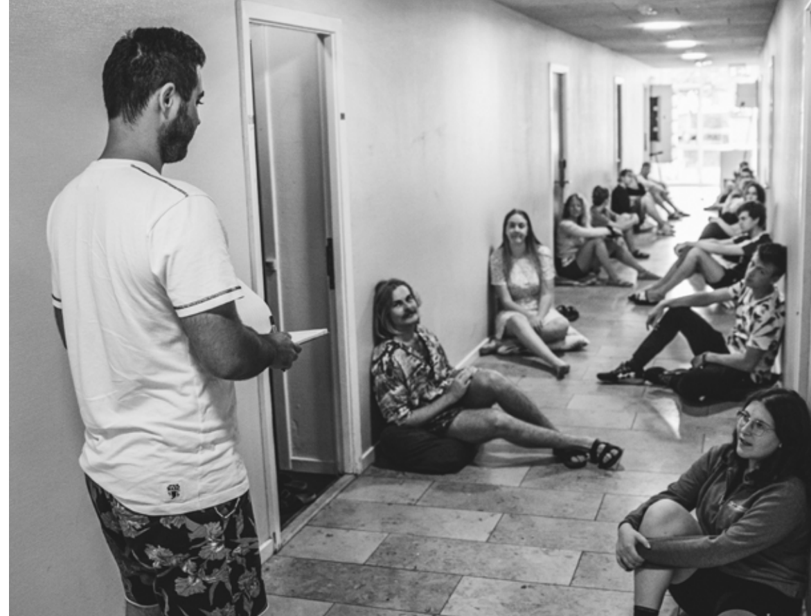
COVID-19 gangmøde, hvor gangformanden agerer ordstyrer, mens beboerne sidder på gulvet og diskuterer retningslinjer.