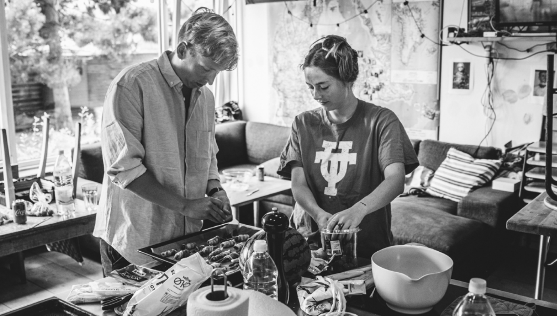
Kollegiekøkkenet, hvor to beboere står og laver mad til alle på grund af COVID-19 retningslinjer.

møde i køkkenet, hvor der tages beslutninger om økonomi, praktiske ting og sociale arrangementer gennem fælles afstemninger. Kollegielivet kendetegnes ved en farverig hverdag med talrige sociale arrangementer og vilde fester med druklege, hvor der eksperimenteres med samvær, nøgenhed og normer.