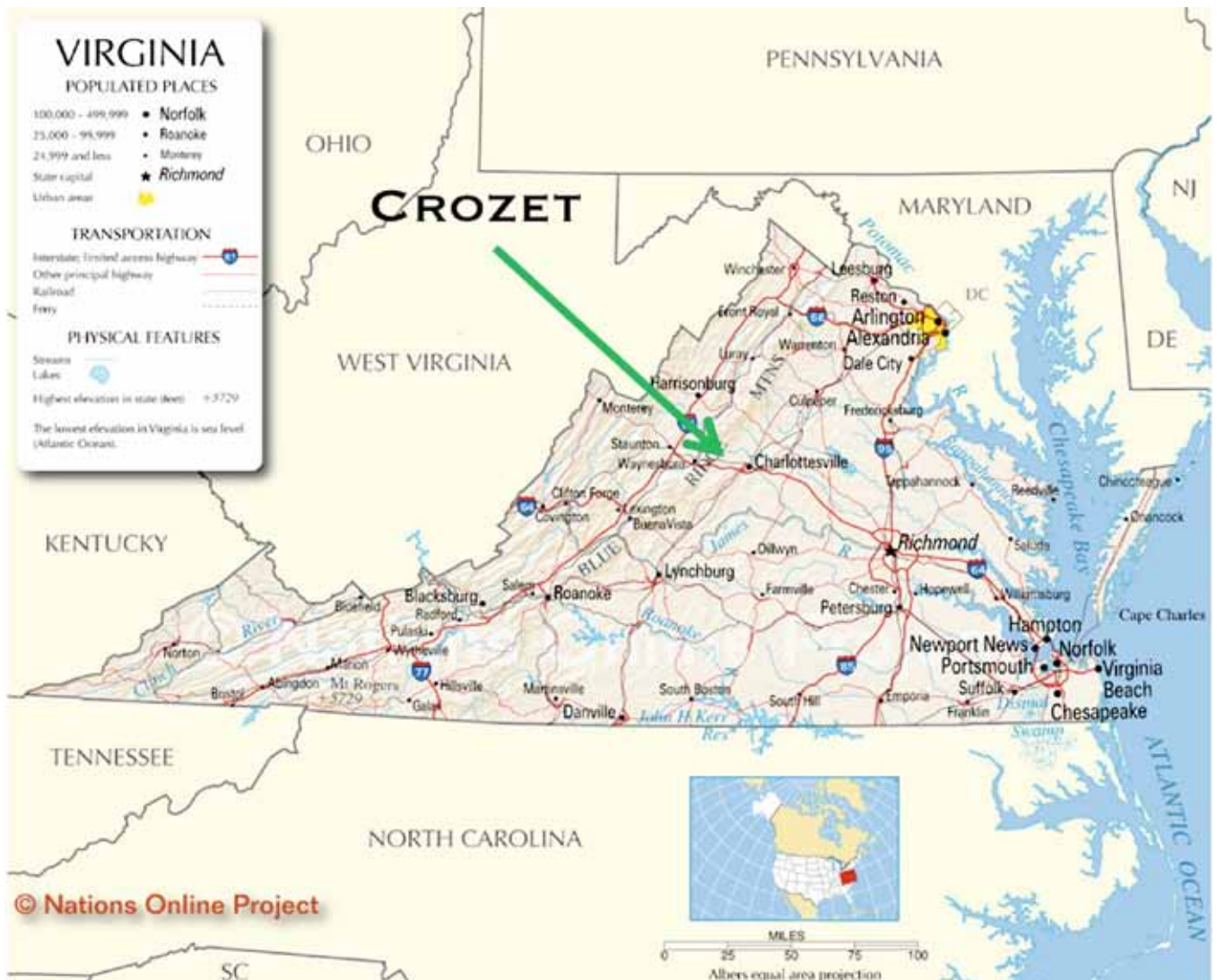
Figur 1: Kort over Virginia med omgivende stater.

Man har således fokuseret på voldelige og dramatiske hændelser, men har mere eller mindre ignoreret arbejdernes daglige levevilkår.