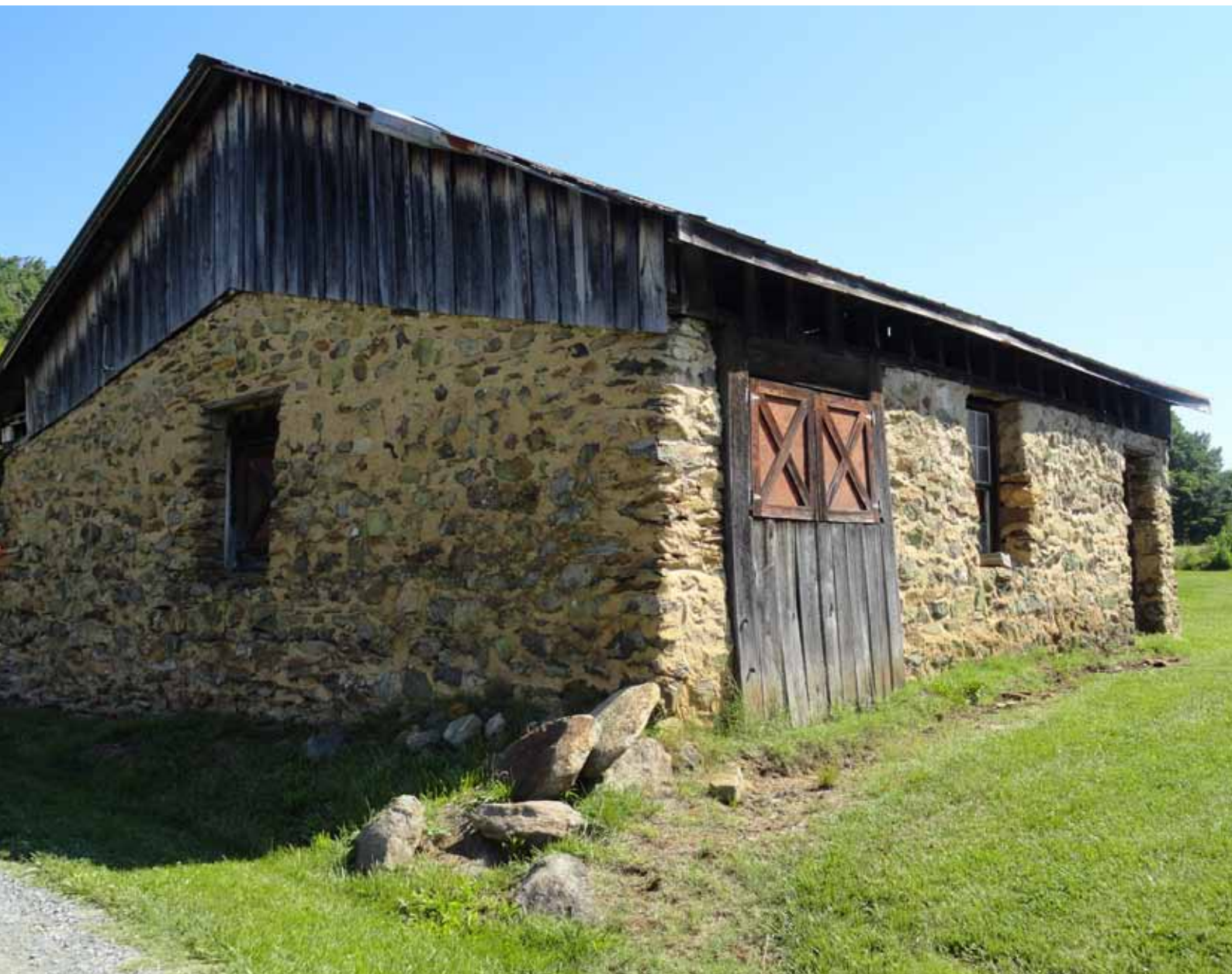
Figur 7. Venstre: Irsk liv: En irsk hytte. Nederst: Bygning A/Dobbelthytte i Pollak Vineyards.