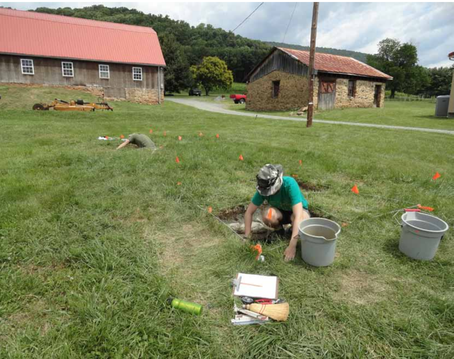
Figur 4. Studerende i gang med udgravning under feltarbejdet i 2012 (Amanda B. Johnson fot.).

Figur 5. Genstande, der blev fundet i første fase af feltarbejdet. Til venstre ses benet fra en porcelænsdukke. Til højre ses skår fra en tekop af finkeramik (Amanda B. Johnson fot.).