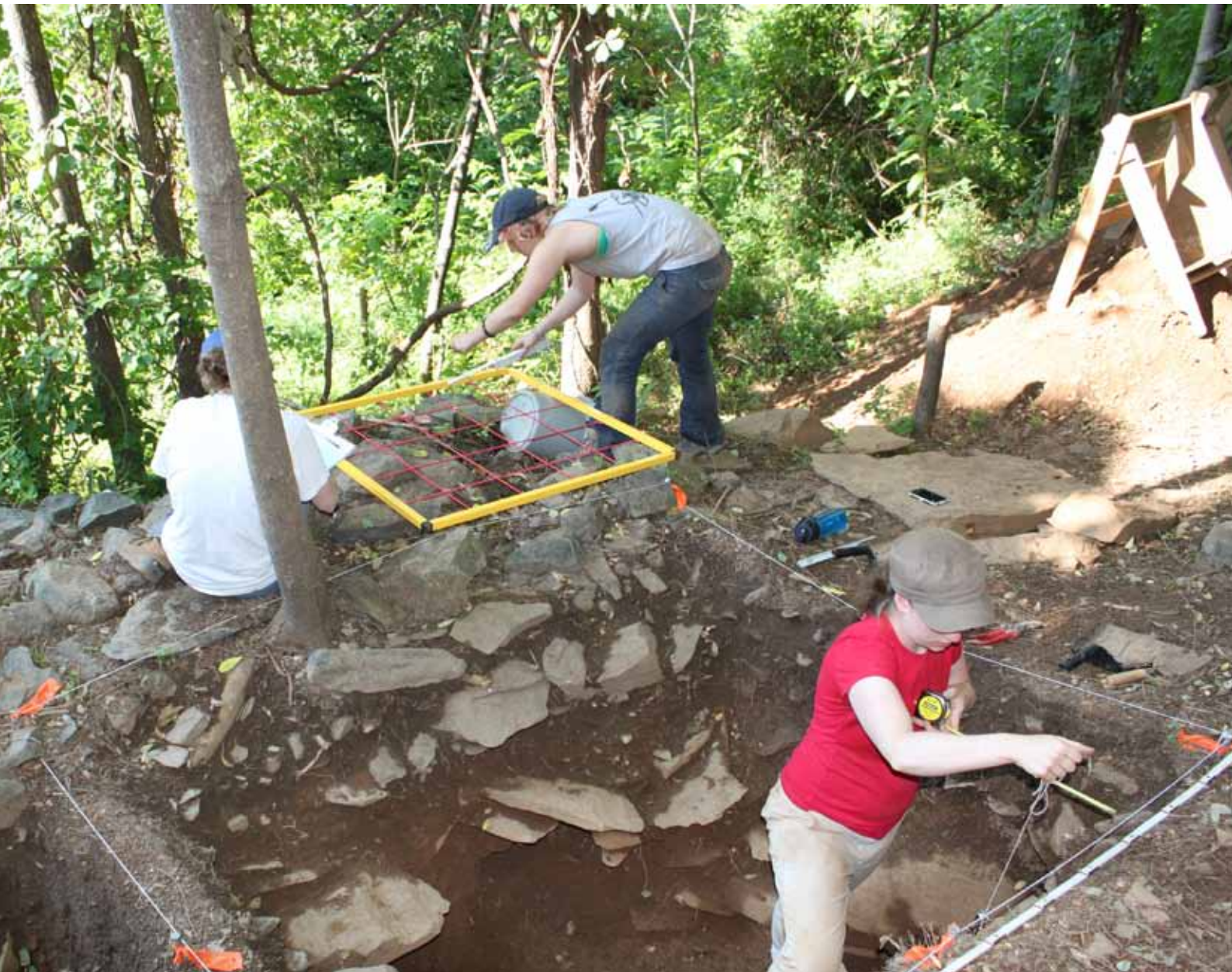
Figur 8. Studerende, der udgraver Ivey-bebyggelsen under feltarbejdet i 2013.