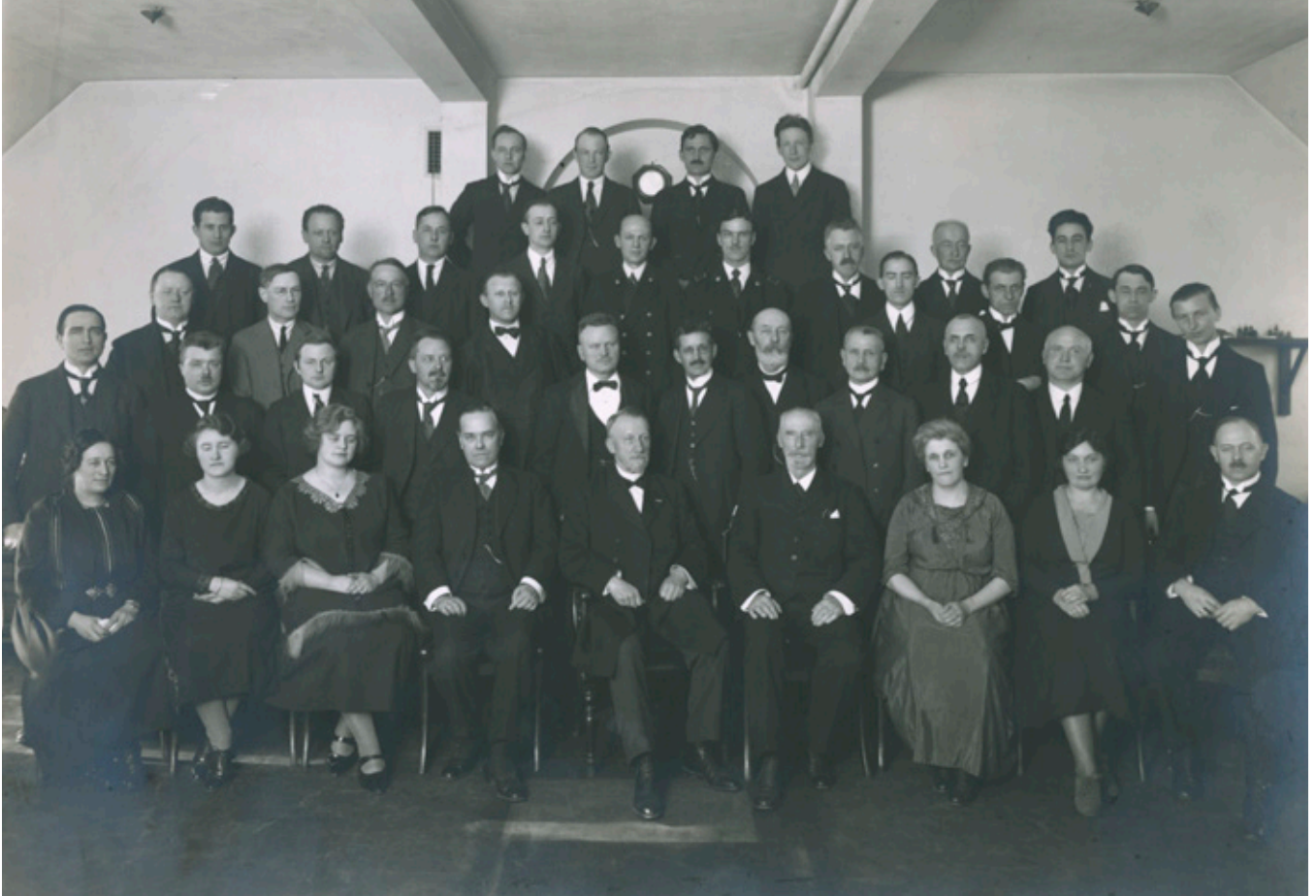
Kontorpersonale i Banetjenestens kontor ved 1. Distrikt ca. 1930. I første række ses af de kvindelige medarbejdere fra venstre en assistent og to kontorister. I højre side ses en assistent og en kontorist. Mens der stort set ikke var ansat elever i 1920'erne, var der til gengæld ansat et meget stort antal kontorister til en lavere løn, næsten alle kvinder og nu også i de mere tekniske afdelinger. Endnu de næste godt 40 år var det dog mændene, der havde monopol på stillingerne som tegner. De optræder i et antal af 10 på fotoet.