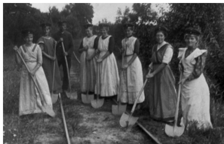
Banekolonne sammensat af kvinder på Alsener Kreisbahnen, 1914-1918. På de såkaldte kredsbaner i Nordslesvig var der under 1. Verdenskrig indsat kvinder ved anlæg og banevedligehold. Der er ikke kendskab til noget lignende nord for Kongeå-grænsen til 1920, og det blev heller ikke genoptaget efter Genforeningen i 1920, hvor kredsbanerne blev til amtsbaner.

Aktuelt er det største selskab i lokalbanedriften vest for Storebælt Go Collective, tidl. Arriva. Go Collective har i de sidste driftsår stået for kørslen på ca. 25 % af det danske banenet i Jylland samt Svendborgbanen. I ledelsen er 60/40 % målet nået. Sammensætningen i medarbejderskaren kendes ikke, og der er heller ikke offentliggjort ligestillingsmål her. For de