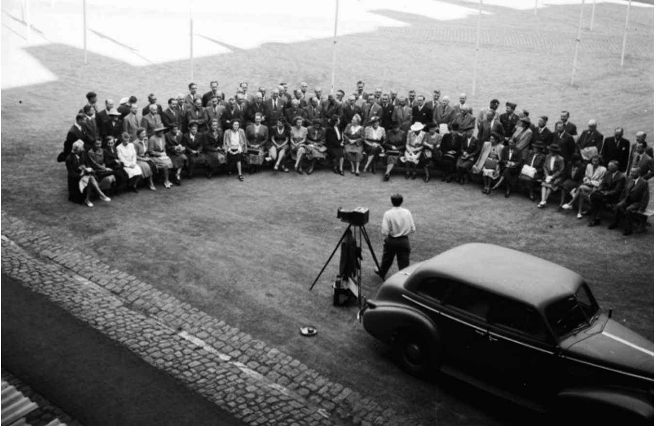
DSB's 100-årsjubileum fejres for generaldirektørens medarbejdere i gården i Sølvgade, 1947. Antallet af kvindelige medarbejdere er markant.

i forhold til overassistentstillingen efterhånden gjorde sig en vis automatik gældende.