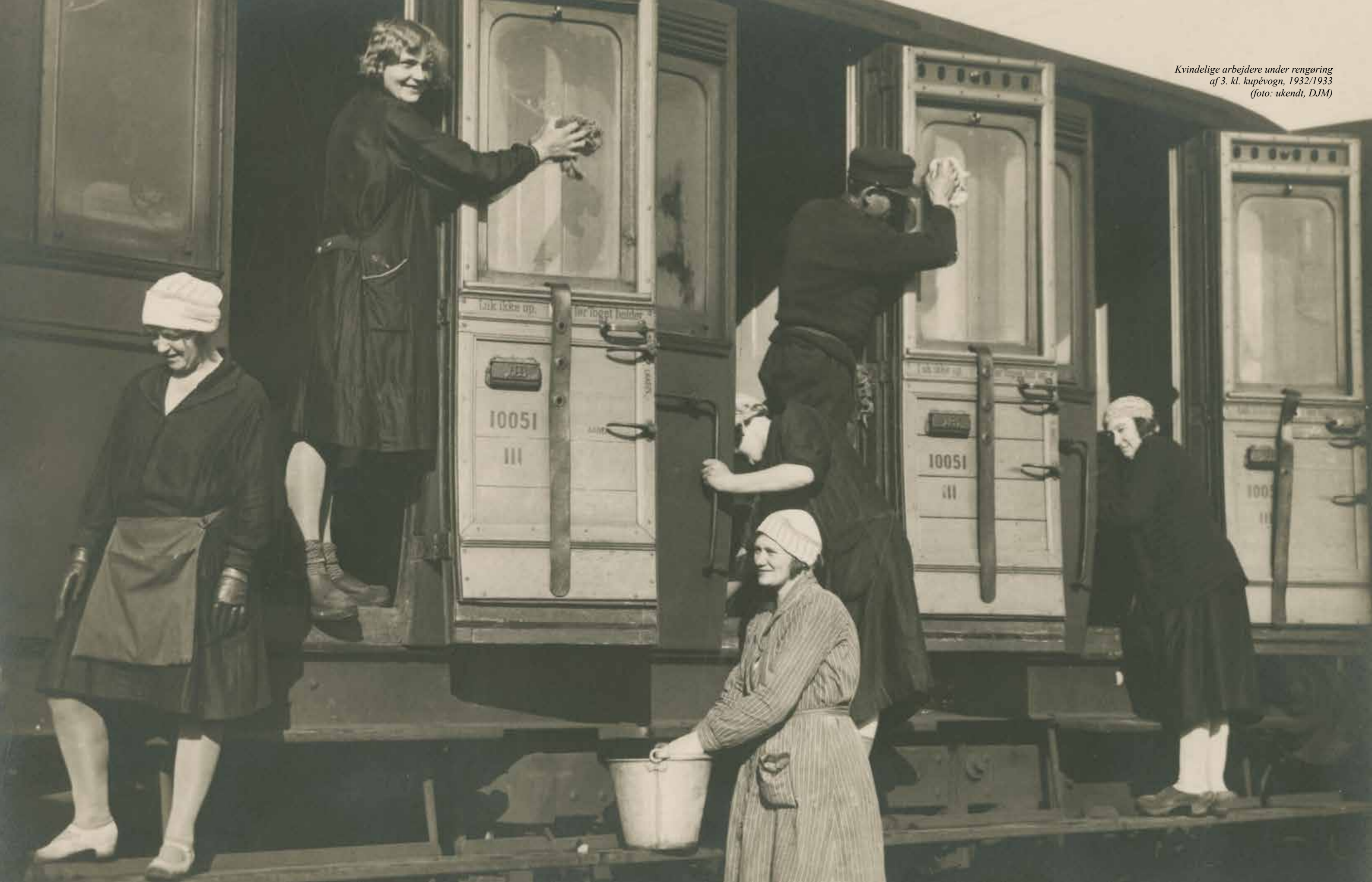
Kvindelige arbejdere under rengøring af 3. kl. kupévogn, 1932/1933