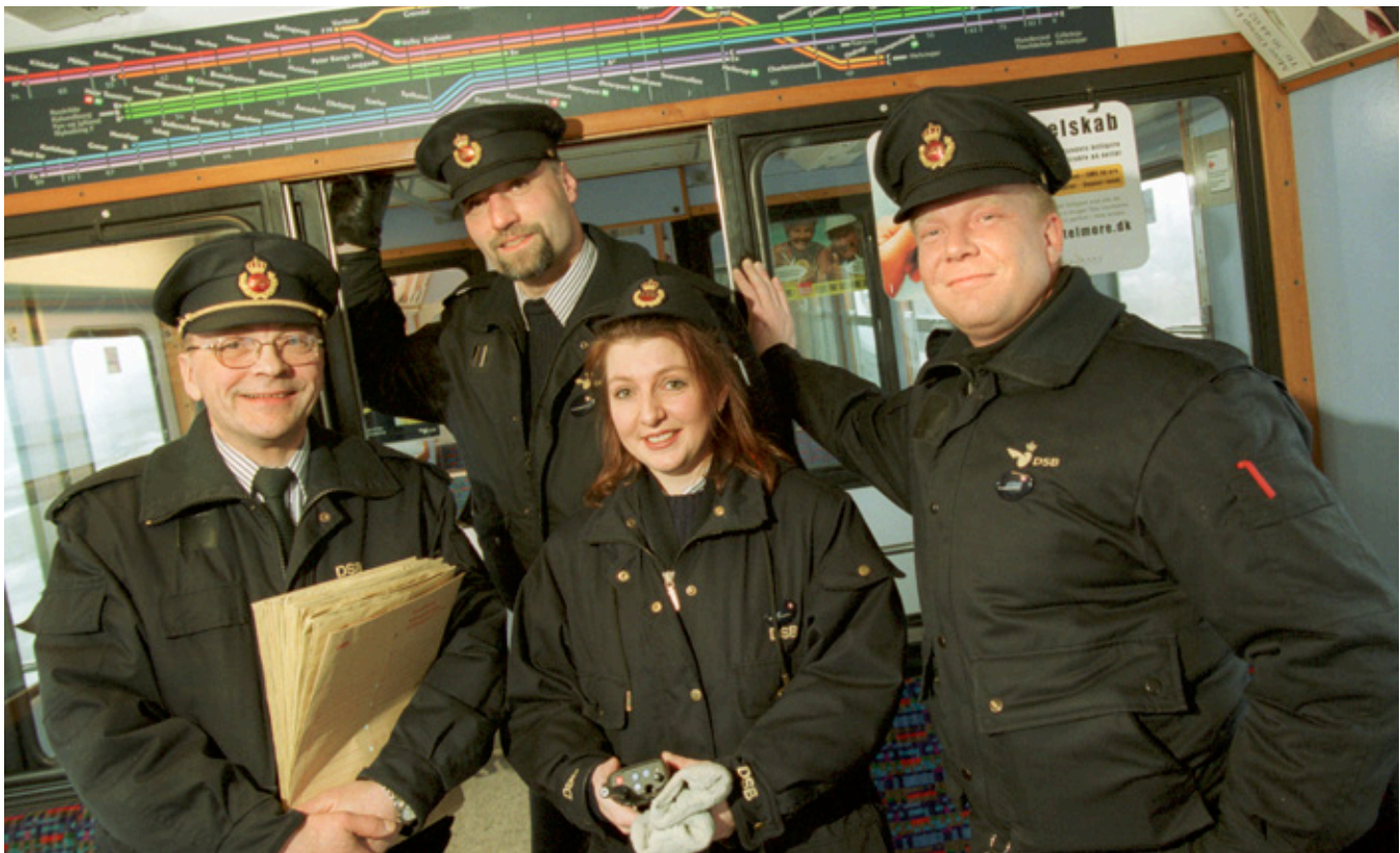
Togrevisorer fra DSB S-Tog, 2001. Kvinder havde været en del af personalestyrken fra de tidligste baner. Det var imidlertid først fra 1980'erne, at kvinder i større antal kom til banerne ved andet end kontorarbejdet.

Ser man mere bredt på kvinde- og kønsforskningen, har fokus i vidt omfang rettet sig mod de generelle strukturer i det offentlige rum i samfundet, det private i hjemmene og selvfølgelig også arbejdsmarkedet. Centrale spørgsmål har været og er, hvilke grænser der er blevet sat for kvinders liv og udfoldelse, og den kulturhistoriske proces, hvori den moderne kvindelighed er blevet formet, skabt og konstrueret. 17 Hvorfor var der så få og i mange tilfælde ingen kvinder i en lang række funktioner på arbejdsmarkedet helt frem til