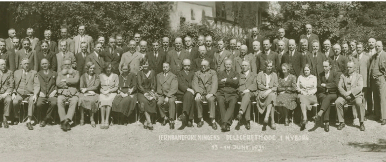
JERNBANEFORENINGENS DELEGERETMØDE I NYBORG 13 - 14 JUNI 1931

Også i slutningen af besættelsen var der kræfter, der ret uimod sagt prøvede at argumentere for, at kvinder slet ikke skulle antages som trafikelever. 127 Næ, kvinderne kunne holde sig til kontoriststillinger, men i øvrigt allerbedst blive derhjemme. Frygten for at stå uden rengøring, madlavning og huslig idyl i det hele taget blev da også direkte anført i flere indlæg, nøjagtig som i den store fejde om ligelønnen før og efter 1. verdenskrig. 128