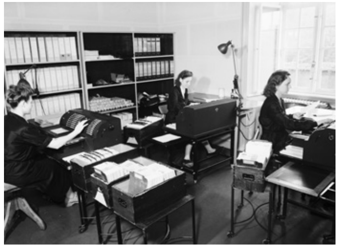
Bogholderkontoret i Generaldirektoratet i København, 1949. Det var fortsat primært i generaldirektoratet og dets regnskabsafdelinger, at de kvindelige assistenter og kontorister var ansat. Her arbejdes der med de nye bogholderimaskiner. I 1959 var det hulkort, der kendetegnede den ny teknologi. Også her var de kvindelige ansatte i centrum.