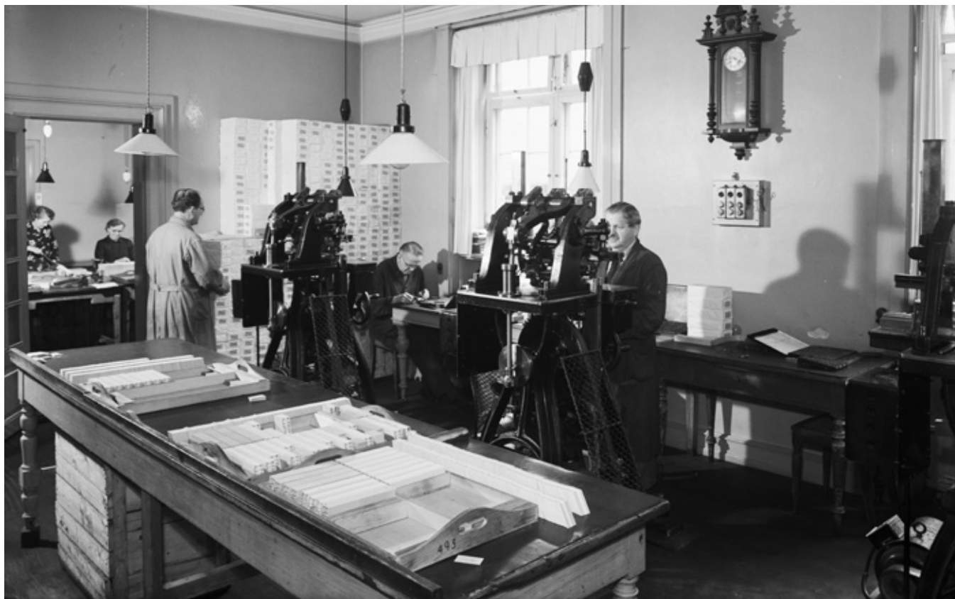
Interiør af Billet- og blanketforvaltningen 1949. De mandlige medarbejdere trykker de såkaldte papbilletter. I nabokontoret bundter og pakker kvindelige medarbejdere billetterne til forsendelse til stationerne. Denne forvaltning havde fra tidligt i 1900-tallet også haft mange kvindelige ansatte.