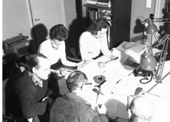
Drøftelse af kampagne for familiebilletter, 1962. I reklameafdelingen havde der længe været ansat en del kvinder (foto: ukendt, Københavns Foto-Service, DJM).

Hvor der fortsat ikke var mange kvinder i ledende stillinger på Statsbanerne, var der nærmest ingen på disse såkaldte privatbaner. Det gjaldt også for bestyrelserne, hvor de fleste medlemmer var politisk udpegede. En undersøgelse gennemført ved simpelthen at tælle antal bestyrelsesmedlemmer og kvindernes andel heraf i de danske privatbaneselskaber viser da også, at der frem til 1930'ernes anden halvdel slet ikke var nogen. Det ændredes efter kommunalvalget i 1937 med udpegnen af en enkelt.