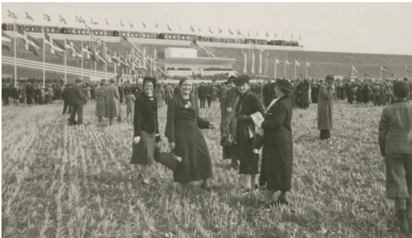
Personale fra Statsbanernes revisionskontor i København ved indvielsen af Storstrømsbroen, 26/9 1937 ved festpladsen på Masnedø. Revisionen havde fra de første ansættelser været det centrale arbejdssted af kvindelige ansatte.

Efter Statsbanernes overtagelse af driften blev der i 1951 anlagt et egentligt krydsningsspor og etableret et sikringsanlæg. Men fordi ”Fru Maegaard/Matorp” ikke var trafikuddannet og derfor ikke måtte udføre sikringstjeneste, blev stationen betegnet – noget kreativt – som uegentlig togfølgestation. Så kunne det gode og økonomisk fordelagtige arbejde på stationen fortsætte som vanligt. 136 Der findes andre beretninger, bl.a. fra dagspressen, om ekspeditricers arbejde. Et eksempel var banen mellem Varde og Nr. Nebel, hvor en ekspeditrice som noget ret nyt lige ud klagede over lønforskellen til mænd. 137 Men vinklen var i alle disse tilfælde kvinde i et mandejob.