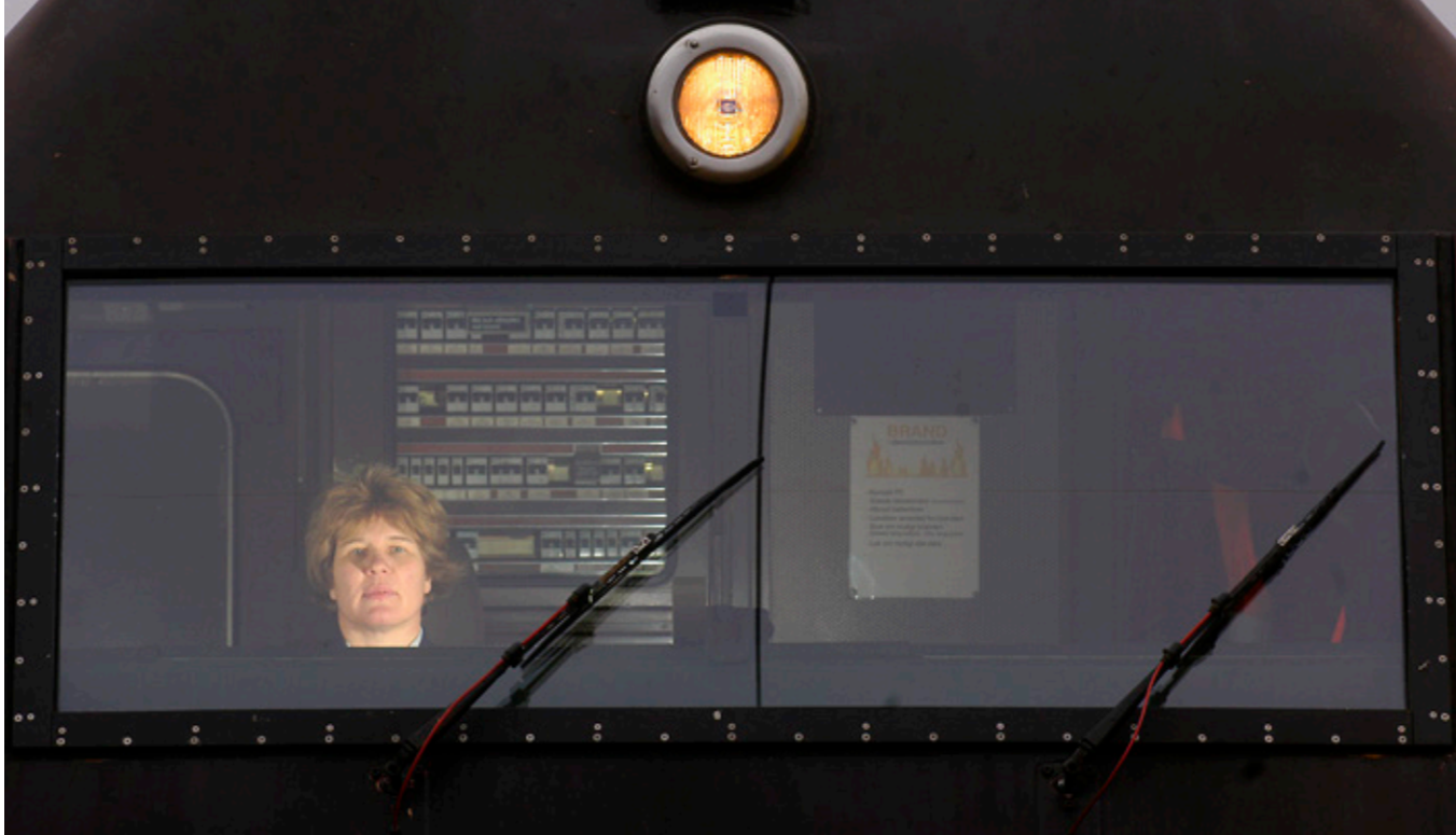
Kvindelig lokofører, 2004. I 1982 fik Danmark sin første togbetjent, året efter den første togfører og først i 1984 den første lokomotivfører. De kørende afdelinger er fortsat et af de steder i jernbaneverdenen, hvor kvinder fylder mindst