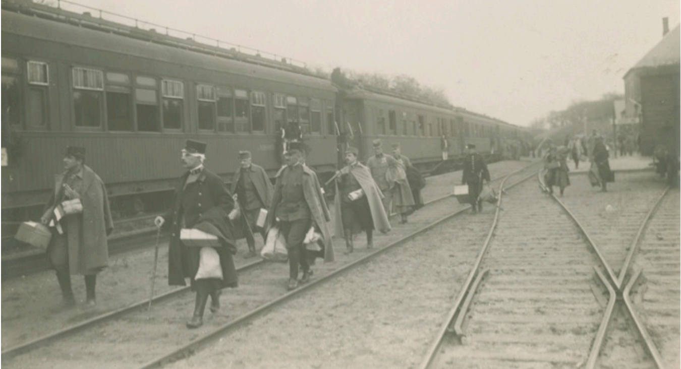
Hjemtransport af krigsfanger fra Bækkelund station, 1918. Under 1. Verdenskrig modtog Danmark syge og sårede tyske og østrigske krigsfanger fra Rusland mhp. indkvartering i Hald nær Bækkelund på Hernings-Viborg-banen. Det var en af de stationer, der blev bestyret af såkaldte "koner", en slags ekspeditricer. Men ligesom der på visse sommersøndage med stor trafik kunne være udsendt en mandlig stationsbestyrer, så blev det også tilfældet i Bækkelund i forbindelse med afsendelsen af de store fangetransporter. I pressen (Jernbanebladet) blev det i forlængelse af dens kampagne mod kvindelige stationsbestyrere til, at det var for at sikre kvaliteten af togekspeditionen.