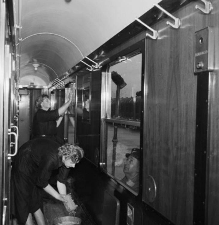
Ind- og udvendig vask af personvogn, 1955. Fra slutningen af 1800-tallet blev der i ligestillingens tjeneste fokus på at få kvinder ansat i det, der senere blev til tjenestemandstillinger, i det offentlige. Der var dog allerede mange ansat i løse stillinger bl.a. ved rengøring, dog uden nogen nævneværdig opmærksomhed. Sådan fortsatte det.