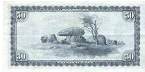
Ib Andersens 50er Landskabsserien 1952.

Og selv på sedler kan det gøres uden risiko for at øve vold på værdigheden. Alle foretrækker kulør på tilværelsen. Også leveret af seddelfabrikken. 35