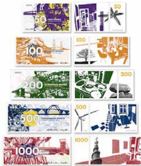
Kaspar Bonnén's seddelforslag.

hvor alt peger indad og bagud – en lidt deprimerende status her ved afslutningen på det første årti i globaliseringens tidsalder.” 64