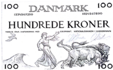
Skovgaards Gefion.