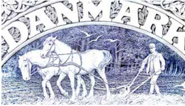
Heilmanns Plovmand – nærbillede.

Heilmanns serie blev den længst cirkulerende seddelserie, hvis motiver først blev endeligt afløst i 1960'erne. Selvom befolkningen tog seddelserien til sig, især plovmandsmotivet, der i daglig tale stadig bruges i dag, var vurderingerne ikke udelukkende positive. Akademirådet gav i 1934 følgende kritik af Heilmanns arbejde: ”Vores pengesedler er i sammenligning med de fleste lande monotone i tegningen [...] de er ikke blot overbroderede men tillige tunge i virkningen, hvilket gør dem bombastiske trods deres mangel på udtryk. Det er ingen tilfældighed, at alle folk taler om, hvor grimme de er.” 25 Grimme eller ej, plovmanden skulle vise sig at blive et gennemgående motiv og motivforslag til flere af de senere danske pengesedler.