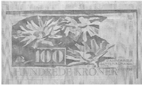
Anne Ancher i Blomsterbed.

Gengivet fra Politiken 18. februar 1983.