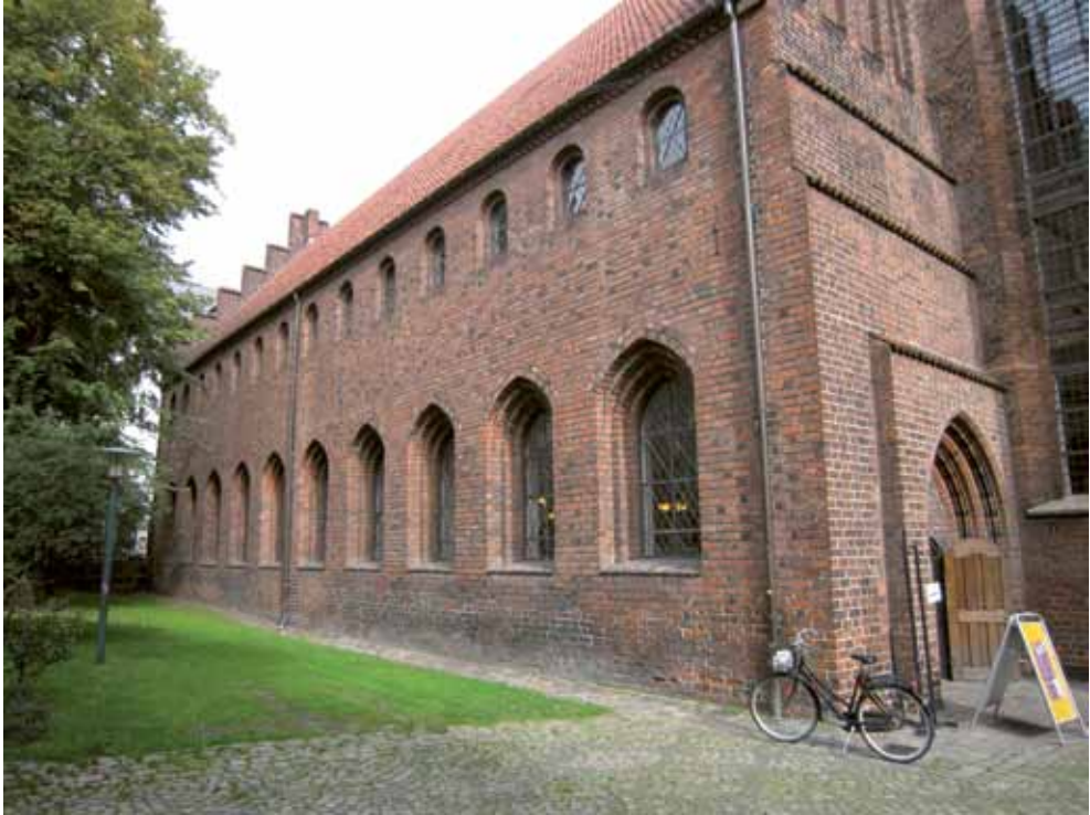
Helligåndshuset, efteråret 2011. Helligåndshuset ved Strøget er den sidste eksisterende bygning af det kompleks, som i første halvdel af 1600-tallet udgjorde Christian IV's Tugt- og børnehuset. De resterende af foretagendets bygninger blev enten nedbrudt ved gadereguleringen til den nuværende Valkendorfs-gade, Niels Hemmingsens Gade og Gråbrødre Torv eller gik til i den voldsomme brand, som hærgede København i 1728. I dag anvendes bygningen bl.a. til antikvariske bogmarkeder og kunststillinger.

til bygningsarbejde på eksempelvis Koldinghus, 45 Københavns Slot 46 og i Blekinge. 47 Eksemplet i Blekinge afviger fra de resterende ved, at løsgængerne modtog "en rimelig dagløn" for deres arbejde. Pågribelsen af løsgængere foregik både på regionalt og nationalt plan og med lensmændene som ansvarlige for løsgængerens deportation til det pågældende bestemmelsessted. Der er også eksempler på, at "føre og stærke" løsgængere skulle sendes til København uden nærmere detaljer om, hvor de skulle beskæftiges, udover at de "skulle blive sat til andet Hændernes Arbejde". 48