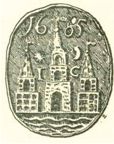
Tiggertegn af bly med Københavns byvåben, 1605. Tiggertegnet var udstedt af de lokale myndigheder, og dets geografiske autorisation var derfor begrænset til den pågældende udstedelseslokalitet. Tegnet af Peter Linde, Nationalmuseet. Her fra Olaf Olsens bog Christian 4.s tugt- og børnehus .

indtægter, der stod for tugt- og børnehusets administration. 8 Selve tugt- og børnehusets produktionsmæssige grundlag var baseret på kongemagten som både initiativtager, investor og hovedaftager. I modsætning hertil havde det været almindelig praksis for de hidtidige europæiske tugthuse, at produktionen foregik for private. 9