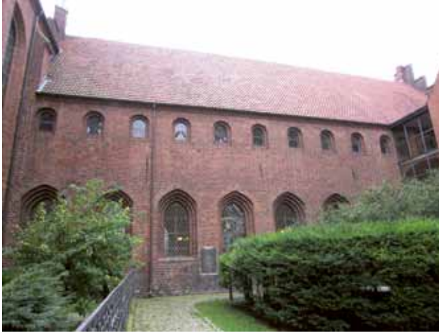
Helligåndshuset set fra modsatte side ved Helligåndskirkens tilstødende have. Efteråret 2011. (Foto: Peter Agerbo Jensen).

syn til fremstillingsprocessen af tekstiler ved brug af toldsatter, betragtes som en ændring af anstaltens kurs i en mere manufakturpræget retning.