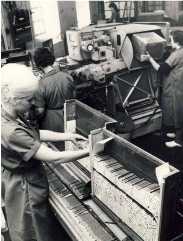
I efterkrigstiden betød mekaniseringen af tobaksindustrien, at ufaglærte kvinder gradvist overtog arbejdet i tobaksindustrien fra de faglærte mænd. En ufaglært kvinde i 1950'ernes Holstebro kunne være heldig at blive „Cigarillosdame“ på Færchs Tobaksfabrik.