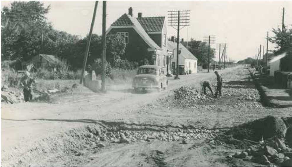
Hovedvejen gennem Mejrup Kirkeby sættes i stand, 1958. Istandsættelser af veje blev ofte udført som beskæftigelsesforanstaltning for arbejdsløse arbejdsmænd.

beslutninger om rutelægning. Et hensyn man søgte at sikre var, at passagerer fra oplandet, der skulle skifte bus i Holstebro, fik tilstrækkeligt med ventetid til, at de kunne nå at gøre deres indkøb i byen. Erhvervsrådets arbejde medvirkede til, at rutebilsnettet i midten af 1950'erne ikke længere var et „mikado-spil“ af spredte buslinjer mellem sognekommuner, men at Holstebro blev gjort til det centrale knudepunkt i områdets rutebilsdrift. 6 Derudover medvirkede Erhvervsrådet til etableringen af rutebilforbindelser til fjernere liggende købstæder, såsom Nykøbing Mors, Thisted og Aalborg.