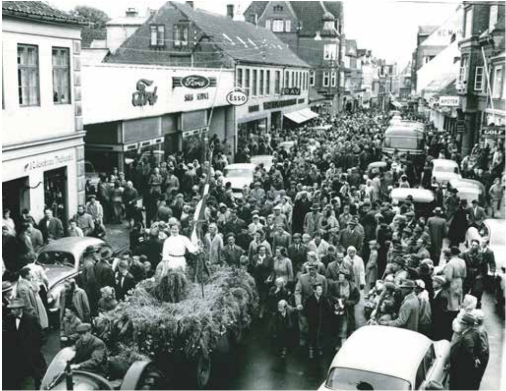
I september 1957 var Holstebro Erhvervsråd medarrangør af en høstfest til fordel for Holstebro-Hallen. Landboungdommen bidrog med et optog på 30 høstvogne, som repræsenterede samtlige sogne på egnen.