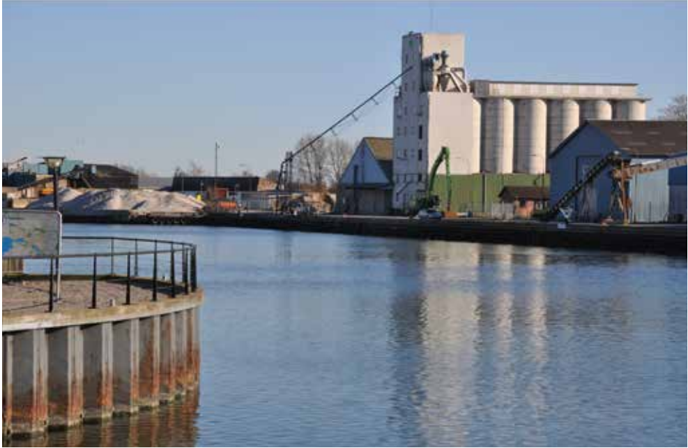
Havnen i Nakskov rummer fortsat industri og skibsfart, der dog ikke når samme niveau som i storhedstiderne i 1960'erne og 1970'erne.

„Den begrænsede iværksætteraktivitet på Lolland-Falster må også forstås ud fra produktionsforholdene. Landbruget og de store fabrikker „har jo altid været der“, og har der endelig været problemer, har man overladt det til „Tordenskjolds soldater“ (lokale fagforeningstopfolk, politikere, erhvervsamatører) at skaffe virksomheder.“ (Bom og Hestbæk 1989:38)