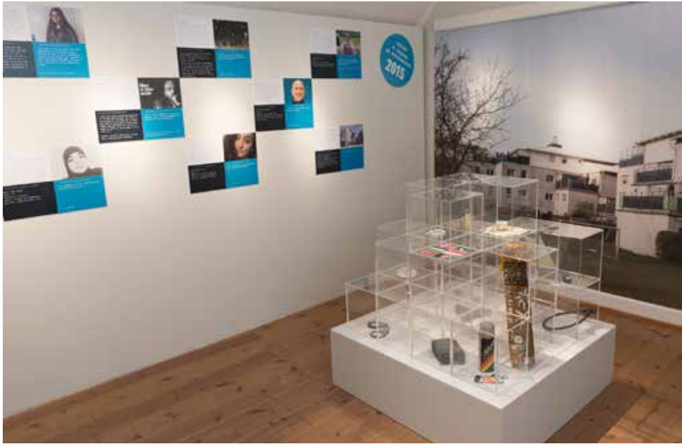
Et udsnit fra udstillingen Askerød anno 2015 ifølge 8. årgang på Arena-skolen med elevernes genstandsmontre opbygget som et modulbyggeri i stil med Askerød.