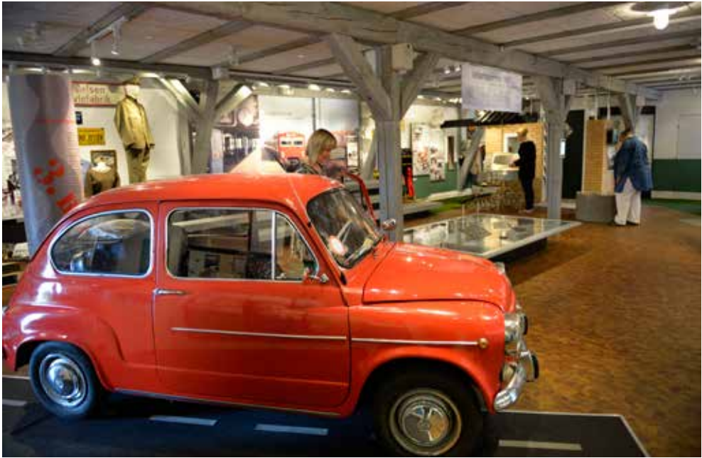
Udstillingen Velfærdsdrømme. Greve i det 20. århundrede på Greve Museum udviklet ved hjælp af et borgerinddragelsesprojekt.

se museet i et nyt perspektiv og som et rum for nye muligheder. Efterfølgende vil jeg i artiklen komme med eksempler på disse tre forskellige metoder til at udvikle et museums vidensbank og formidling i dialog med borgerne.