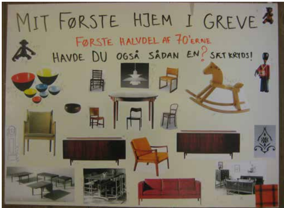
Eksempel på borgerinddragelsesprojektets brug af collager til at sætte skub i erindringen af f.eks. af boligindretning i 1970'erne.

Dacapoteatret havde specialiseret sig indenfor en kombination af konsulentvirksomhed og teater. De anvendte 'forumteateret' som metodisk greb til at grave i deltagerens hukommelse ved at konsulenterne spillede små scener ud fra aftenens tema. Ideen var at få deltagerne til at protestere mod og kommentere på denne udlægning af en fortidig virkelighed. I fællesskab skabte deltagerne så den erindrede historie – i en fælles fortælling eller i form af modstridende virkelighedsbilleder. Ved brug af teatrets visuelle, kropslige og følelsesmæssige natur fremkom detaljerede erindringer, som det er svært at spørge eller læse sig til. I alt 149 forskellige historier blev genereret og museet identificerede fire centrale hovedtemaer for borgernes forskellige 'sense of places': 1) Og hvad med børnene, 2) Arbejdsliv, 3) Fester i fællesskaber og 4) Indkøb og forretningsliv. På efterfølgende tema-aftener blev der arbejdet i dybden med emnerne sammen med udvalgte borgere.