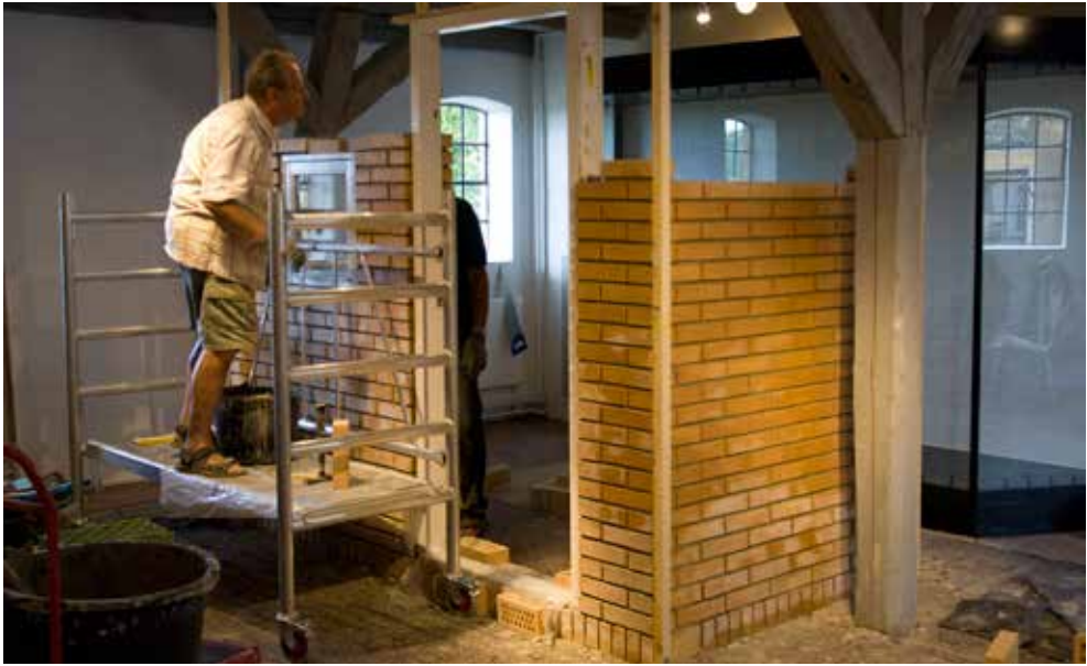
Ejerskab til museets udstilling og borgerinddragelse i sin reneste form, da to tidligere selvbyggere fra Hundige byggede en mini-udgave af deres hus fra 1960'erne.

Da borgerinddragelsesprojektet havde svært ved at få kontakt til nogle af de indvandrere og flygtninge, som også er en vigtig del i den nyeste udvikling af Greve Kommune, ansøgte Greve Museum Kulturstyrelsen om at igangsætte et forskningsprojekt i samarbejde med Immigrantmuseet. Kulturstyrelsen imødekom ansøgningen og projektet blev igangsat i begyndelsen af 2013 og er omdrejningspunktet for næste afsnit.