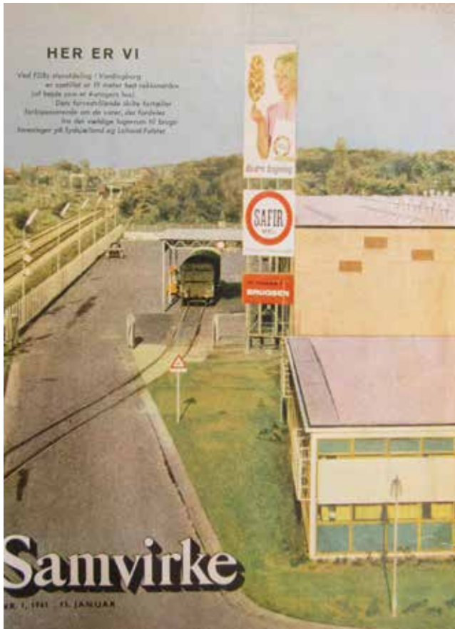
Centrallageret i Vordingborg på forsiden af Samvirke i 1961.

vidner om en meget fremsynet planlægning. Dette er også årsag til, at bygningskomplekset stadig fremstår som en integreret helhed et halvt århundrede efter, at det blev bygget. Arkitektur, æstetik, funktionalitet og fleksibilitet går stadig hånd i hånd. Komplekset er dog med årene blevet udvidet betragteligt, således at det samlede bruttoetageareal i dag er omkring 110.000 m 2 .