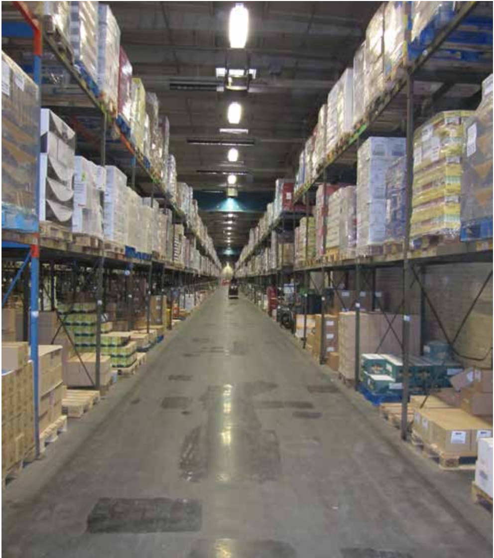
Tørvarelageret på Coops centrallager i Albertslund 2011. Vareopbevaring og -distribution er pladskrævende og optager hundredtusindvis af kvadratmeter på landsplan.