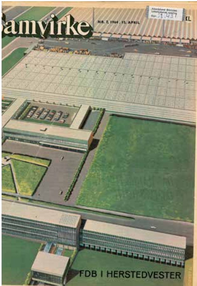
Det nybyggede centrallager i Albertslund på forsidens af Samvirke i 1964. I forgrunden hovedkontoret. På den anden side af Valensbæk Torvevej ses først tørvarelageret og bagerst (i billedets øverste kant) fabriksafsnittet.

brugsuddeleeren i Jelling til hovedkontoret for at spørge, hvad der så skulle ske! Der var endnu ikke mange leverandører af indhold til frostdisken. Men man fandt et driftigt fiskefirma i Esbjerg, der var begyndt at filetere og ville levere rødspætter til Jelling. Fiskene blev lagt på tøris og sat på toget fra Esbjerg, hvorefter uddeleeren hentede dem på stationen i Jelling. 67 Hurtigt kom andre leverandører til, men der skulle nytænkes på transportområdet, hvorfor FDB købte nogle folkevognsrugbrød, isolerede dem og lod dem køre med frostvarer. Det var bl.a. frosne ærter fra FDB's konservesfabrik i Svendborg, der hurtigt var blevet omdannet til at producere de frostvarer, som kunderne hellere ville købe end grøntsager på dåser. Og hjemme hos husmødrene opstod behovet for eget køleskab og fryser. Her var FDB igen leveringsdygtige, i det et samarbejde med den lille producent af Major køleskabe medførte stor salgssucces i de lokale brugere. Dermed var alle led i det system, der skulle til for at sælge frostvarer etableret.