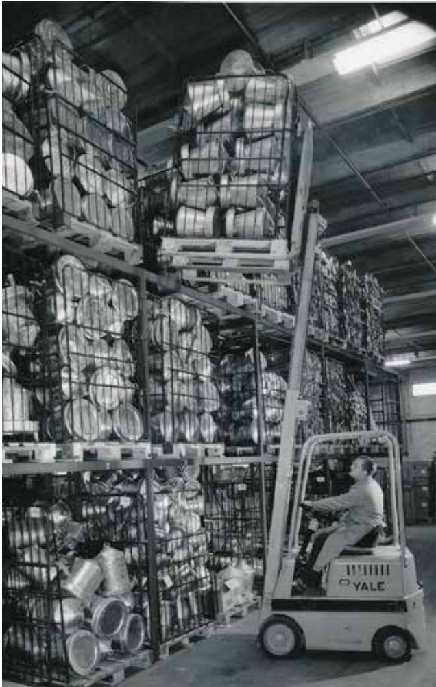
Betjening med trucks var et væsentligt element i rationaliseringen af varebetjeningen i de nye centrallagre.

seren husker, hvad Poul Nyboe Andersen sagde på et møde i Næstved i 1956, så handlede opførelsen af centrallagre bl.a. om muligheden for at lade varetransport foregå med hhv. gaffeltrucks og lastbiler. Med de nye centrallagre blev jernbanetransporten reduceret og transporten med lastbil forøget, og fra 1963 og frem udgjorde lastbilerne nerven i distributionen. 68 FDB benyttede sig, og gør det stadig i dag, af eksterne vognmandsfirmaer. Lastbiler skal køre flere kilometer end tog for at komme fra a til b, men har til gengæld en højere gennemsnitshastighed, da tog ofte skal lastes om. Det betød ikke, at lastbilerne fuldstændigt udkonkurrerede togtransporten, der i Albertslund eksisterede frem til 2006, hvor samarbejdet med DSB ophørte. Sporene findes stadig i dag og er medtaget på listen over bevaringsværdige dele af anlægget.