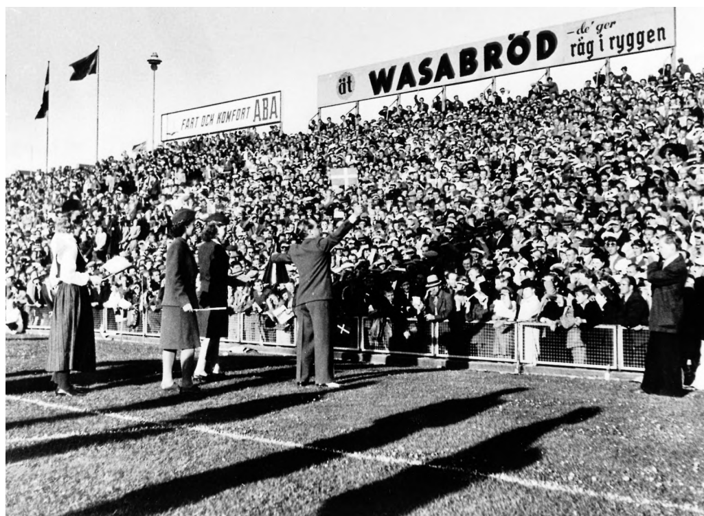
Bilden föreställer en hejaklacksledare på Råsunda i Stockholm.