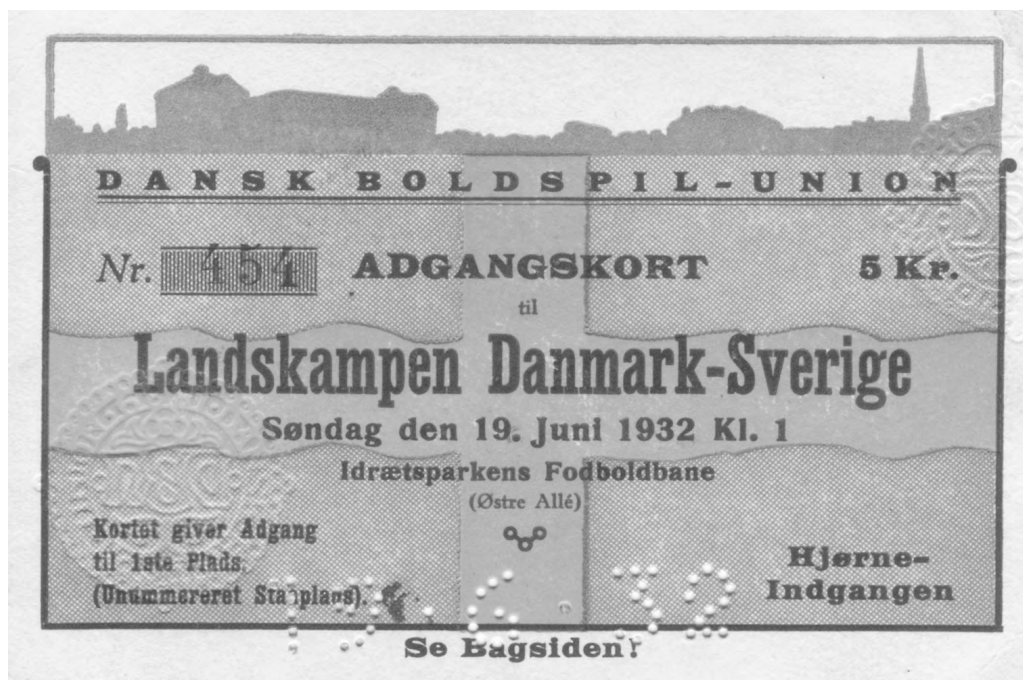
En matchbiljett från Danmark-Sverige i Köpenhamn 1932. Intressant är att den svenska flaggan avbildats på biljetten. Landskampen slutade 3-1 till Danmark.

Vid krigets ingång drogs Sverige dock alltjämt med tvivel, såtillvida att det svenska kynnet inte ansågs riktigt lämpat för fotbollen. Förhoppningen låg i att bollsinnets kunde övas upp, med då krävdes att landslaget konfronterades med utvecklande motstånd. Sådana opponenter fanns förstås i Skandinavien, i form av Danmark och Norge, men från dessa hördes fortsatta invändningar om att svenskarnas spel präglades av en överdriven hårdhet. Från svenskt håll gjordes tvärtemot gällande att ett kraftigt, manligt spel av engelsk modell var att föredra, medan »Någon sorts form av frökenfotboll passar tydligen danskar och norrmän bäst». 29