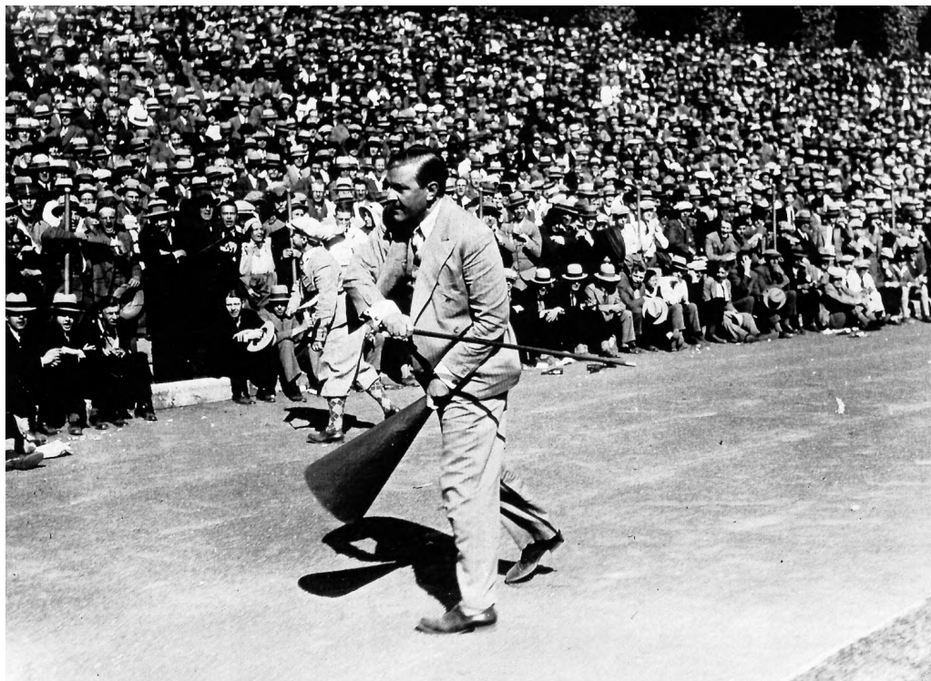
Bilden föreställer den svenske hejaklacksledaren, revyartisten, Ernst Rolf på Stockholms Stadion under mellankrigstiden.