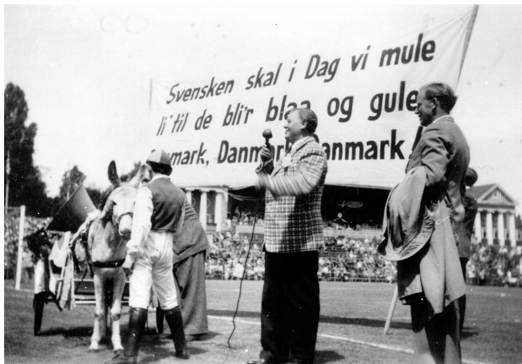
Bilden föreställer en dansk så kallad hurtigmalere i Idrætsparken i Köpenhamn i en landskamp mot Sverige.

en landskampsseger 1920, att »Den svenska olympiaelvan är väl det enda, som kan åstadkomma nationell samling i dessa valtider«. 19