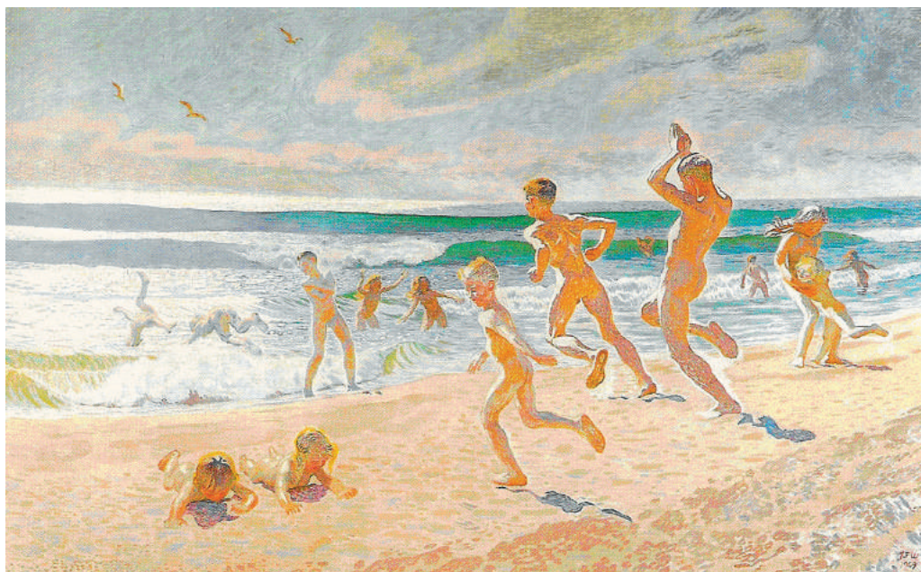
J.F. Willumsen Badende børn på Skagens Strand . »Generalprøve«, 1909 (1910). Olie på lærred, 265 x 425 cm. Deponeret af Skagens Museum.

ren og mennesket for alvor til udtryk i mere jordnære vitalistiske motiver, hvor menneskets berøring med naturens voldsomme kræfter blev skildret på godt og ondt. Willumsens skildring af naturens fatale indvirkning på mennesket ses i Efter stormen (1905) og Naturskræk (1916), hvor kvinderne flygter af skræk for naturens destruerende kræfter. Et andet vitalistisk værk Badende børn på Skagens Strand (1909) viser derimod menneskets henrykkelse og glæde over tilstedeværelsen i naturens elementer. Et af hovedværkerne, En bjergbestigerske (1904) sætter også fokus på den menneskelige eksistens og naturglæde, og repræsenterer ét af de første værker i Willumsens mere ekspressive vitalistiske malerkunst. 13