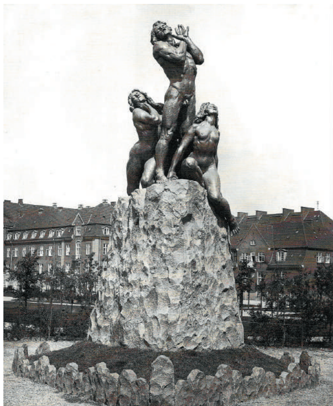
Rudolph Tegner. Mod lyset, (1909). Bronze/granit, 850 x 800 x 700 cm.

Byrummet som det så ud da »Mod lyset« blev opstillet i 1910. Den store klippesten med menneskegruppen rager godt op i Amorparken, der på dette tidspunkt ikke er vokset til endnu.