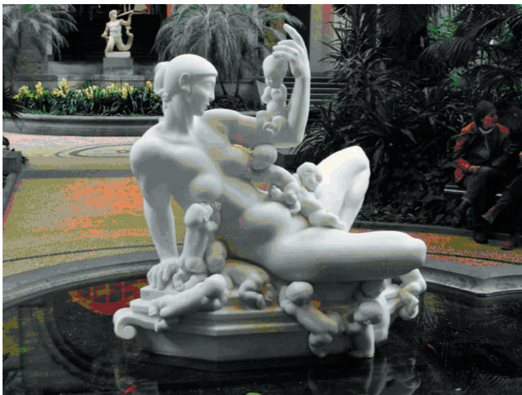
Kai Nielsen. Vandmoderen (1919-1920). Marmor, 167 x 160 cm. Ny Carlsberg Glyptotek.

børn, som optog ham meget. Hans værker var de følgende år domineret af frodige figurer af kvinden ofte omgivet af nysgerrige og myldrende børn. 29 Inspirationen til Vandmoderen fik han ved at betragte dyrene med deres unger i Zoologisk Have. 30 Billedet af en afslappet hunløve, der lader sine unger die og kravle omkring hende, manes frem, når man betragter Vandmoderen . Kai Nielsens skildring af det vitalistiske, den livgivende og frodige kvinde kommer meget godt til udtryk i hans kommentar to år efter udførelsen af figuren: