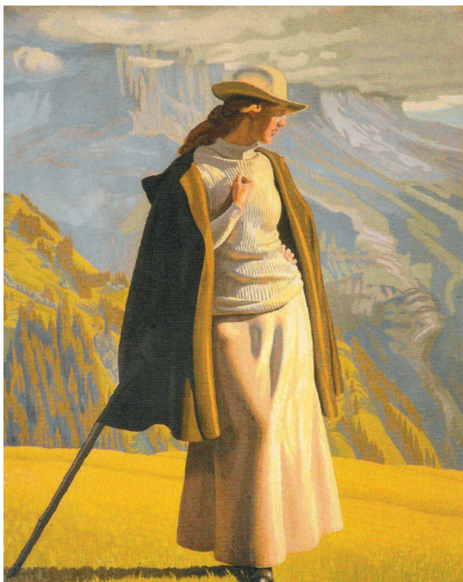
J.F. Willumsen. En bjergbestigerske, 1904 (1912). Olie på lærred, 206 x 169 cm. G.A. Hagemanns Kollegium, København.

I.P. Müller var selv en talentfuld sportsudøver med interesse for den »dynamiske sportsmand«. Hans gymnastik fordrede derimod den afspændte mandekrop og rummede naturdyrkelse, hygiejne og meditative elementer, der ifølge I.P. Müller ville frembringe en sund og stærk generation. Bukh frygtede også degenerationen i befolkningen og udviklede en elitær gymnastik for landbefolkningens unge gårdmænd, hvor vitaliteten kom til udtryk i en dynamisk, kraftfuld og smidig gymnastikform og med en hel ny mandeæstetik, der udstillede de trænedede kroppe. 12 Spørgsmålet er som sagt, om ovennævnte mandighedsdyrkelse i lige så høj grad ses inden for kunsten?