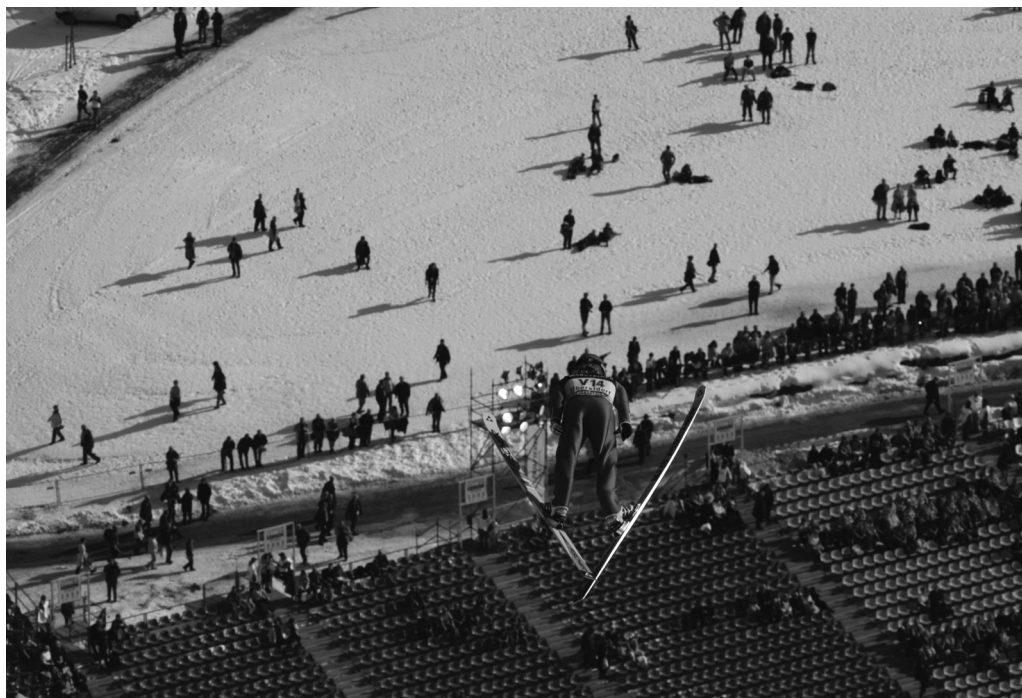
Skihopp-konkurrencen i den sydtyske by er den mest prestigefyldte i skihopp-sæsonen, og alle skisports-historiens store navne har stået øverst på sejrspodiet i Oberstdorf.

teenagepiger. De kvindelige fans tilbyder stjernerne, som ifølge Bild »hoppede ind i deres hjerter«. 76 De diskuterer idolerne og udveksler sensuelle billeder af dem over internettet. 77 Nogle fans gør åbenlyse seksuelle tilnærmelser, såsom en flok groupier ved pisten, som bærer skilte med udsagn som »Martin, jeg vil have et barn med dig«, »Hanni, hvad skal du på fredag?« eller »Hanni, du er så sexet«. 78 Skihopperne er genstand for et kvindeligt blik, og medierne afbilder dem som objekter for kvinders begær og som sexidoler. 79 Modsat i traditionelle kønsregimer er pigerne mere aktive i en jagt, hvor udøverne bliver beskrevet som ganske passive og ikke synderligt interesserede i det andet køn. »Jeg er ingen Don Juan«, fortalte Schmitt i et interview i Bild am Sonntag . 80