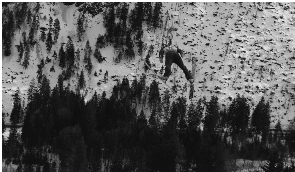
Højt over træerne svæver skihopper, når der er konkurrence på skihopbakken i Oberstdorf.

rilitet. Hvis man betragter mediedækningen af sportsgrenen og skihoppernes images før og efter V-stilens opkomst, kan man stille spørgsmål ved, hvorvidt rammerne i den medierede sportsverden for adfærd og udfoldelse af maskulinitet er blevet bredere, smallere eller mere normative?