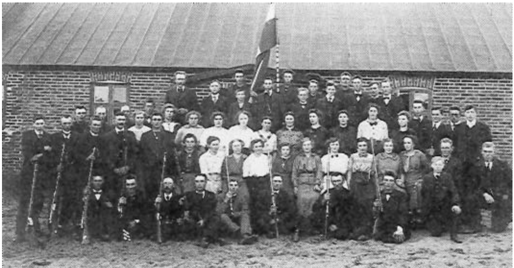
Medlemmer af Høver Skytteforening foran det første forsamlingshus.

Mange af de første forsamlingshuse i Danmark var bygget som »aktivisthuse«, opført af en kreds af ideologiske meningsfæller med grundtvigske og venstrepolitiske overbevisninger. 15 Senere blev forsamlingshusene fællesanliggender, hvor de ideologiske kampe begrænsede sig til at danne modpol til missionshuse (dog ikke i Høver) og til kampe om, hvor forsamlingshuset skulle placeres. At den politiske og den na-