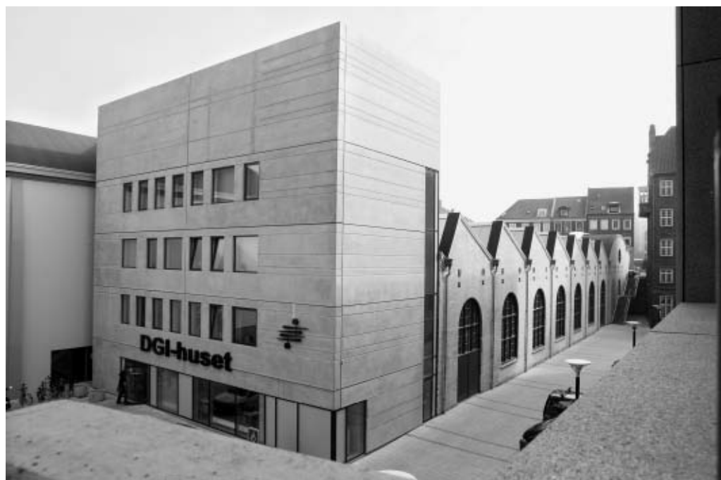
DGI-huset set fra Bruuns Galleri.

et topmoderne multiaktivitetshus med haller og rum til idræts- og kulturaktivi- teter samt faciliteter til kurser, møder og administration... DGI-Århusegnen øn- sker med huset at etablere et eksperimen- terende og nyskabende idrætsmiljø, der drives i overensstemmelse med DGI- Århusegnens formål og som sådan med- virker til at sikre og synliggøre forenin- gens værdier. 48