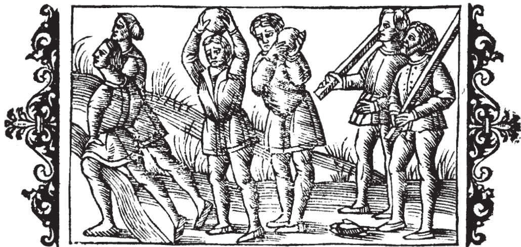
Spring over vandløb, stenløft og stokke, måske til stangspring (Olaus Magnus: Historia om de Nordiska Folken, (Rom 1555), Sth. 1976, 5. Bog. kap. 26).

Styrkeprøverne kunne også gå ud på at løfte tunge sten, som Olaus Magnus beskriver og gengiver det på et træsnit i sin beskrivelse af Norden. Det er iøvrigt en af de opgaver, der indgår som disciplin i stærkmænds-idræt (aktuelle konkurrencer om at blive verdens stærkeste mand). Opgaven kunne gå ud på at holde sig længst muligt hængende i én arm. Styrkeprøverne kunne også foregå mellem to modstandere, der holdt deres krummede arme om hinanden og trak til, indtil en af parterne blev trukket frem eller tvunget til at rette armen. Eller det kunne være hænderne, der blev holdt krummede. I dag bruges armlægning på tilsvarende måde.