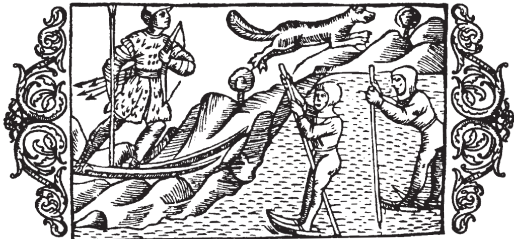
Skiløb og skilskøjteløb på isen (Olaus Magnus: Historia om de Nordiska Folken , 20. Bog, kap. 17).

af en stang på fod med en spids fane, hvorpå to pile krydser hinanden.