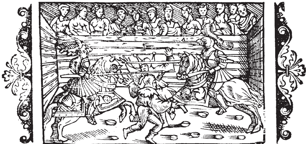
Turnering, disciplinen 'renden'. To narre laver grin med oprinet (Olaus Magnus: Historia om de Nordiska Folken, 15. Bog, kap. 18).

Lanserne var normalt lange stager med stumpe ender, lavet af fyrretræ med en styrke, så de kunne støde en rytter af hesten, men knækkede hvis ridderen sad fast i sadlen. Det var ærefuldt, hvis ridderen var i stand til at blive siddende i sadlen, når han blev ramt, så lansens knækkede. Undertiden var stagerne bevidst gjort skøre, så de fornemme fyrster kunne vise deres mod og styrke. At lanserne ofte brækkede, afspejler sig i udtrykket 'stikke og brække' om denne turneringsform. I regnskabet for hertug Frederik af Slesvig-Holsten for året 1490 nævnes der udgifter på 2 sk. til 'rendestager', mens han opholder sig på Asnæs. 37