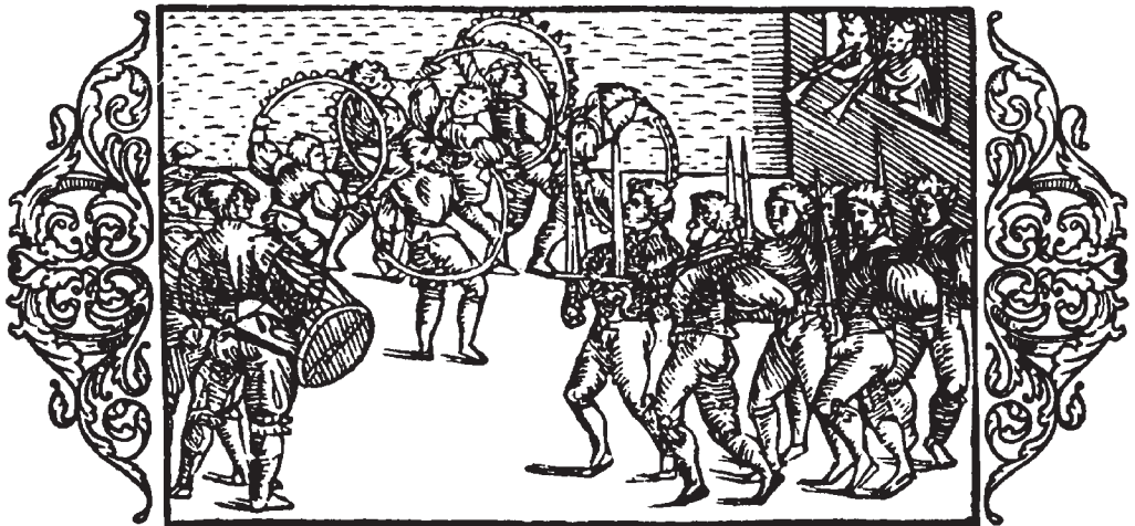
Sværddans og buedans (Olaus Magnus: Historia om de Nordiska Folken, 15. Bog, kap. 23).

Fra Nürnberg kender vi andre figurer. Broen gik ud på, at danserne stod på to rækker med klingerne krydsede parvis skråt op i