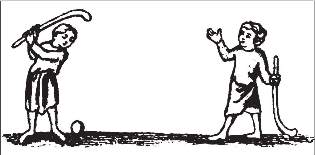
Boldspil med stokke, svarende til hockey eller 'so I hul', England 14. årh. (Jørn Møller: Gamle idrætslege i Danmark, bind 1, s. 75 (efter J.Strutt)).

tinske tekst bruges ordet 'bacilli' (buede stave) i flertal. Den ordrette oversættelse lyder derfor: »Legen er klar for den, som man giver bold og stave.« Derfor er jeg mere tilbøjelig til at mene, der henvises til en form for hockey eller lacrosse (so i hul), der begge kendes fra Frankrig i senmiddelalderen. 28