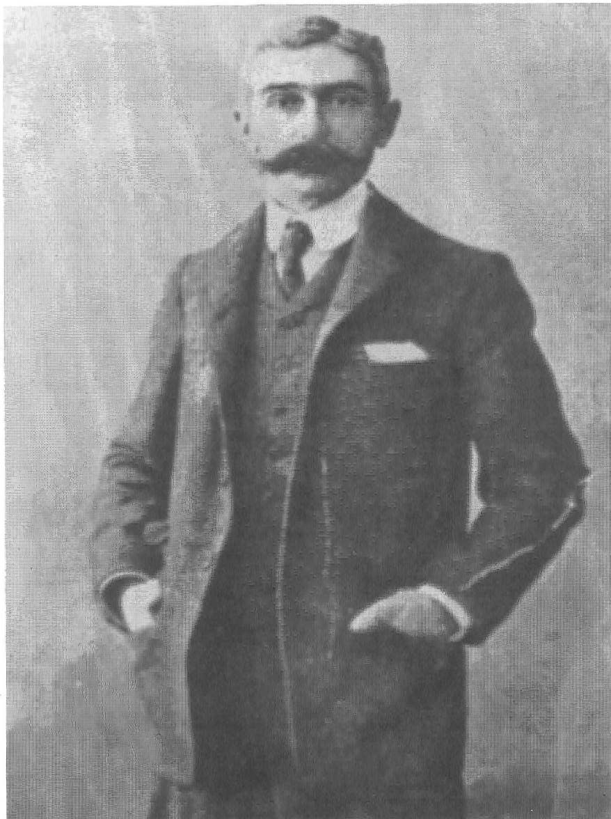
Coubertin fotograferet ved konferencen i Paris 1894, hvor genetableringen af de Olympiske Lege blev vedtaget.

(læger, fysiologer, pædagoger), der alene var interesserede i sundhed. Der var rene gymnastiktilhængere, som var imod konkurrencesport, og der var militarister, der ville forbinde legemsøvelser med krigskunsten. Engelsk sport med vægt på karakterudvikling, frihed og social opdragelse kerede de