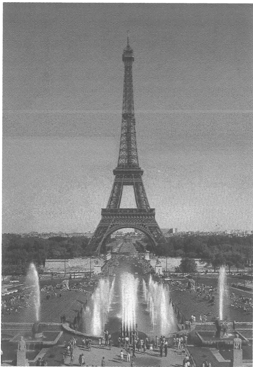
Eiffeltårnet i Paris.

tons, ved monteringen blev kun i ringe grad anvendt fast stillads. Tårnet var beregnet til ved toppen at kunne tåle en påvirkning på 22 cm ved orkan. Udsynet på toppen er i klart vejr 60–70 km.