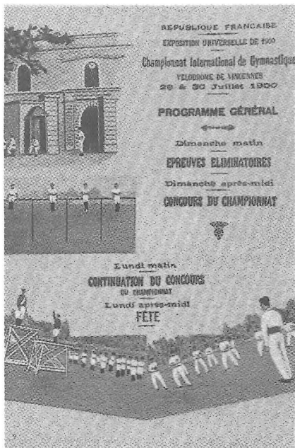
Plakat fra en gymnastikopvisning ved den anden Olympiske Lege, Paris 1900.

Til verdensudstillingen i London kom også Napoleon III og hermed var startskuddet givet til udstillingerne i Paris. Den første kom i 1855, en større fulgte