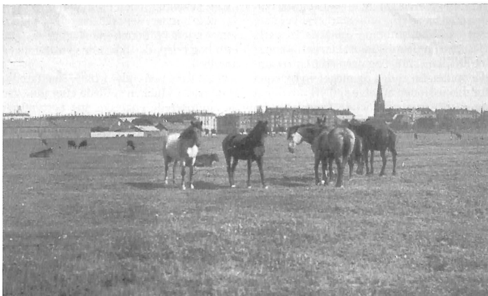
Billed af Københavns Fælled taget omkring århundredeskiftet - endnu inden fælleden blev til Fælledparken. Triangeln ses i baggrunden.

vede på Sjælland kun på de berømte overklassekostskoler Sorø, Birkerød og Herlufsholm 11). Især Sorø Akademi blev storleverandør af cricketspillere til KB i slutningen af 1870'erne og 1880'erne. KB var eneste cricketspillende klub frem til 1884 i København, og den eneste modstander KB havde i denne periode var kostskolerne 12).