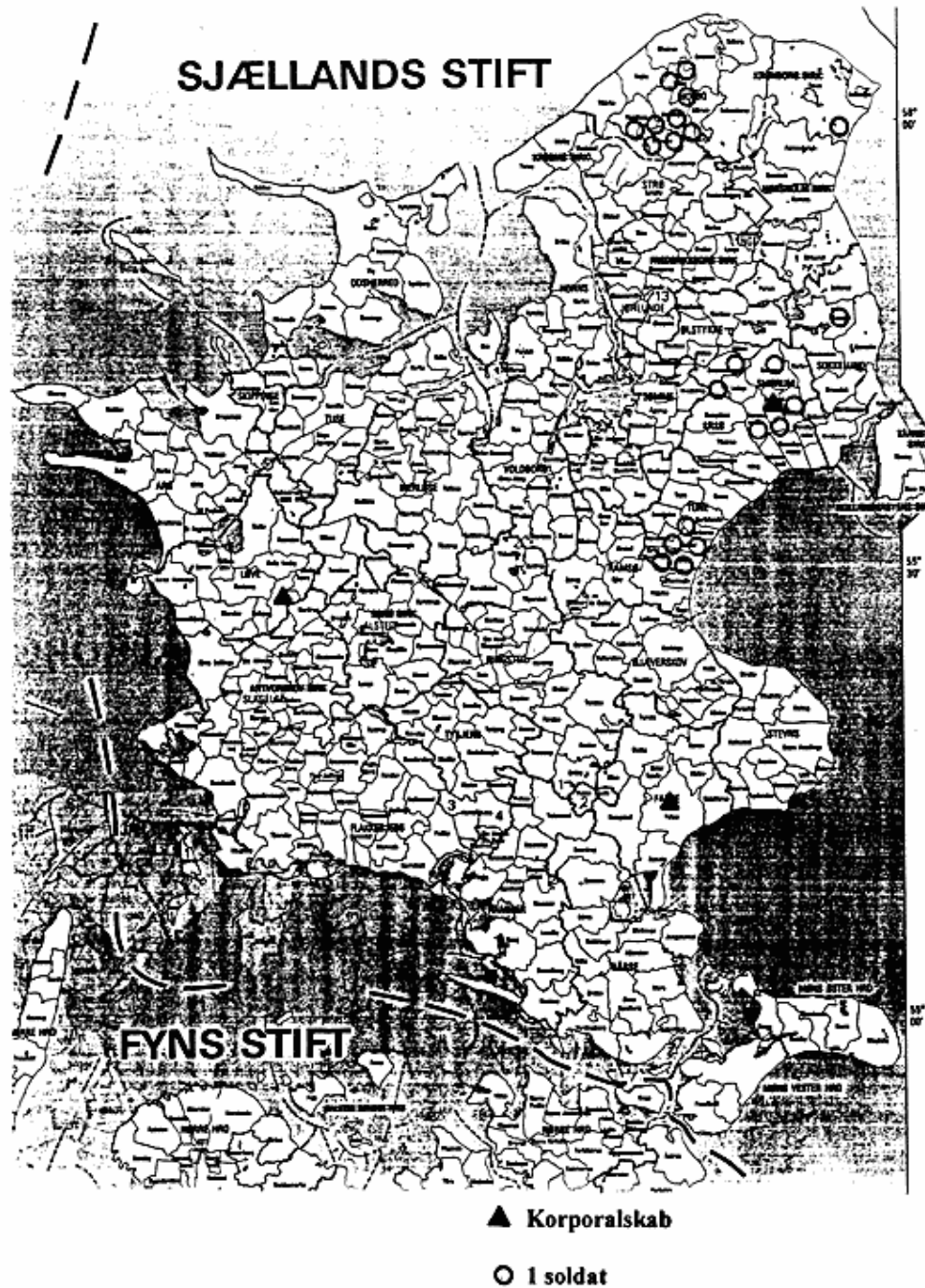
Figur 2. Kirker med vabenskab og udskevne soldater 1615

1619-21, og han har bestemt ikke overdrevet situationen. At lensmændene og dermed rigsrådet var trætte af ordningen er ikke så mærkeligt. Men både bønderne og soldaterne var det i mindst lige så høj grad.