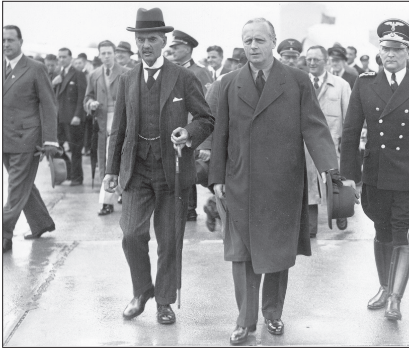
Fig. 2. Den 29. september 1938: Neville Chamberlain og den tyske udenrigsminister Joachim von Ribbentrop flankeret af tyske og engelske embedsfolk på vej til de forhandlinger, der førte til Münchenaftalen natten mellem 29. og 30. september 1938. Bemærk den trofaste paraply i Chamberlains venstre hånd.

en mulighed for kritisk stillingtagen eller ligefrem skuffelse over året, der gik. Især den kritiske stillingtagen flugter med satiretegnernes erklærede kritiske grundindstilling. Alt dette gik igen år efter år, men varieret i kraft af de dagsaktuelle problemstillinger. „Ved Aarsskiftet“ den 1. januar 1939 er et typisk eksempel herpå, men tegningen er på flere måder en særlig variant af den tilbagevendende tematik.