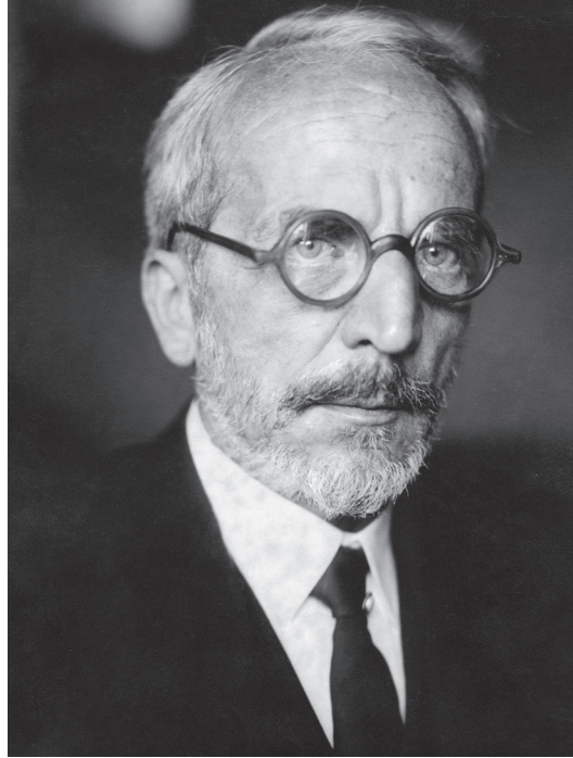
Fig. 2: Friedrich Meinecke (1862-1954), professor i historie ved flere tyske universiteter fra 1901 frem til 1932, hvor han som professor i Berlin tog sin afsked. Redaktør af Historische Zeitschrift i en menneskealder fra 1896 til 1935. En af de mest indflydelsesrige tyske historikere i 1900-tallet. Hans forskning lå inden for tysk idéhistorie fra 1700-tallet til 1945, ledsaget af et stedse mere desillusioneret syn på forholdet mellem magt og moral.