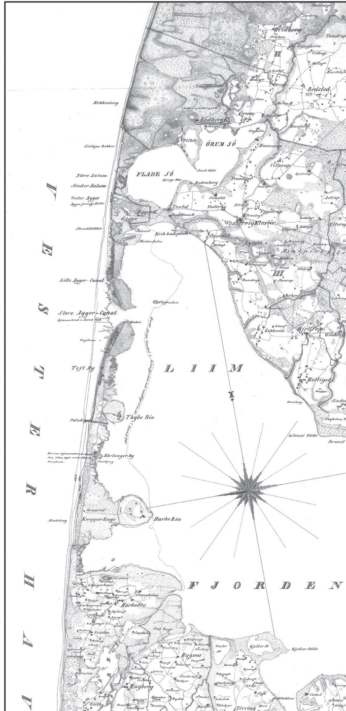
Figur 2. Udsnit af „Kort over Jyllands Vekst med Agger Canalerne“. På kortet ses tidligere kystlinjer og gennembrud på Limfjordsstangen. J. G. Wegge, 1843, Det Kongelige Bibliotek.