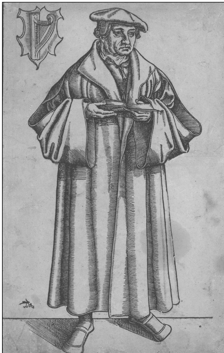
Fig. 1. På et møde i Ribe vedtog konge og rigsråd den 4. maj 1542 et tillæg til Kirkeordinansen af 1537/39 på 26 artikler. Til stede ved udformningen af Riberartiklerne var foruden befalingsmænd og superintendenter over kongerigets stifter også den tyske reformator Johann Bugenhagen. Som hovedmanden bag Kirkeordinansen var han af kongen blevet bedt om også at deltage i det møde, hvor der skulle rådes bod på mangler i ordinansen. Radering efter portræt udført af Lucas Cranach den Yngre.