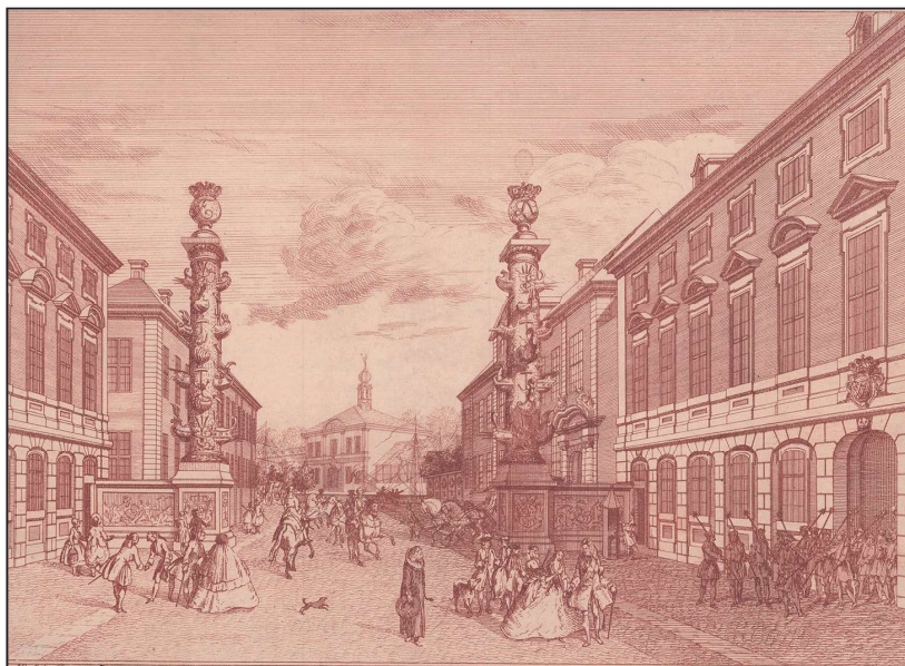
Fig. 10: Admiralitetets festdekoration i Størrestræde (nuværende Holmens Kanal). Forbilledet var de to søjler, der flankerede rostraen, den offentlige talerstol i antikens Rom. Herpå placerede man gallionsfigurer fra erobrede fjendtlige krigsskibe. Stik af J.N. Schrøder efter forlæg af Marcus Tuscher. Omtalt som dekoration nr. 37 i Frolockende Copenhagen , 1744, s. 163.

Brylluppet blev fejret med en i den danske enevælde hidtil uset pragt og festivitas, der skulle understrege samhørigheden mellem kongehus og undersætter. 13 Ikke mindst imponerede indtoget, der kunne ses af alle uanset rang og stand. Samtlige i København boende gehejmeråder, riddere af Elefantordenen og af Dannebrogordenen, generalløjtnanter og kammerherrer var tilsagt til at møde ved Frederiksberg Slot den 11. december kl. 11 med hver sin krosse med seks heste og tjenere i liberi. Generalmajorer, admiraler, viceadmiraler, konferensråder, oberster, etatsråder, schoutbynachter, kommandører, oberstløjtnanter, kammerjunkere, justitsråder og hofjunkere skulle stille personligt til hest, og langs ruten stod både garnisonens regimenter og borgerbevæbningens forskellige afdelinger opstillet i stiveste mundering. Inddraget som aktive deltagere i indtoget var således både statens embedsmænd, militæret og byens borgere, og optoget må