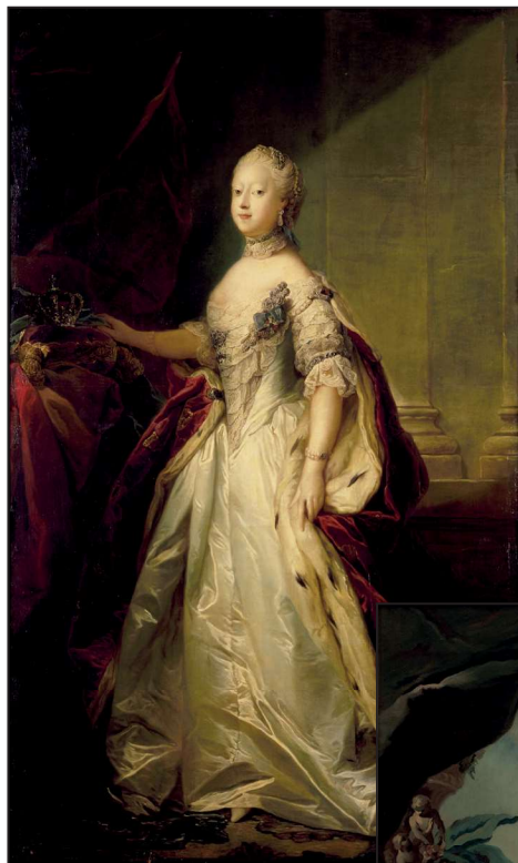
Fig. 4: Dronning Caroline Mathilde, malet af Carl Gustav Pilo ca. 1766. Olie på lærred. Rosenborg, inv. nr. 21-35.