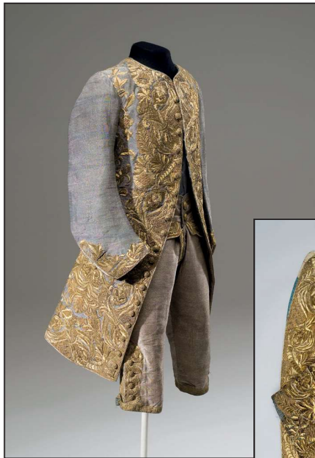
Fig. 15-16: Langærmet vest, knæbukser og kjol til kronprins Frederiks bryllupsdragt. Syet af blåligt og hvidt drap d'argent (silkestof tæt vævet med sølvtråde) og besat med broderier i guld; kjolen foret med blå silke. Rosenborg, inv. nr. 31F.3.