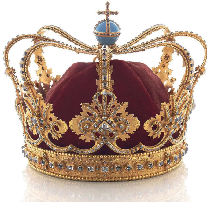
Fig. 17: Dronningekronen, set fra siden, når den bæres. På fronten sidder en brilant, hvorunder ses et kronet C6 i guldtråd. Udført af Frederik Fabritius 1731. H. 15,5. Største og mindste diameter henholdsvis 21 og 22 cm (ved bøjlerne). Rosenborg, 61-19.

må fremhæves, at dronning Sophie Magdalenes interesse for kroner ikke var en tilfældighed, for som nævnt havde Christian 6. ladet en ny dronningekrone fremstille til hendes salving i 1731. Traditionen vil vide, at Sophie Magdalene nægtede at bruge den eksisterende dronningekrone, fordi den havde været båret af Frederik 4.s anden dronning, Anna Sophie Reventlow, som Sophie Magdalene betragtede som en hore. Traditionen rummer antageligt et element af sandhed, men den overser, at den gamle dronningekrone kun havde seks bøjler og var blåemaljeret, medens kongekronen har otte bøjler og lyser i guld. For at skabe større samklang blev den nye dronningekrone derfor udført som en formindsket og lettere udgave af kongekronen, og kronens otte bøjler hviler på gennembrudte og fligede blade, hvis silhuet minder om den lille brudekrones (fig.17). 25 Har Sophie Magdalene ønsket at give sin engelske svigerdatters brudekrone et „dansk“ islæt? Og har Louise båret brudekronen med de to kors over ørerne og de to liljer over pande og nakke?