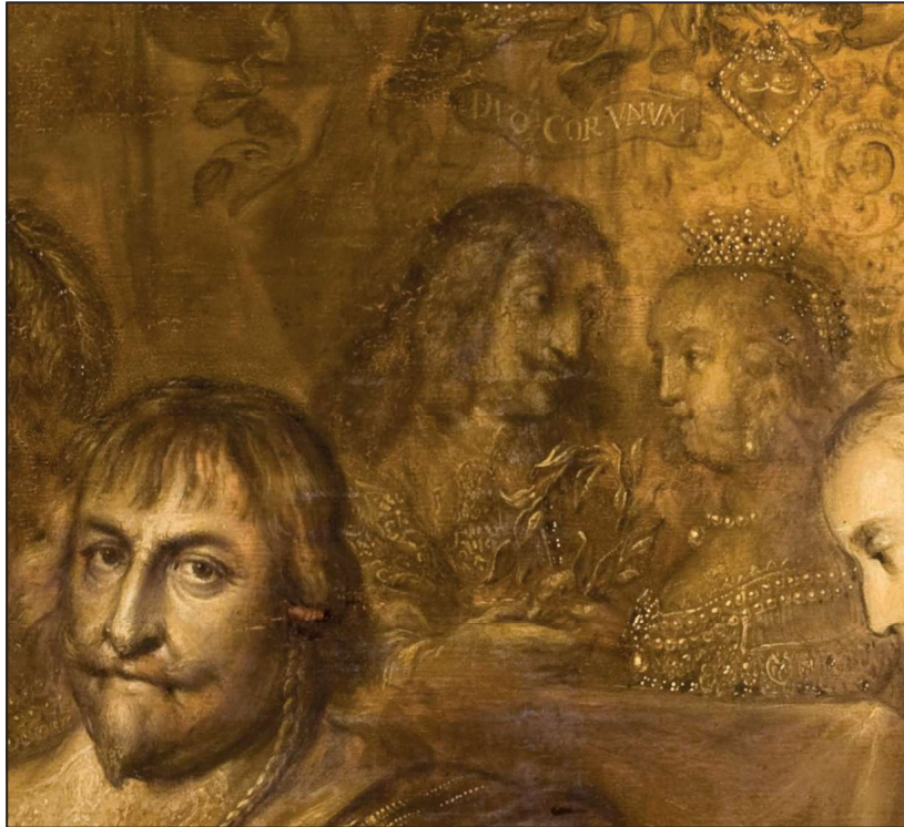
Fig. 18: Den senere Frederik 3. og dronning Sophie Amalie som nygifte bag Christian 4. Detalje fra maleri af Christian 4. som fredsmægler, udført af Adrian van der Venne 1643. Grisaille på træ. Rosenborg, inv. nr. 7-12.

ge Christian 4. som europæisk fredsmægler (fig. 18), 30 og da Sophie Amalie som enke, i 1680, bortgiftede sin yngste datter, prinsesse Ulrika Eleonora, til Carl 11. af Sverige, indgik der en krone i datterens brudeudstyr. 31 Også de to næste generationer, Christian 5.s hustru, Charlotte Amalie af Hessen, 32 og Frederik 4.s første dronning, Louise af Mecklenburg-Güstrow, 33 anvendte brudekroner i henholdsvis 1667