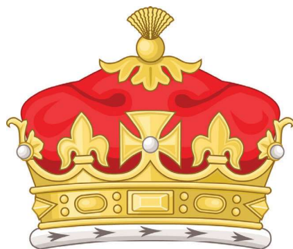
Fig. 3: Hertugen af Cambridges rangkrone (Wikipedia, Coronets).

Det er formen på kronens otte takker, der peger mod en engelsk oprindelse. For så godt som alle engelske konge- og dronningekroner smykkes af skiftevis kors og liljer, og på rangkroner for regentens børnebørn anvendes kors og liljer i kombination med stiliserede jordbærblade – nøjagtig som her, men dog med en dusk af guldråde på toppen af den violette puld. Det gælder f.eks. rangkronerne for prins William og prins Harry (fig. 3), sønner af prins Charles af Wales og dermed børnebørn af dronning Elizabeth 2. 3