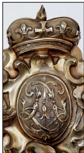
Fig. 8: Kopstykke på sættets spejl med dronning Louises spejlmonogram under en coronet med kors, liljer og „dusk“ på pulden. Udført af guldsmeden Johann Ludwig Biller 2. i Augsburg i 1743. Rosenborg, inv. nr. 12-120.