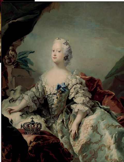
Fig. 5: Dronning Louise i salvingsdragt, malet af Carl Gustav Pilo 1747. Olie på lærred. Statens Museum for Kunst, inv. KMS4071.

Rosenborg fra hoffet i 1785 og følgelig – da udformningen er engelsk – kunne være blevet bragt til Danmark af en af de to engelske prinsesser, der blev dansk dronning, enten Caroline Mathilde (fig. 4), der ægtede Christian 7. i 1766, eller Louise (fig. 5), der blev gift med Frederik 5. i 1743. Men af hvem og til hvilket brug? I det følgende skal disse spørgsmål søges besvaret ved inddragelse af hidtil ubenyttede arkivalier og oplysninger fra begge sider af Nordsøen.