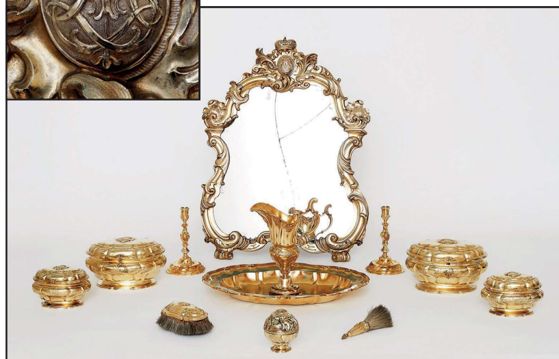
Fig. 7: Dele af dronning Louises rejsetoilette af forgyldt sølv, udført af fem forskellige guldsmede i Augsburg 1741-43. Rosenborg.

Hvad så med Frederik 5.s Louise? Da kronen blev oversendt fra hoffet til Rosenborg i 1785, medfulgte et stort forgyldt rejsetoilette, hvis dele prydes af Louises kronede monogram, og som bærer guldsmedestempler fra Augsburg 1741-43 (fig. 7). 6 Den fælles fremsendelse kunne pege på en fælles proveniens fra Louise. Men de kroner, der anvendes på toilettets dele, viser kun kors og liljer samt en dusk på pulden (fig. 8) og er således ikke af samme type som den lille krone. Denne ser derfor ikke umiddelbart ud til at stå i sammenhæng med rejsetoiletet. Derimod stemmer dettes kroneformer overens med det dekret, som Louises fader, George 2., ved sin kroning i 1727 lod udstede om, at hans fem døtre skulle bære en krone, der var sammensat af kors og