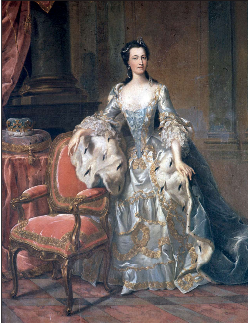
Fig. 9: Mary af Storbritannien, landgrevinde af Hessen, malet af Johann Heinrich Tischbein den Ældre ca. 1752. Kulturstiftung des Hauses Hessen, Museum Schloss Fasanerie.