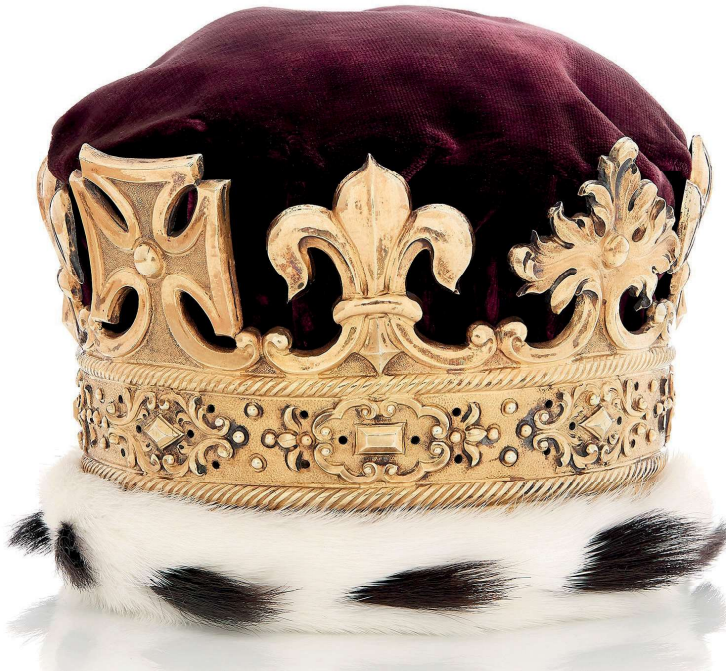
Fig. 19: Kronprinsesse Louises brudekrone beklædt med hermelin. Udført af Hans Mundtberg i dagene 7.-10. december 1743.