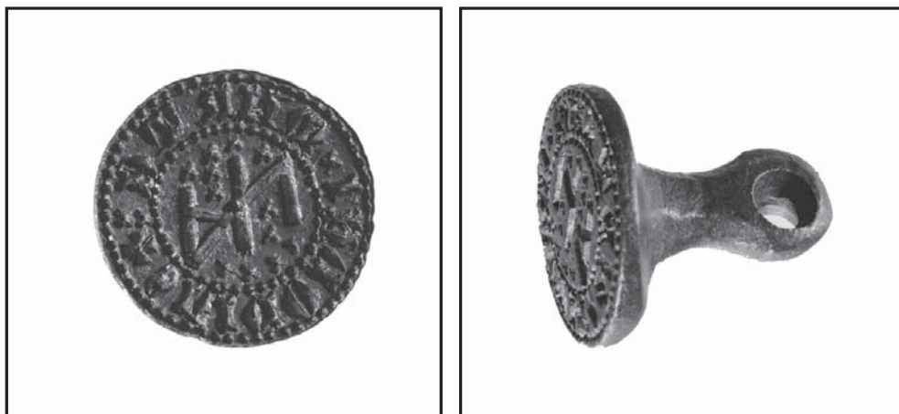
Fig. 1. Seglstempe ejet af fæstebonden Nis Mardh, midt 1400-tallet. Bønders brug af segl i middelalderen kan spores helt tilbage til 1300-tallet. Ved at optræde som medbeseglere af breve og tingsvidner indtog bønderne en position, der er traditionelt i forskningen er betragtet som aristokratiets privilegium (besegling). Herved er seglstemper levn til en situation, hvor bønder og aristokrati kunne agere på samme måde i tingenes sociale, kulturelle og juridiske sfære. genstandsnr.: D25-1993.

Landskabslovene forudsatte, at nævningene i markskels- og skurnævningesager var selvejere, og som helhed er der mange eksempler på, at det udtrykkeligt var selvejere – og ikke fæstere – som vidnede og granskede i trættesager [og] Endelig er der grund til at anføre den senmiddelalderlige sociale mobilitet som en – i forhold til fæstebønderne – statusfremhævende faktor for selvejere. Det er velkendt at der var en social mobilitet mellem selvejernes øverste række og lavadelen, hvilket for bønderne betød en mulighed for opstigen i det sociale hierarki. 53