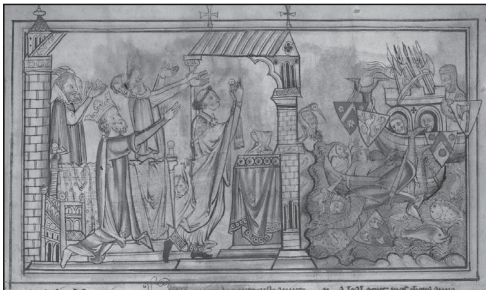
Fig. 2: Det eneste bevarede håndskrift med Matthew Paris: La Estoire de Seint Aedward le Rei. I billedets venstre halvdel ses St Edward Bekenderen og hans præster løfte deres hænder i bøn. Samtidig, i billedets højre del, ses den danske konge, bærende et skjold med de berygtede daneøkser som våbenmærke, styrt i havet fra sit skib.

at kunne konkludere om disse. 21 Når ny information blev tilgængelig, opdaterede han også sine konklusioner. 22