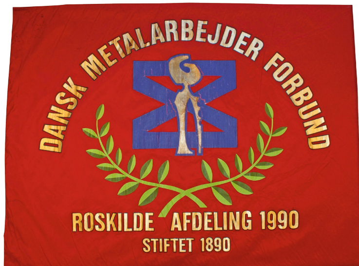
Afdelingen fik en ny fane i forbindelse med 100 års jubilæet i 1990.

Det første nummer af bladet havde kostet 6.000 kr., og det blev rost meget. I marts 1978 foreslog Ebbe Rafn, at med-