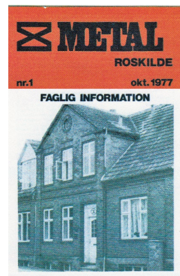
Afdelingens første blad med Metalhuset i Borgediget på forsiden. Okt. 1977.

På efterårsgeneralforsamlingen i 1994 erklærede formanden, at "kurven er knækket", og i de første 6 måneder af 1994 var 124 metalarbejdere gået fra arbejdsløshed til beskæftigelse.