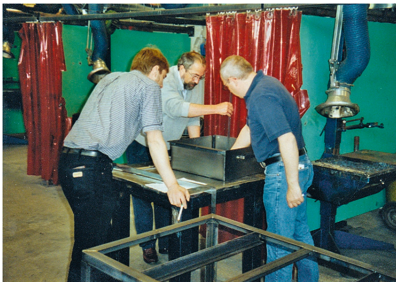
Et svendestykke vurderes af skuemestrene. Privat foto formentlig fra 2005.

Der blev uden resultat holdt mæglingssmøde med arbejdsgiverens organisation, og afdelingen hyrede en advokat for at få vurderet, om sagen kunne bære en retssag. Det kunne den tilsyneladende ikke. Derfor blev sagen ført over i Ligestillingsnævnet, og her stillede Metal Roskilde krav om en efterregulering af kvindens løn. Sagen sluttede med, at den