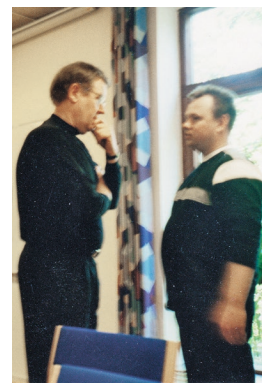
Tidligere statsminister Poul Nyrup Rasmussen på besøg i afdelingen. Privat foto fra 2005.

Det var grunden til, at man i den næste overenskomst skulle kræve ret til en uges betalt efteruddannelse om året, og at alle virksomheder skulle have en uddannelsesansvarlig. Metal Roskilde ville rejse spørgsmålet på den kommende kongres i Forbundet.