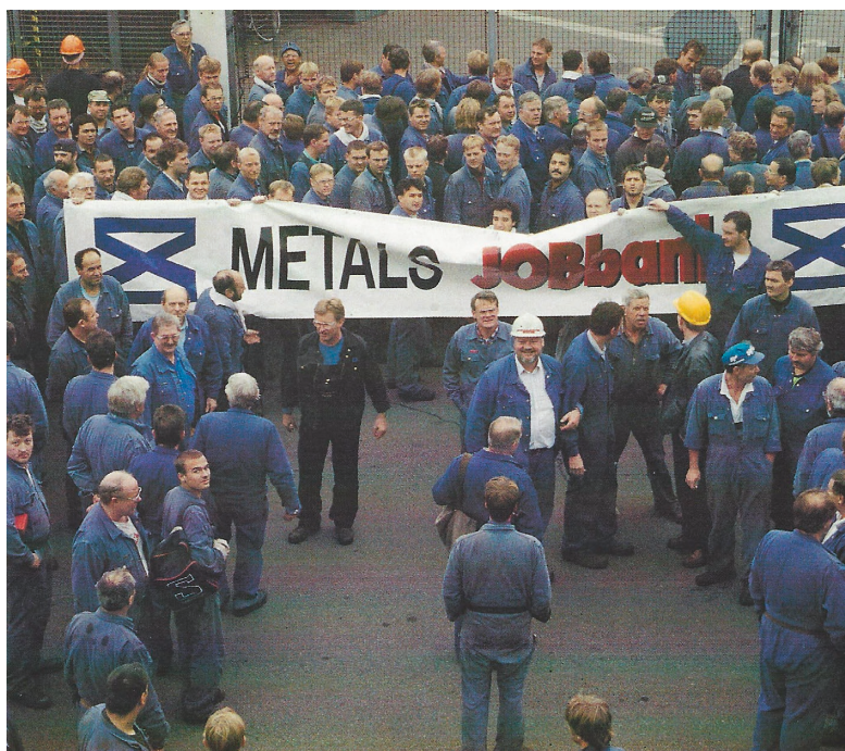
Medlemmerne viser "Metals jobbank" frem ved en demonstration i 1995.