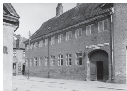
Liebes Gård, Sct. Ols Gade 18, hvor der indrettedes museum i stuelejligheden til venstre for porten i 1930.