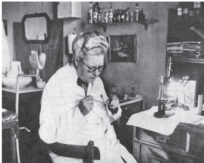
Foto: A. E. Andersen 1944. Fra ugebladsartikel i Roskilde lokalhistoriske Arkiv.

officielle sprog. Ofte blev der desuden taget en blodprøve af den udlagte barnefader til bestemmelse af hans blodtype for at se, om man ad denne vej kunne afsløre hans medvirken til den nye baby.