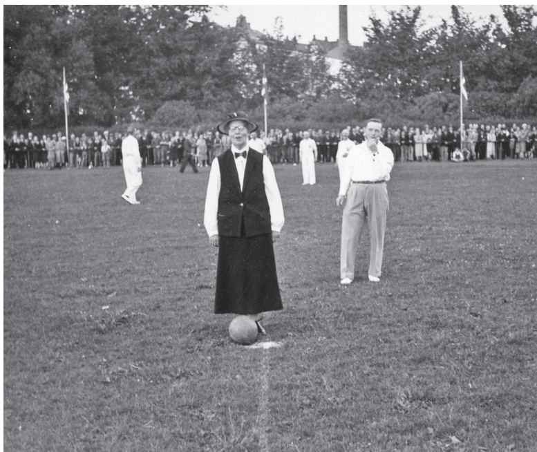
Embedslægen gav bolden op ved velgørenhedsfodbold juni 1938. "Jul i Roskilde" 1938. Originale foto i Roskilde lokallhistoriske Arkiv.

Kredslægen blev altid tilkaldt ved selvmord for at foretage legalt ligsyn, som det hed i fagsproget. Det vil sige, at hun skulle fastslå dødsårsagen, for at man kunne udelukke mord. Af andre opgaver kan man i flæng nævne levnedsmiddelkontrol, vaccinationer, lægeligt tilsyn med indsatte i arresthuse og fængsler, mental observation af sædelighedsforbrydere og mordere, med videre: Undertiden ret uhyg-