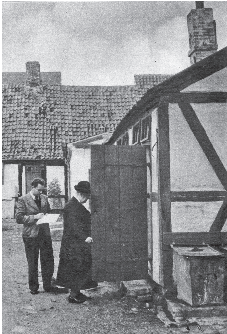
Embedslægen på retiradekontrol efter klager over stank.