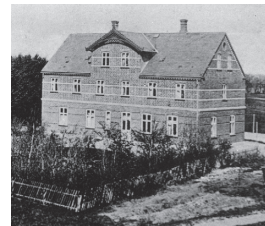
Rolykke nær Sæby, hvor familien Wied boede 1894-97. Foto ca. 1920.

En måned efter flyttede familien ind på "Rolykke", et ned- lagt mejeri, der lå et stykke uden for Sæby i Nordjylland. De skulle leve af det, Gustav kunne tjene på sin forfattervirk- somhed, som endnu ikke var særlig veletableret. I brevene kan vi se, hvor fattige de var: "Kun sønnen er der mælk til. Vi andre har fået prosa til middag og poesi til aften." Et andet sted skriver han: "Nu er der kongelig ro i huset. Men også rotter. Dem agter jeg at fange og leve af." Og et tredje sted inviterede han