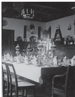
Opdækning til festban- ket i familien Wieds spisestue den 6. marts 1910.

selsdage, jul og andre højtider, men også til hverdag. Således fulgte Gustav sin datter hen i pigeskolen på Palæet hver dag.