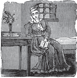
Forsideillustration fra skillingsvise om Annas fængselsdom. Strandbergs Forlag 1880.

liv var forspildt, men sådan kom det på forunderlig vis ikke til at gå. For hun havde en indre styrke, som man ikke skulle have tiltroet hende, og desuden det held at have en familie, der støttede hende, og ikke mindst en far, der var sagfører.