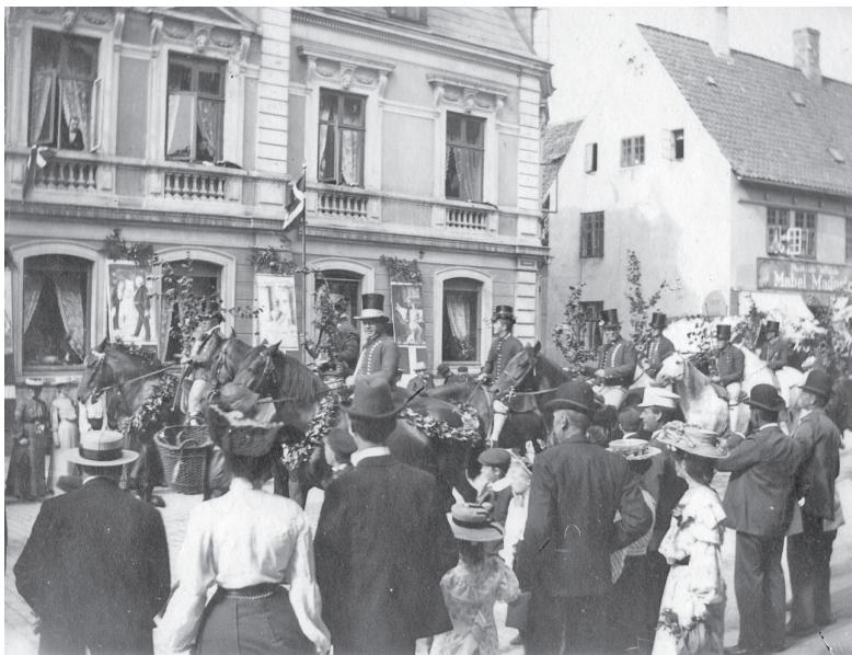
Fotografi taget af Just Thorning på børnehjælpsdagen i 1905 ud for Hotel Prindsen. Roskilde lokalhistoriske Arkiv.

disse rejser foregik ligeledes på cykel og førte ham så langt væk som til London. Turen gik via Holland, hvor han tog en færgе over fra Hoek van Holland til England. Herved vedligeholdt han forbindelsen med de firmaer, især et par større vinfirmaer, som han allerede havde lært at kende i sin tid som hushovmester i London, men han skaffede sig også nye leverandører på disse ture. På sine ældre dage overtalte han ofte bekendte til at slå følgeskab, så han ikke skulle tage den lange tur helt alene.