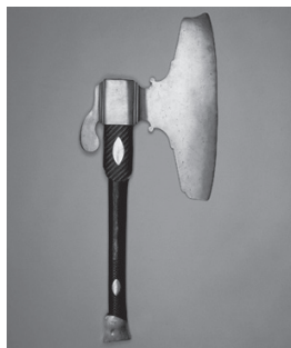
Bøddeløkse anvendt af skarpretter Mühlhausen. Nationalmuseet.

drivende via mandens virksomhed og hans tidlige død. Næringsdrivende enker var efterhånden ikke noget særsyn i Roskilde i slutningen af 1700-tallet.