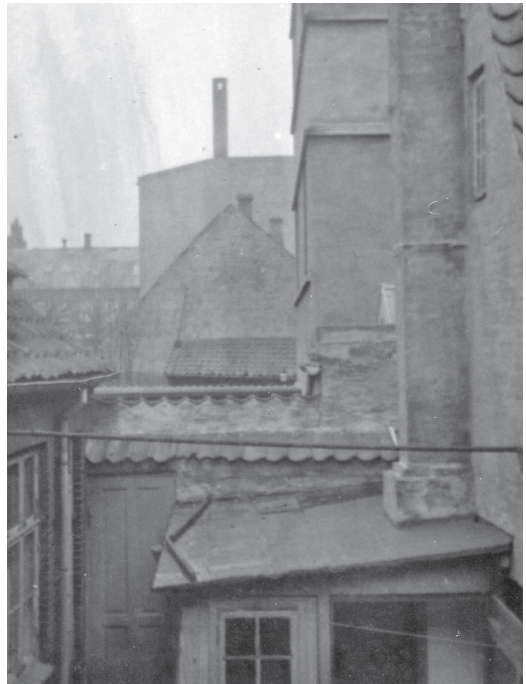
Nyere fotos fra baggården til den tidligere skarprettergård, Skomagergade 26. Det fremgår, hvordan byens baggårde udgjorde et sammensurium af skure og tilbygninger. Amatørfoto, ca. 1920.