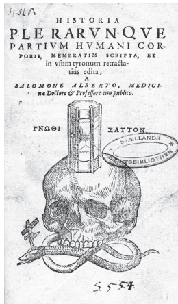
Titelblad i lægebog fra 1585. Lægebøger gik ofte i arv fra generation til generation. Roskilde Stiftsbibliotek.

en gavnlig virkning på diverse sygdomme. Lægebesøg var desuden overordentlig dyre og dermed kun en mulighed for folk med en vis indtægt. Så det var ikke underligt, at mange tyede til naturlæger. Her kommer skarpretterne ind i billedet. Fra gammel tid havde man haft en tro på, at retterstedet med de gamle indtørrede lig var en guldgrube af lægende legemsdele. Kunne man få fat på en tyvefinger, kunne den gøre underværker, for eksempel i det nybryggede øl. Også urter samlet under galgen skulle angiveligt have en særlig helbredende virkning. Partering af lig må desuden have givet bødlen en stor kirurgisk indsigt. Herfra var der ikke langt til, at mestermanden trådte ind i kirurgens og naturlægens rolle.