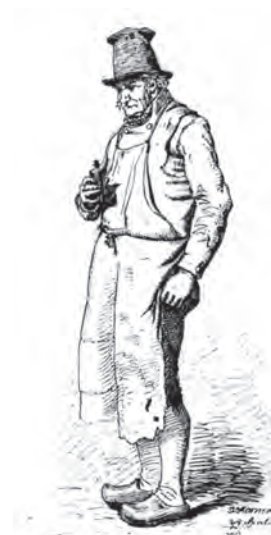
Tegning af gårdskarl. Udført af Jacob Kernerup u.å. Roskilde Museum.

Hvordan gik hendes hverdag som storkøbmand? For det første havde hun ansvaret for alle større indkøb og salg. Det var hende, der opretholdt kontakten til leverandører og kunder. Således rejste hun til København flere gange om året for at afregne med grossister. Turen er uden tvivl foretaget med egen lukket vogn og køreheste, så hun kunne rejse forholdsvis komfortabelt. For det andet skulle hun føre virksomhedens regnskaber, for uden overblik over disse kunne hun ikke lede den store og mangesidige virksomhed. For det