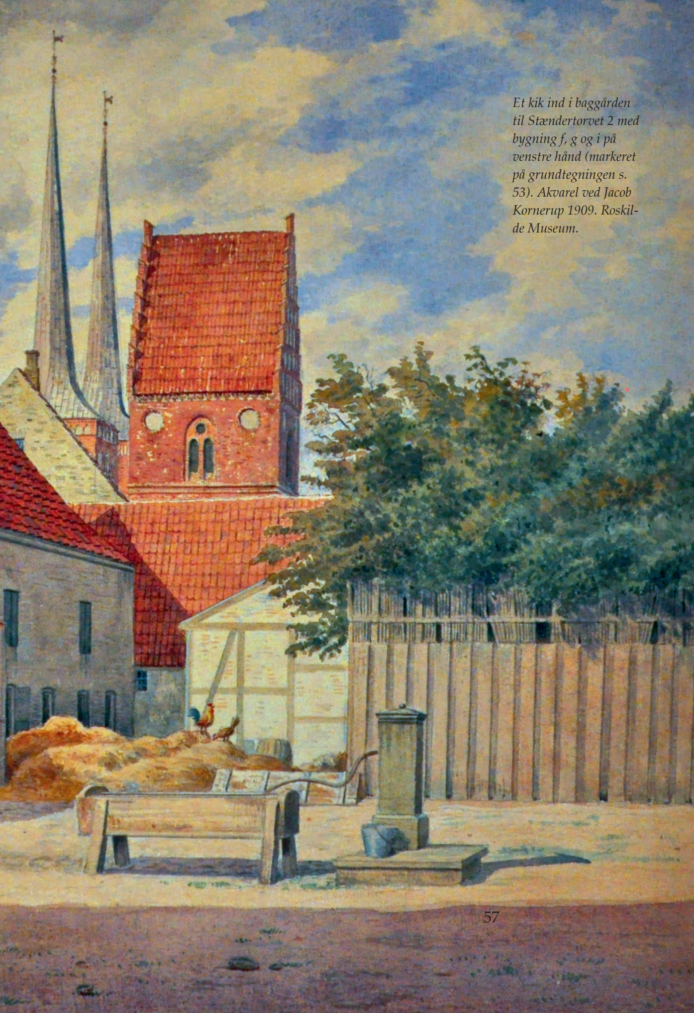
Et kik ind i baggården til Stændertorvet 2 med bygning f, g og i på venstre hånd (markeret på grundtegningen s. 53). Akvarel ved Jacob Kornerup 1909. Roskilde Museum.