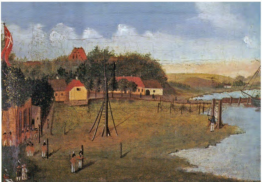
Malermester J. C. Gottschalks billede af fugleskydning på Roskilde Havn. Den lange lave bygning i baggrunden er Store Børs. Tidligst 1787. Foto: Bennie Hansen for Fugleskydningselskabet for Roskilde og Omegn. Roskilde Museum.