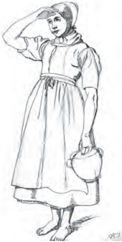
Tegning af tjenestepige udført af Jacob Kornerup 1853. Roskilde lokalhistoriske Arkiv.

typiske købmandsfamilies værelser således: "Dagligstuen, der ogsaa tjente som Spisestue, Storstuen, Sengekammeret og Ammestuen, et skummelt Rum, hvorhen Børnene var forviste" . 3) Der var således ret beskedne rammer for familiens daglige liv, især når man betænker, at storstuen kun var til repræsentativ brug. Der var et stort folkehold på en købmandsgård, og alle ansatte boede normalt i gården. Det betød, at der skulle laves mad til en snes personer foruden familien selv, og den skulle være færdig til tiden. Den varme mad serveredes klokken 12 middag.