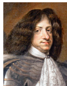
Christian 5. (1646-1699). Udsnit af portræt ophængt i jomfruklosterets riddersal. Kunstner: Abraham Wuchters. Roskilde Kloster.