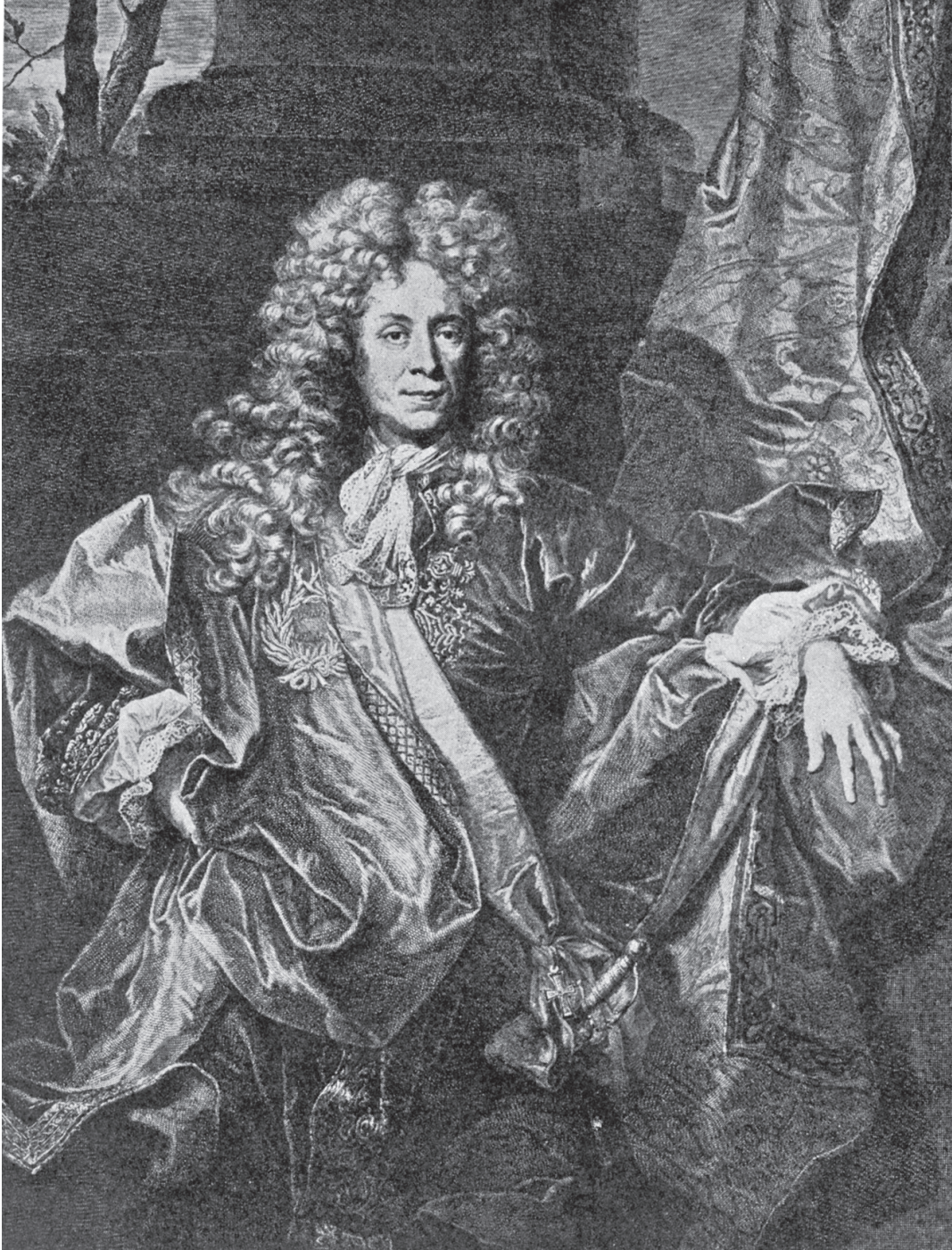
Christianes ægte mand, gesandt Henning de Meyercrone. Stik af C. Vermeulen efter maleri af Hyacinthe Rigaud. Findes bl. a. i Kobberstiksamlingen.