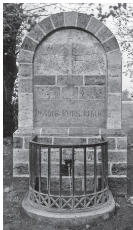
Monument for Hellig Kors Kilde. Ca. 1910.