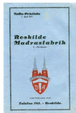
Rosma prisliste fra 1931.

Metalsengene blev gennem årene udviklet og forfinet. I begyndelse af 1950'erne blev der udviklet en såkaldt hollywoodseng. Dobbelt-sengen fik navnet Paris og beskrives i salgsmateriale: