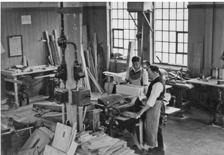
Maskinsnedkeriet på Roskilde Madrasfabrik 1937.