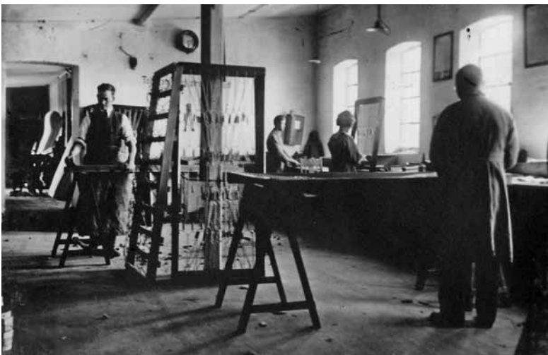
Madrasværkstedet på Roskilde Madrasfabrik på Helligkorsvej ca. 1925.