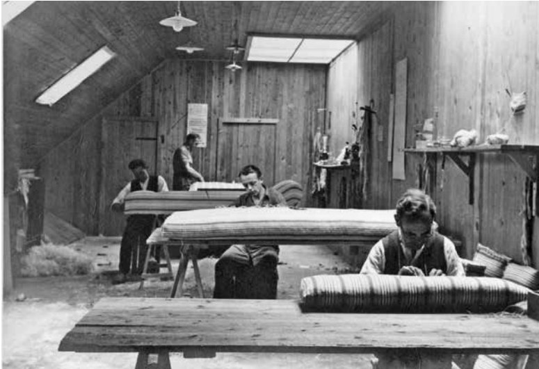
Sadelmagerværkstedet på Roskilde Madrasfabrik 1937.