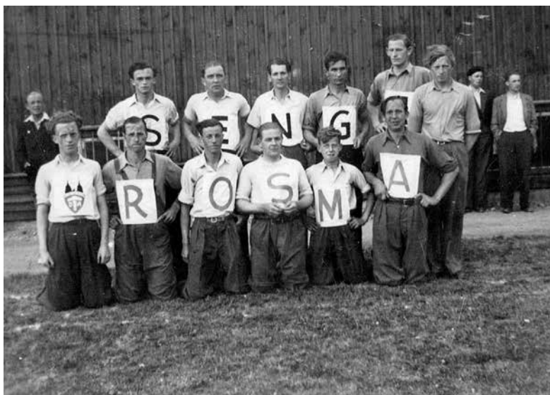
Rosma deltager i Fagenes Fest i Roskilde Idrætspark i begyndelse af 1950'erne.