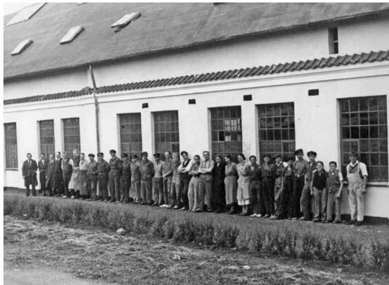
Personalet på Roskilde Madrasfabrik 1934-37.