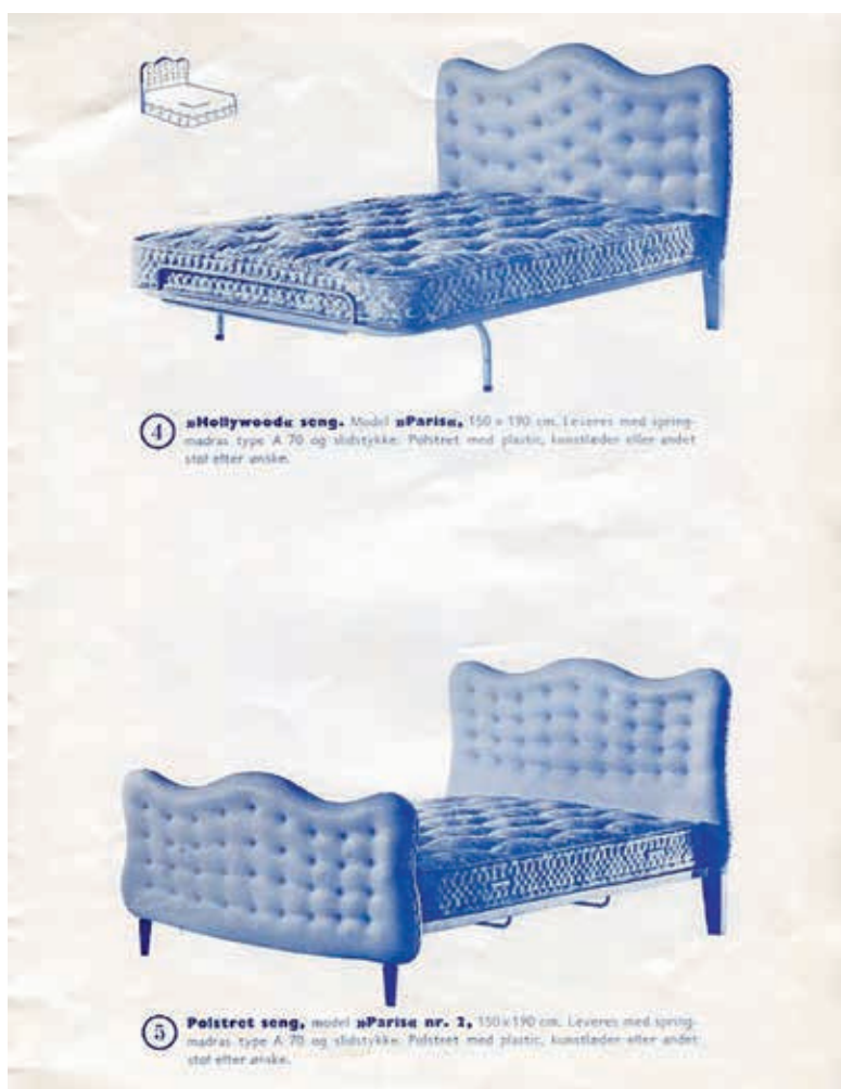
Fra Rosmas salgskatalog.