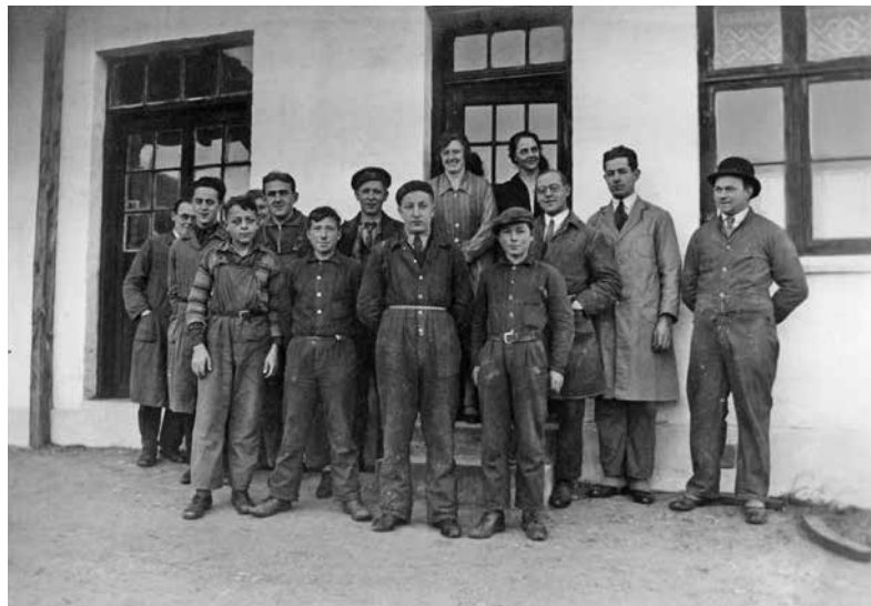
Personalet på Roskilde Madrasfabrik i Borge-diget ca. 1930.