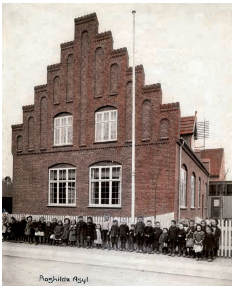
Asylbørnene opstillet foran det nye børneasyl, Bredgade 4.