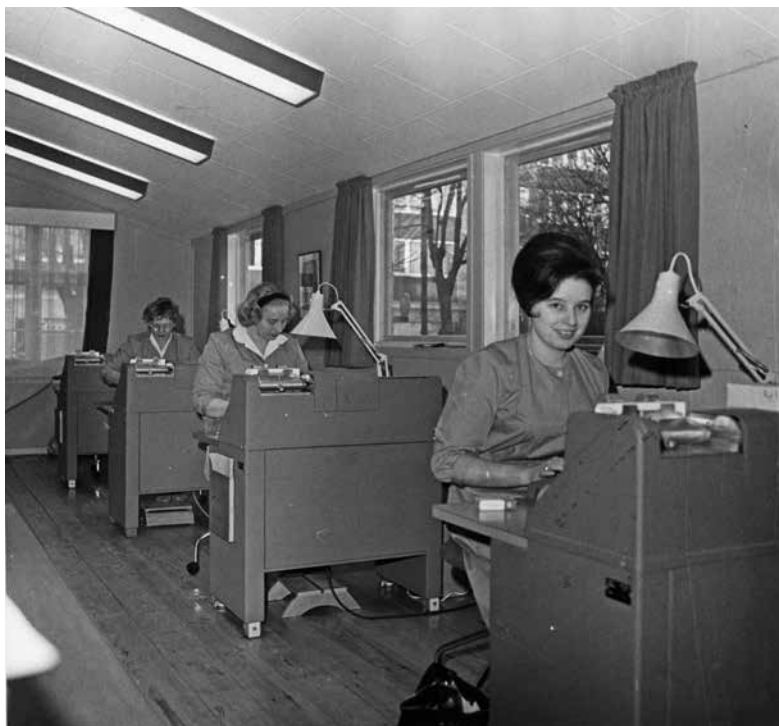
Kvinder ansat på Kommunernes Hukortcentral, pavillon ved Bredgade 4. Billedet illustrerer kontormaskinernes størrelse i denne periode.