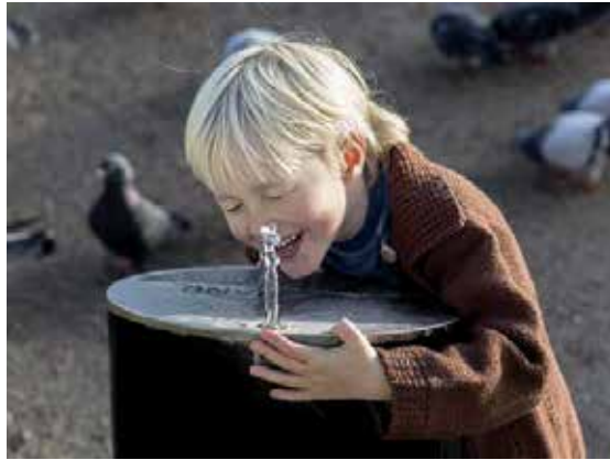
Ved hver kilde skal der etableres en vandpost.