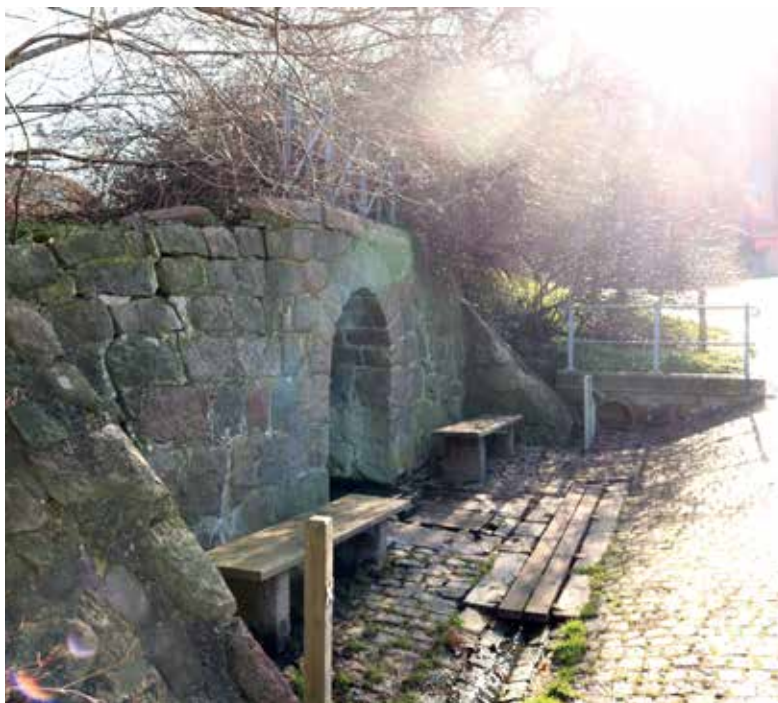
Sankt Hans Kilde.

Et fjerde indsatsområde er adgang til rent drikkevand. Her skal kunstnere inviteres til at skabe unikke vandposter, der skal stå som symbol for vands store betydning gennem alle tider: I fortiden, nutiden og fremtiden – og som vores væsentligste bæredygtige resurse. Vandposterne skal samtidig sikre let adgang til rent drikkevand for alle, som opholder sig ved kilderne såvel som forbipasserende.