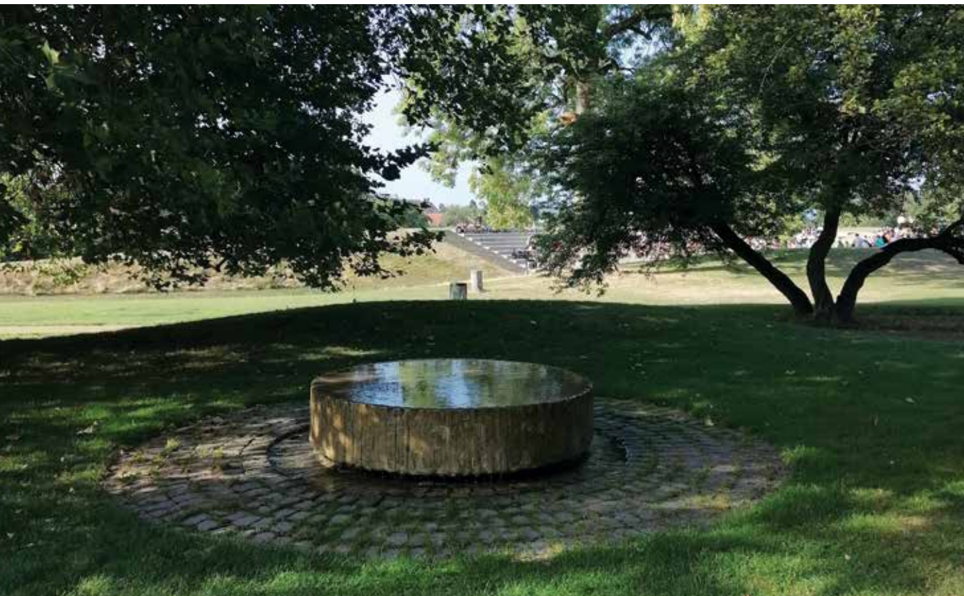
Lovise kilden i Folkeparken.

der som lokale historikere fra dag ét også er gået til opgaven med bred viden og engagement. Bogen er den første bog, der indeholder en alsidig beskrivelse af alle aspekter af kilderne i Roskilde, og bogen skal være med til at danne baggrund for en ny og omfattende formidlingsindsats omkring kilderne.