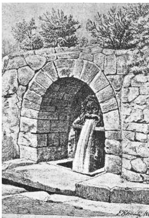
Maglekilde, tegning Jakob Kornerup 1866. Roskilde Lokalhistoriske Arkiv.