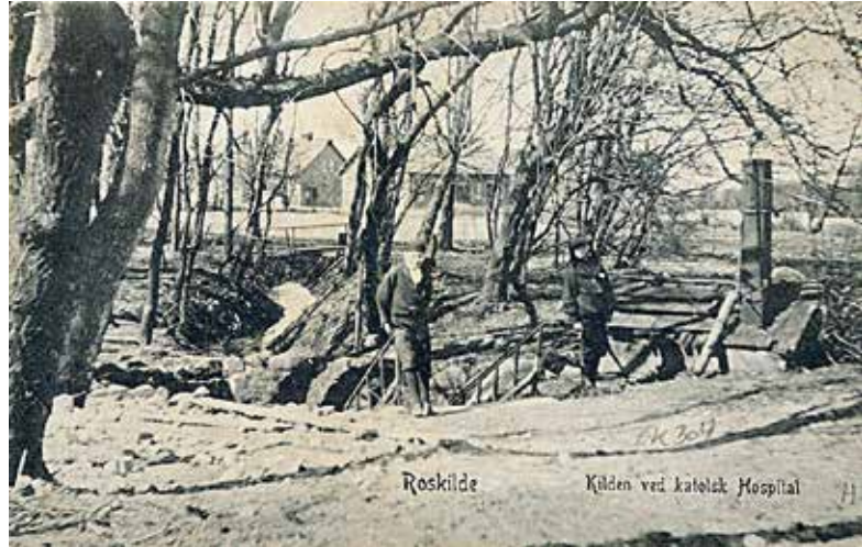
Klosterkilden med Skt. Josefs Skole i baggrunden.

Efter indgående studier, tegninger og forarbejder fik unge med mange forskellige baggrunde og specialer under kyndig kommunal styring sat skik på kildegrotten, vandtilløbet, kildehuset, rækværket samt vandløbet videre til den midterste sø i Klosterparken. Den nye Klosterkilde blev færdig i 1985 og ligger nu til alles glæde frit tilgængeligt – et af de mest romantiske miljøer i Roskilde. 18