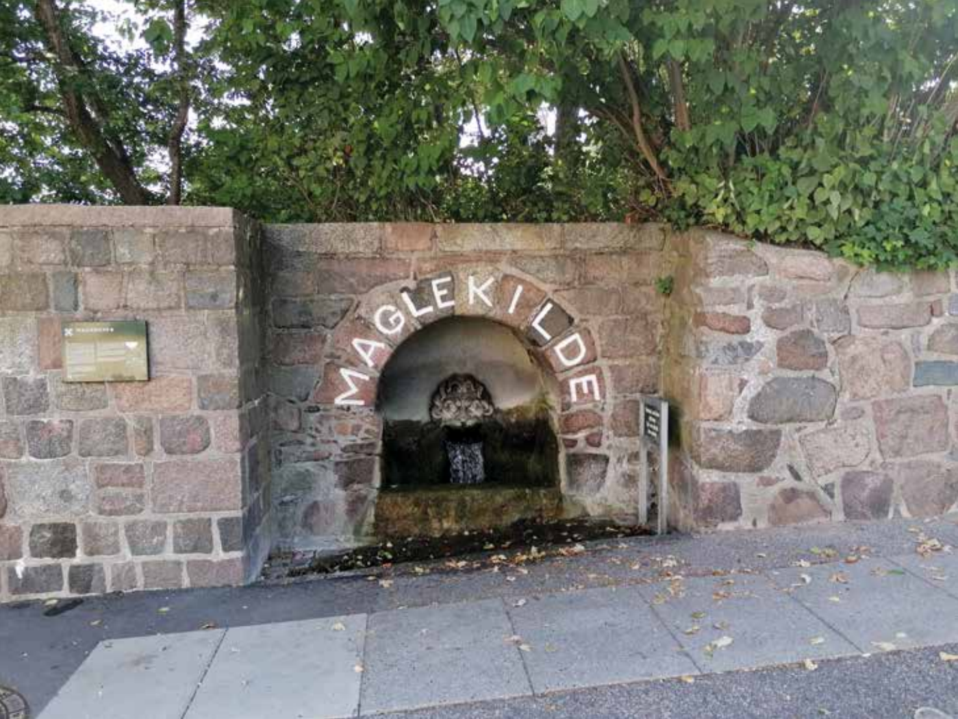
Maglekilde med kildegrotten med havguden Neptuns hoved. Foto: Henrik Denman 2022.