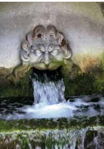
Vandet fosser ud af Neptuns mund i Maglekilde. Foto: Henrik Denman 2022.

mængder vand op i tankvogne til vanding af byens blomster. Det er dog ikke noget, som forringer vandmængden: der løber dagligt 1100\text{m}^3 ud af Neptuns mund, kommunes tager blot 20\text{m}^3 .