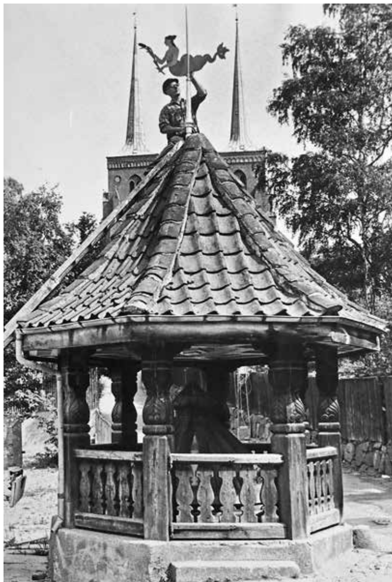
Søjomfruen flyttes over på det nye kildehus. Foto 1968. Roskilde Lokalhi- storiske Arkiv.

mængder vand op i tankvogne til vanding af byens blomster. Det er dog ikke noget, som forringer vandmængden: der løber dagligt 1100\text{m}^3 ud af Neptuns mund, kommunes tager blot 20\text{m}^3 .