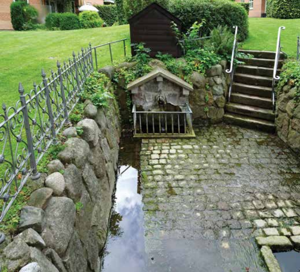
Klosterkilden efter nyeste restaurering.