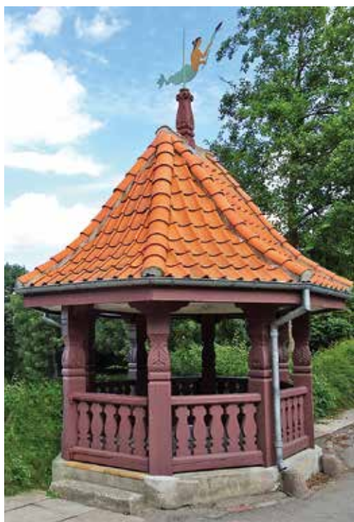
Kildehuset over Maglekildes brønd med Søjomfruen.

I det 19. århundrede opstod der konkurrence om brugen af vandet, idet de ekspanderende industrier gradvist formindskede roskildens muligheder for at bruge vandet efter de gamle traditioner. Ejerne af området blev ved en aftale mellem kommunen og ejerkredsen i 1845 forpligtet til at lade vandet fra kildebrønden lede i en rende ned til en halvgrotte, som gav almenheden god adgang til at benytte vandet. Kildegrotten med havguden Neptuns hoved blev opført i 1845 og er tegnet af arkitekt H.C. Stilling, der også havde tegnet Tivoli.