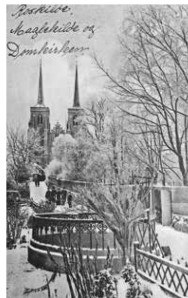
Maglekildes brønd ved Lille Maglekildestræde op mod Domkirken. Tegning ca. 1900. Roskilde Lokalhistoriske Arkiv.

Roskilde Kommune er begyndt at bruge kildens vand igen, idet der dagligt i sommerperioden suges betragtelige