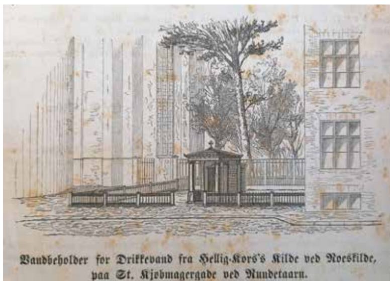
Salgsboden for vand fra Hellig Kors Kilde ved Rundetårn i København ca. 1850.

Den kendte spanske rejsende Francisco de Miranda skulle i 1788 selvfølgelig også bese den kilde, som kongen drak vand af, og han sammenlignede den med den tilsvarende kilde, som den spanske konge drak af! 14