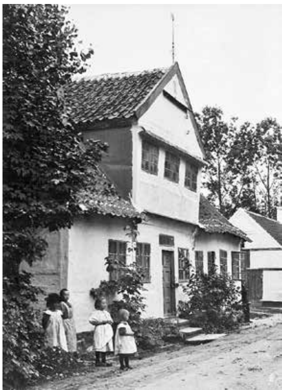
Kildehuset over for Hellig Kors Kilde.

Foto: Kristian Hude 1899. Roskilde Lokal- historiske Arkiv.