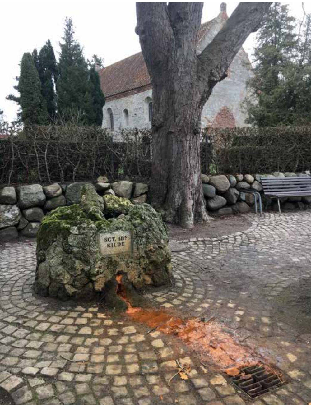
Sankt Ibs Kilde med mos og okkerødt vand. I baggrunden Sankt Ibs Kirke bygget af kildekalk.

Også denne kilde har været igennem faser med ødelæggelse og renovering, med udtørring og fornyet vandføring. Ifølge Behrmann stod der et skur over kilden i 1832. Det var væk, da man i år 1900 restaurerede kilden og dens nærmeste område, bl.a. med en halvbueformet grotte af frådsten og med et smukt lille anlæg omkring.