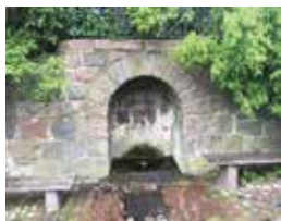
Sankt Hans Kilde.