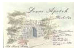
Receptkuvert med Sankt Hans Kilde. Tegningen er sikkert en henvisning til kilden som helbredende. Roskilde Lokalhistoriske Arkiv.

Denne kilde kaldes i nogle ældre beretninger og bykort for Provstekilden, men det almindelige navn er Sankt Hans