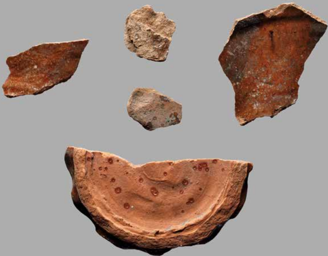
Potteskår fra tiden omkring 1300 fundet i bunden af Sankt Hans Kilde 1834.

Kilde med navn efter den nærliggende Sankt Hans Kirke, som var centrum i den bydel, som lå nord for domkirken. Bydelen ligger nu som ruiner under Provstevænget, hvor kirkens fundament er blevet frilagt.