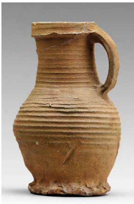
Kande fra omkring 1300 fundet i bunden af Sankt Hans Kilde i 1834.