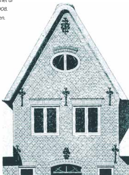
Fig. 2. Friserkvist gengivet i "Vorlegeblad" udgivet af Baupflege Tondern 1908-09.