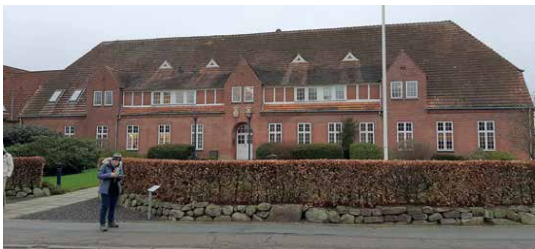
Fig. 1. Den tidligere tyske højskole i Tinglev, tegnet af berlinarkitekterne Dinklage, Paulus og Lilloe, 1908. Bygningen er i dag skole for Beredskabsstyrelsen.