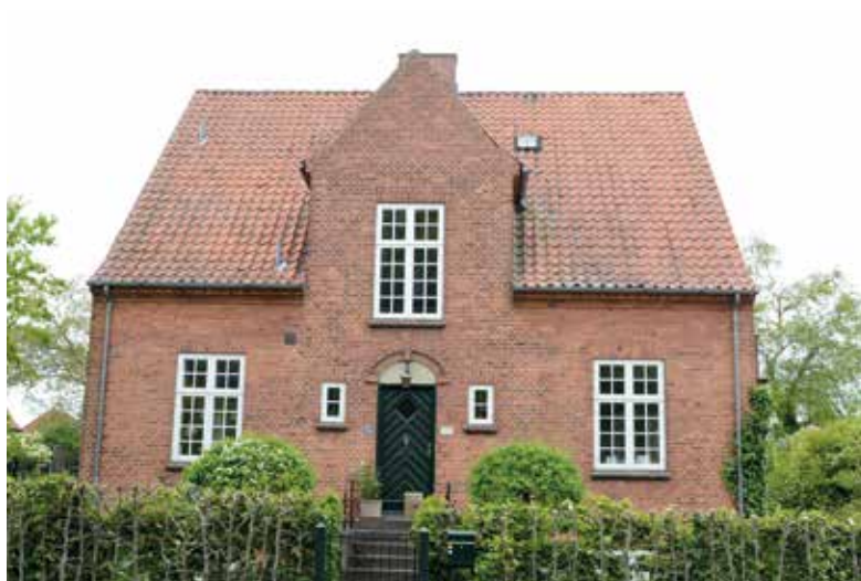
Fig. 5. Friserkvist på Dronning Margrethes Vej 44.