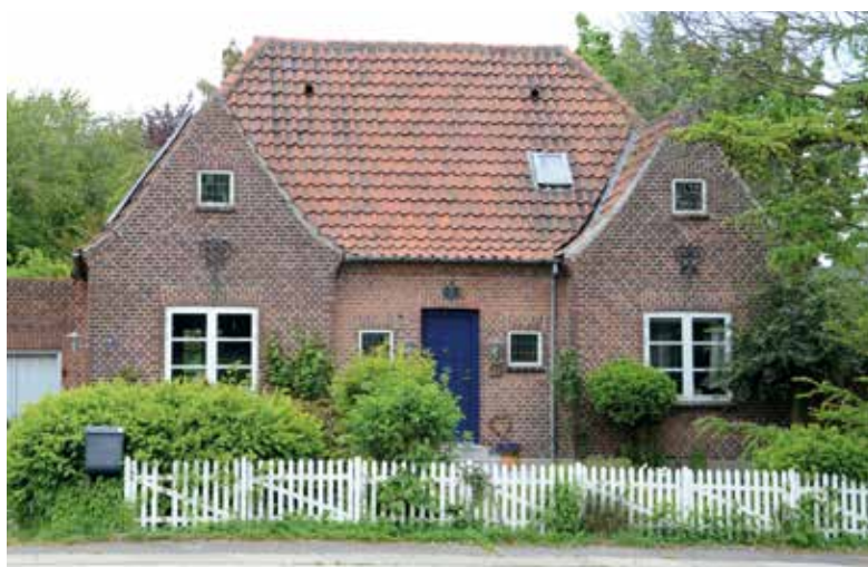
Fig. 6. Konge Valdemars Vej 7 med to friserkviste. Bemærk opsalkningen.