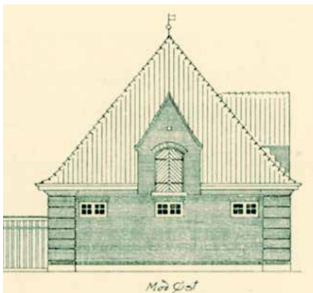
Fig.4. Friserkvist med ladeport på staldbygning på kasernen i Roskilde tegnet af Sven Sinding og gengivet i Sven Sinding 1914b.