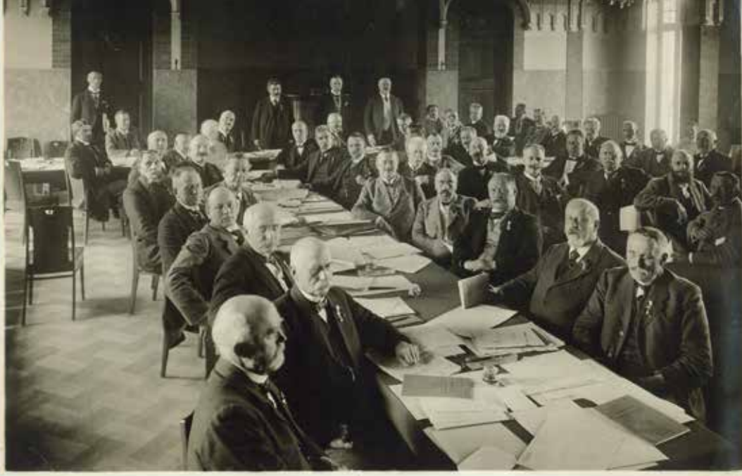
Fig. 1. Der findes stort ingen tilgængelige fotografier fra det nordiske interparlamentariske møde i København i 1921. Det samme gælder de nordiske deltageres besøg i Roskilde og Hertugdalen den 6. juli 1921. Et af de få fotografier viser den nordiske interparlamentariske kommission i København, hvor flere førende nordiske politikere deltog. Det Kongelige Bibliotek.

Krigen i 1864 blev en realitet, og Danmark mistede Slesvig, Holsten og Lauenborg og blev dermed kraftigt reduceret. Sådan lå landet, da Første Verdenskrig brød ud. Optakten til krigen og krigens forløb pusede imidlertid igen nyt liv i tanken om et skandinavisk samarbejde – eller et nordisk samarbejde med Finland med i visionen, som man i årene inden verdenskrigen talte om.