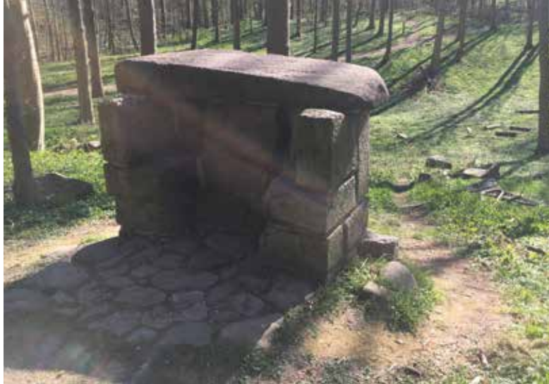
Fig. 6. Herthadalen med den berømte talerstol i dag.