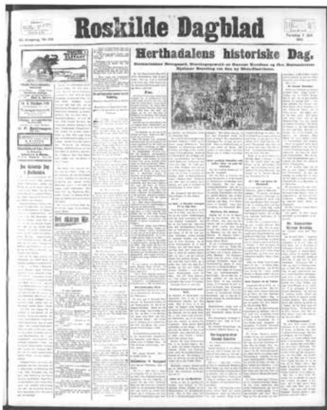
Fig. 7. Roskilde Dagblad bragte en stor reportage fra folkemødet i Herthadalen den 7. juli 1921.

Gunnar Knudsen nævnte som muligheder for det fremtidige samarbejde, at man fortsatte de interparlamentariske møder. Han mente, at de politiske møder havde vist deres værdi, ikke mindst under verdenskrigen. De nordiske lande skulle desuden bakke op om nye internationale organer som Folkenes Forbund, for det "er nu Folkene, der regerer, ikke Fyrsterne", som han udtrykte det. Målet skulle være at afskaffe krig. Her havde de nordiske lande en vigtig opgave med at fremme verdensfreden.