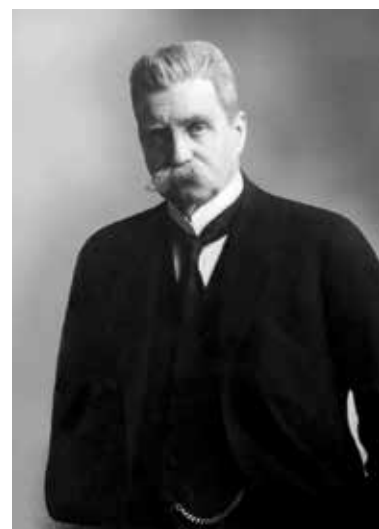
Fig. 2. Hjalmar Branting (1860-1925), svensk socialdemokratisk politiker og Sveriges statsminister i tre regeringer i 1920, 1921-23 og 1924-25.

Den folkelige opbakning til festlighederne og de politiske taler af førende nordiske politikere skal også ses i sammenhæng med den eufori, der var opstået i Danmark efter afslutningen på Første Verdenskrig. Danmark havde gennem krigen forholdt sig neutralt, og de sejrende magter havde besluttet, at Danmark skulle have Nordslesvig tilbage, og at grænsedragningen skulle afgøres ved en folkeafstemning. Afstemningen blev holdt i 1920, og Danmarks nye grænse kom til at ligge, hvor den ligger i dag. Sønderjylland blev atter dansk, men krigen og Danmarks nye grænse viste sig at være et aktuelt udgangspunkt for politikernes taler om fremtidens nordiske samarbejde i Herthadalen.