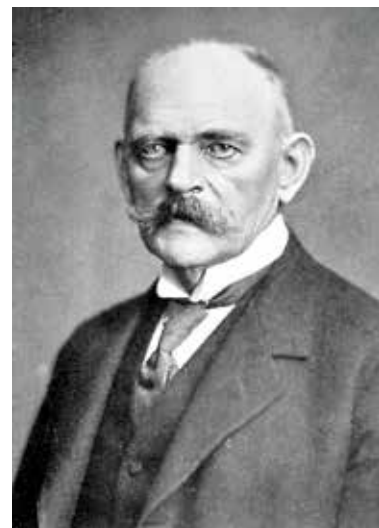
Fig. 4. Niels Neergaard (1854-1936), dansk politiker for Venstre og Danmarks statsminister 1908-09 og 1920-24.

Så fulgte det ene elegante luksusautomobil efter det andet. Det havde været en dejlig køretur langs den solbeskinnede Roskilde-fjord, men støvet havde der været på vejen, og det må alligevel have været helt velgørende atter at komme ind på stenbroen. Automobilerne fik hurtigt sat deres interparlamentariske indhold af på torvet, skrev journalisten fra Roskilde Avis. 4