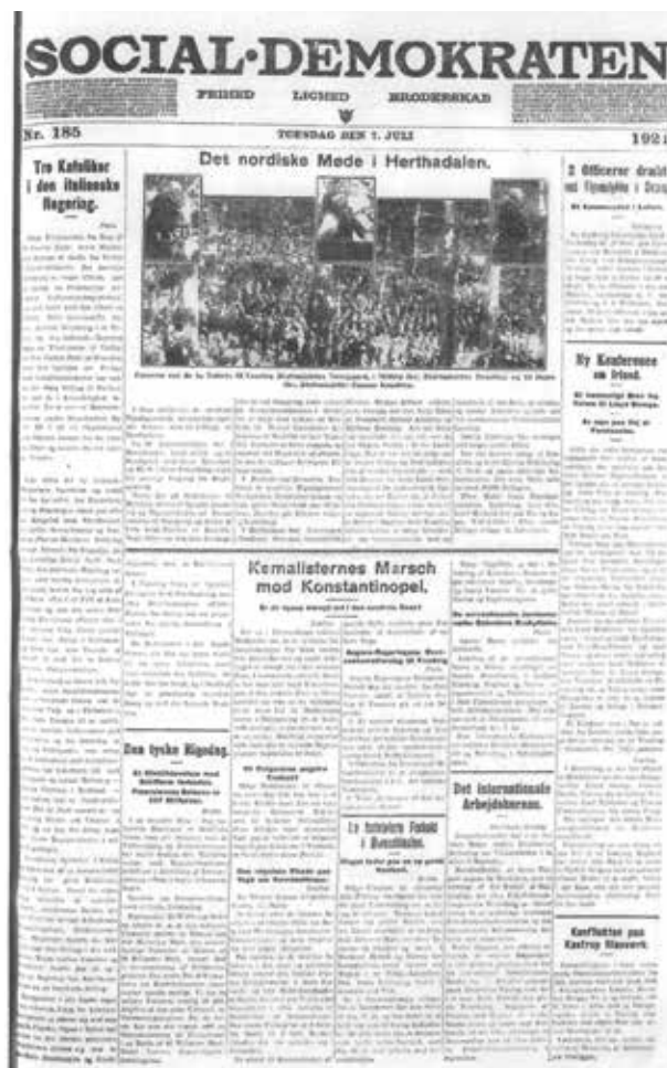
Fig. 8. Forsiden af Social-Demokraten den 7. juli 1921 med et stort fotografi, der viser den store folke-mængde i Herthadalen.

Den tredje politiske tale blev holdt af den tidligere svenske statsminister Hjalmar Branting. Han lagde vægt på nationalitetskampen og folkernes frihed og selvstændighed. Om de nordiske landes placering i en ny verdensorden sagde han: