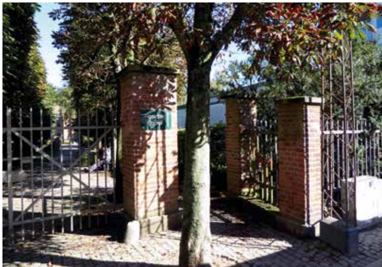
Figur 123. Algade-indgangen med jerngitter og gitterpiller med pyramidetop, 2016.

år senere, den 1. august 1959 gik man i gang med byggeriet, der blev i én etage over jorden med en grønnegård i midten. Arkitekt og bygherre fortjener ros for, at man lagde én etage under jorden og byggede biblioteket i røde mursten, hvilket tilsammen gør, at biblioteket på smuk vis passer ind med det fredede kloster. På nogenlunde samme tid, i 1960'erne, var nybyggeriet i Roskilde ellers præget af ucharmerende beton. Ved anlæggelsen af biblioteket i efteråret 1959 afdækkede man resterne af en 45x12 m stor middelalderbygning, som antoges at være en økonomibygning eller lade i sortebrødrenes klosterkompleks. 194 Da biblioteket i 1978 skulle udvides, stødte man igen på middelalderligt murværk. Roskilde Museum blev tilkaldt og kunne efterfølgende konstatere, at man havde lokaliseret de teglovne, som dominikanerbrødrene benyttede under opførelse af deres kloster i begyndelsen af 1200-tallet. Efterhånden som ovnene brændte sammen, byggede man nye ovenpå. 195 Man fandt i øvrigt så mange originale munkesten ved udgravningen, at da klosteret i 2011 skulle renovere klokkegavlen over indgangen i Midterfløjen,