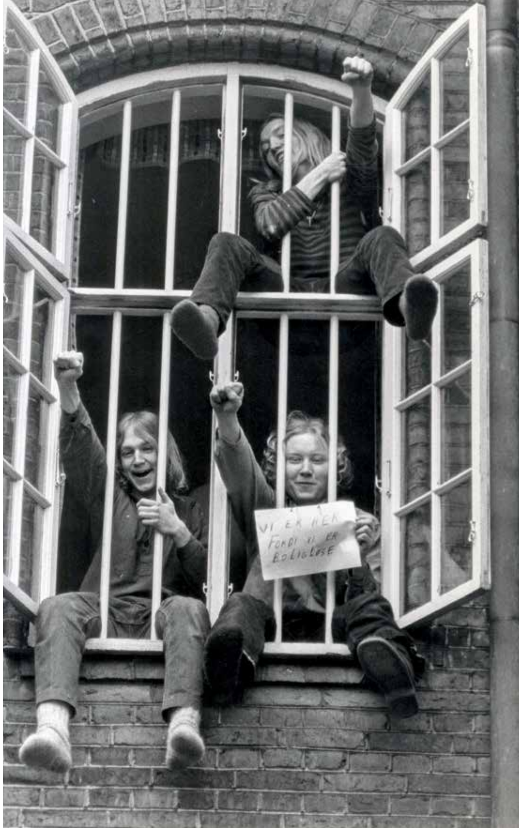
Figur 127. "Vi er her, fordi vi er boligløse". Besætterne bag tremmer i Roskilde Arrest, mens deres sag behandles. Dommen lød på 200 kr. i bøde til hver for overtrædelse af politivedtægten.