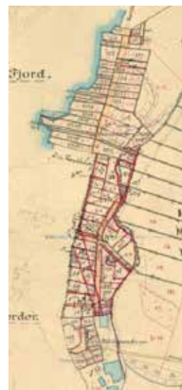
Figur 119. 1913-33. Med landudvindingsprojektet på østsiden af fjorden stiger roskildeborgernes interesse for dette attraktive område, og dermed også for klosterets arealer syd for Haraldsborg.

Roskilde Kommunes behov for udvidelsesmuligheder tæt op ad den eksisterende boligmasse førte i 1920'erne til købet af størstedelen af den tidligere klostermarksjord og alle Sankt Agnes-husmændenes tidligere jordlodder med fuld brugsret fra 1927. Derefter kunne man begynde udstyknings af byggegrunde langs Frederiksborgvej, Sankt Agnes Vej og den nu forsvundne Juttas Vej, og i 1929 havde kommunen sin byudviklingsplan klar for den tidligere hovedgårdsjord. Den blev præsenteret under navnet Roskilde Bys Nye Villakvarterer . Området ind mod Klostermarken skulle omdannes til en park, som fik navnet Folkeparken. Randarealet ud mod den nye Kong Valdemars Vej skulle