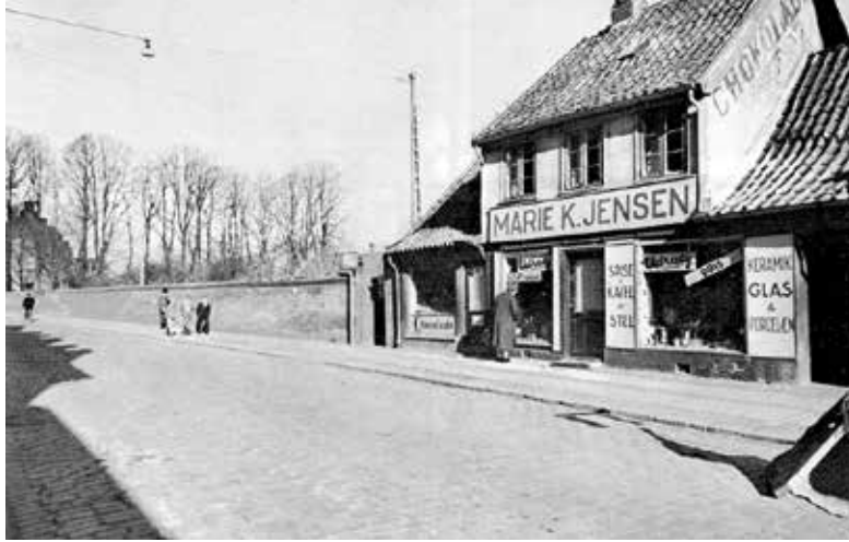
Figur 122. Klostermuren fra 1866. Den måtte i 1950 lade livet i forbindelse med regulering af Algade og Andelsbankens nybyggeri i 1958.

år senere, den 1. august 1959 gik man i gang med byggeriet, der blev i én etage over jorden med en grønnegård i midten. Arkitekt og bygherre fortjener ros for, at man lagde én etage under jorden og byggede biblioteket i røde mursten, hvilket tilsammen gør, at biblioteket på smuk vis passer ind med det fredede kloster. På nogenlunde samme tid, i 1960'erne, var nybyggeriet i Roskilde ellers præget af ucharmerende beton. Ved anlæggelsen af biblioteket i efteråret 1959 afdækkede man resterne af en 45x12 m stor middelalderbygning, som antoges at være en økonomibygning eller lade i sortebrødrenes klosterkompleks. 194 Da biblioteket i 1978 skulle udvides, stødte man igen på middelalderligt murværk. Roskilde Museum blev tilkaldt og kunne efterfølgende konstatere, at man havde lokaliseret de teglovne, som dominikanerbrødrene benyttede under opførelse af deres kloster i begyndelsen af 1200-tallet. Efterhånden som ovnene brændte sammen, byggede man nye ovenpå. 195 Man fandt i øvrigt så mange originale munkesten ved udgravningen, at da klosteret i 2011 skulle renovere klokkegavlen over indgangen i Midterfløjen,