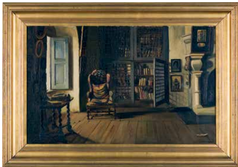
Figur 133. Den barokke øreklapstol i Brahestuen stod tidligere i Karen Brahes bibliotek på Odense adelige Jomfrukloster. H x B: 42 x 66 cm.

Også en særdeles berømt mandlig slægtning har fundet vej til Brahestuen. Tycho Brahe (1546-1601), astronom og bror til Karen Brahes oldefar. Hans portræt er interessant, ikke mindst fordi det blev malet af portrætmaleren C.A. Jensen i perioden december 1837 – marts 1838 efter en original på Odense adelige Jomfrukloster, som kongen havde bedt