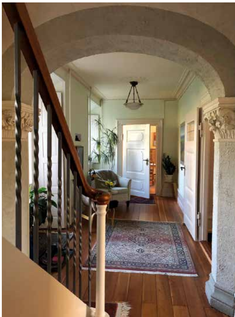
Figur 138. Havestuen i Priorindefløjens stueplan set mod øst. Herfra er der adgang til klosterhaven (tv.), klostergården (th) og trappen til 1. sal. Denne er måske en del af sikkerhedsplanen samtidig med udgangen til klostergården. Fra rummet i baggrunden var der tidligere adgang til hjørnestuen.

set har foreningen således både medvirket til at højne kendskabet til klosteret og til at give klosteret et kærkomment økonomisk tilskud.