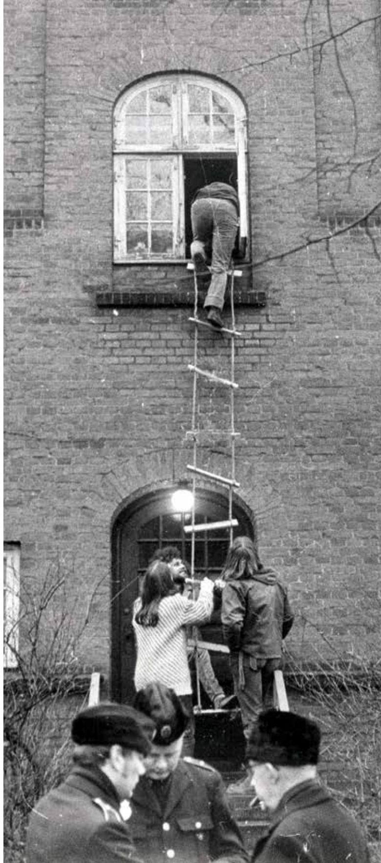
Figur 126. Algade 31, februar 1971. Fredelig afslutning på en aktion, der var medvirkende til en ændring af saneringsloven, som lovliggjorde lignende aktioner.