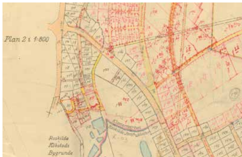
Figur 124. Matrikelkort 1950-77. Klosterjorden langs Kong Valdemars Vej er nu udstykket, og mod nord bliver husmændenes jordlodder til et nyt boligkvarter med nordiske gude- og navne som Valhal Vej og Høders Vej. Kort: Geodatastyrelsen.

var man i stand til at udføre arbejdet med sten af samme alder som det omgivende bygningsværk.