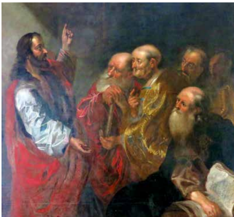
Figur 136. Skattens Mønt antages at være en kopi af et værk fra den flamske skole af Peter Paul Rubens (1577-1640) eller hans yngre kollega, Jacob Jordans (1593-1678). Billedet er ikke signeret, og der har derfor været flere bud på kunstneren – dog ikke Rubens. Det skønnes at være malet i samme periode som originalen, dvs. 1600-tallet, og hører derfor til blandt klosterets ældste kunstværker. Efter forskellige placeringer hænger det nu i Sølvstuen. H x B: 180 x 194 cm.