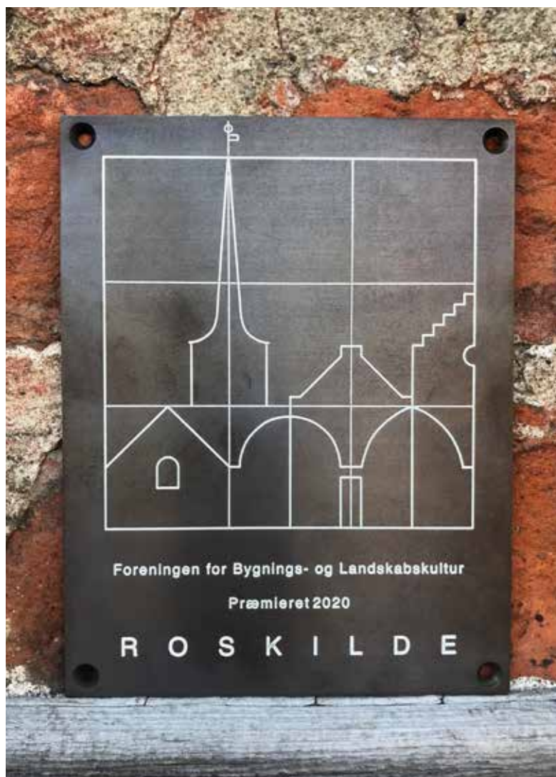
Figur 139. I 2020 modtog klosteret denne plakette fra Foreningen for Bygning- og Landskabskultur som anerkendelse for stiftelsens bevaringsmæssige indsats. H x B: 17 x 13 cm.

tægtssiden hævet, bl.a. gennem et øget antal rundvisninger og udlejning af salen, men især har man søgt og fået støtte fra mange almenvelgørende fonde. Dette har alt sammen bevirket, at klosteret i de senere år har kunnet gennemføre et stort antal restaurerings- og renoveringsprojekter. Blot i de seneste 10 år, er der brugt ca. 9 mio. kr. på sådanne arbejder; hertil kommer almindelig vedligeholdelse. Til gengæld bliver klosterets bygninger, haven og muren efterhånden bragt i mere forsvarlig stand. Klosteret lægger i den forbindelse megen vægt på at føre tidligere – og ikke altid lige veludførte – renoveringsarbejder tilbage til en mere historisk korrekt situation. For denne indsats modtog klosteret i 2020 Foreningen for Bygnings- og Landskabskulturs plakette.