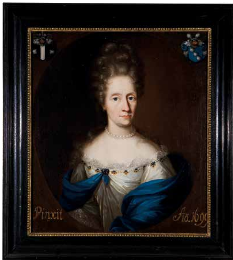
Figur 131. Karen Brahe (1657-1736). H x B: 81 x 70 cm.

Også i Odense havde økonomiske problemer tvunget klosteret til stykvis at bortsælge stiftelsens jordtilliggender. Som