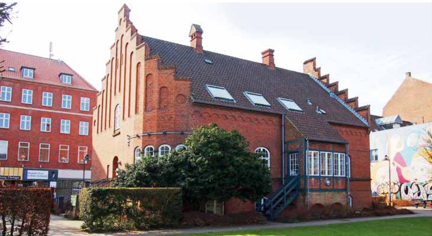
Figur 128. Algade 31 fra havesiden med det runde hjørne og de famøse ovenlysvinduer.