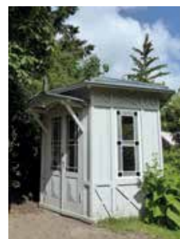
Figur 130. Damernes tidligere tehus på sin nye placering i "Tehushaven" i Sankt Ols Stræde.