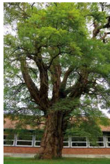
Figur 129. Den gamle akacie, som stadig kan nydes af klosterets beboere og de mange besøgende både her og på biblioteket.

Rekrutteringsgrundlaget smuldrede fortsat, og dermed også indskrivningsbeløbene, formuen og renterne. Den problem-