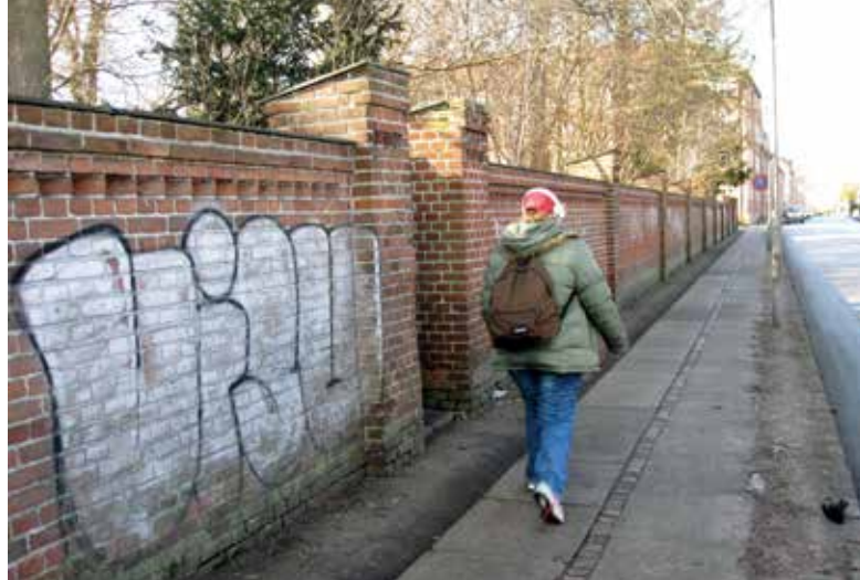
Figur 117. Klostermuren på Dronning Margrethes Vej inden renovering og indsats mod graffiti.

en del af Kulturstrøget fra Domkirken over Stændertorvet, forbi Roskilde Museum og Roskilde Kloster til bibliotekets nye hovedindgang og Sortebrødre Plads. I den forbindelse blev klostermuren forlænget fra Sankt Peders Stræde-porten sydpå indtil Klosterstien og derefter i fire murpillers længde mod øst langs Klosterstien. Denne del af klostermuren opførtes i 1976. Resten af skellet ud mod Klosterparken og Algade markeres af en bøgehæk.