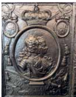
Figur 16. Støbejernsovn med portræt af Frederik 4. og Anna Sophie Reventlow, hans hustru til både venstre og højre hånd. Vielsen fandt sted i 1721, kun 2 dage efter hans første hustru, dronning Louises begravelse i Roskilde Domkirke, hvor også begge de portrætterede er begravet.

Kong Christian 5. døde den 15. august 1699 få måneder efter at have udstedt disse bevillinger, men hans efterfølger Frederik 4. (konge 1699-1730) ikke bare konfirmerede disse privilegier, men fortsatte med flere af slagsen: