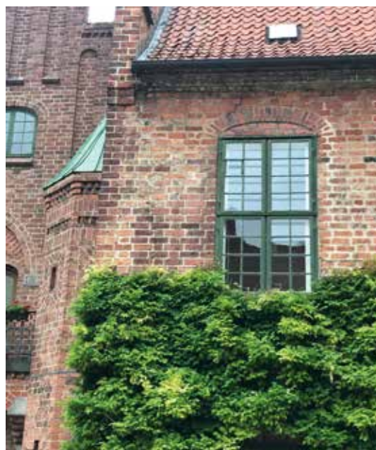
Figur 25. Dette vindue i Priorindefløjens sydfacade ses tilmuret på Nyrops tegninger fra 1889. Til venstre for vinduet er murværket udbedret med nyere, mørkere sten halvt skjult under beplantningen, hvor der tidligere har været en tilmuret indgangsdør. Det er muligvis sket samtidig med retablering af vinduet eller ved sammenbygning med den nye beboelsesfløj.