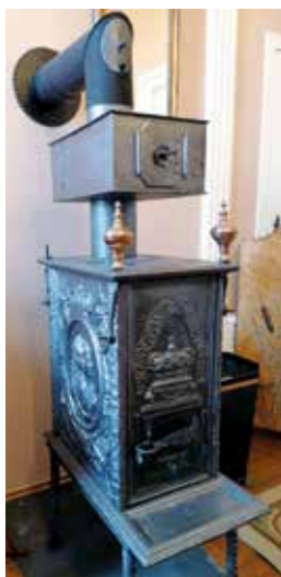
Figur 15. 1724. I Den Røde Stue står denne støbejernsovn fra Frederik 4.'s tid. Kongen, der gav de fleste privilegier til klosteret.