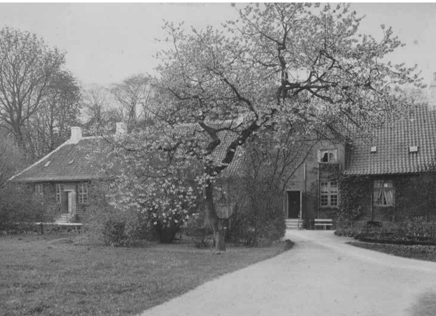
Figur 26. Ca. 1900. Juelernes Hus.

De tre kamre kunne imidlertid ikke dække boligbehovet, så i forlængelse af Priorindefløjen lod Margrethe Ulfeldt opføre et bindingsværkshus til bolig for de fire konventualinder, der blev optaget på de såkaldte Juelske patronpladser. Berte Skeel opførte i årene 1714-20 for sine egne midler en tilsvarende bolig for de to konventualinder, som besatte de