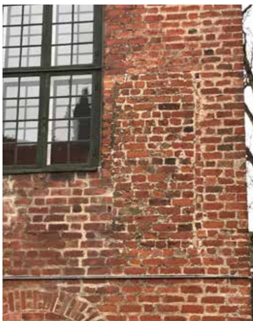
Figur 24. Kirkefløjens nordfacade med tydelige spor af en tilmuring, som indikerer, at der her kan have været en indgang fra et senmiddelalderligt trappetårn.

gamle, afhakkede sten er blevet erstattet med nyere og mørkere sten. Her har der med stor sandsynlighed også været et udvendigt sen-middelalderligt trappetårn med en indgangsdør. Denne tilmurede dør ind til 1. sal ses markeret på Nyrop/Ingwersen facadetegning, figur 75. 59