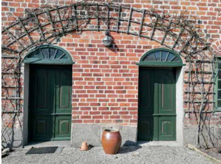
Figur 23. To døre placeret symmetrisk i Midterfløjens østfacade. Den nordlige (th.) er en attrap. Murværket mellem dørene har ikke samme alder som resten af facaden. Forklaring kan være, at dørene er kommet til samtidig med baroktrappen indenfor.

gamle, afhakkede sten er blevet erstattet med nyere og mørkere sten. Her har der med stor sandsynlighed også været et udvendigt sen-middelalderligt trappetårn med en indgangsdør. Denne tilmurede dør ind til 1. sal ses markeret på Nyrop/Ingwersen facadetegning, figur 75. 59