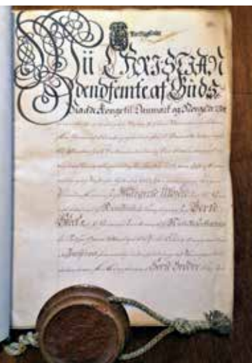
Figur 13. Præambelen til originalstatutterne fra 1699 i Roskilde Klosters arkiv.