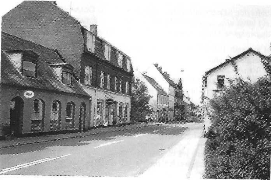
Ringstedgade 24 i dag (hus nummer to fra venstre).

..»Her mødtes vi og diskuterede situationen, udvekslede erfaringer fra vores arbejdspladser og hyggede os med kortspil...Muligheden for arbejde inden for modstandsbevægelsen blev også diskuteret, men aktiviteterne indskrænkede sig til et forsøg på våbenkøb fra tyske soldater..«.