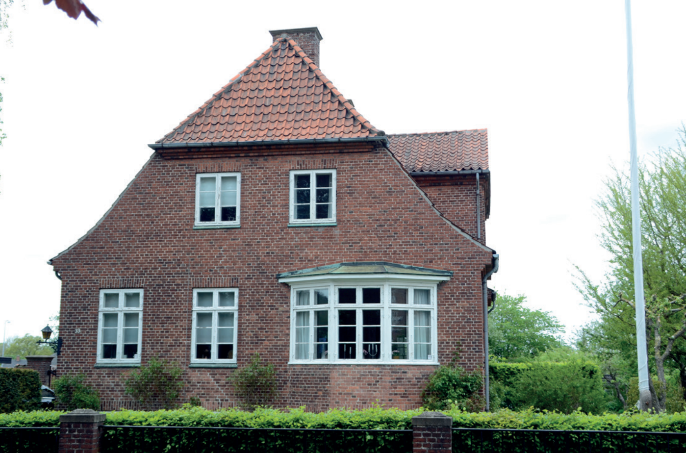
Fig. 8. Karnappen på Dronning Margrethes Vej 33 har rødder i vestslesvigsk byggetradition, måske Møgeltønder eller Tønder. På højre side af taget aner man lige friserkvisten.

hvor tyske arkitekter søgte nye veje, og Heimatschutz-stilen udviklede sig til ekspressionisme og Neue Sachlichkeit. Først efter verdensudstillingen i Stockholm 1930 slog funktionalismen igennem, så Danmark i 1930'erne igen kom på omdrejningshøjde med den europæisk arkitektur.