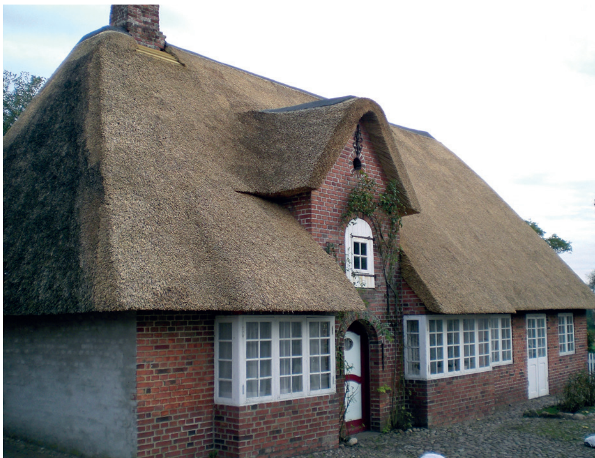
Fig. 4. Kirkestien 4 i Møgeltønder blev opmålt af arkitekt Sven Risom og publiceret i 1911. Huset med koi-sten og de to karnapper blev efterlignet mange steder i Danmark.

Inspirationen blev ikke mindst hentet i Møgeltønder, som i årene efter 1903 blev et valfartssted for såvel tyske som danske arkitekter på opmålingsrejser. Og Møgeltønder blev ikke