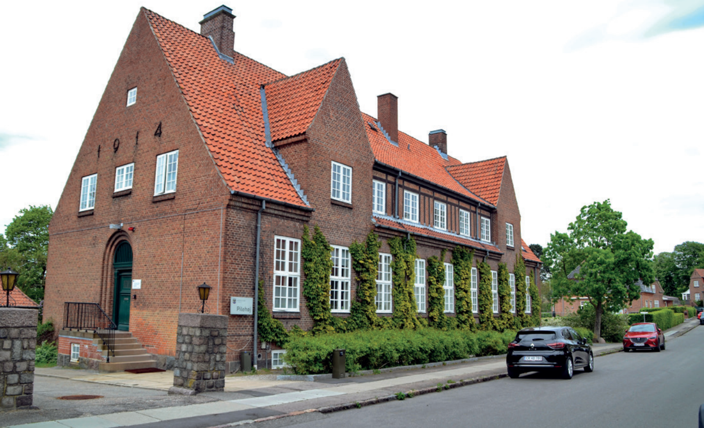
Fig. 1. Dronning Margrethes Vej 39, som bygningen ser ud i dag.

Ser man på Slots- og Kulturstyrelsens hjemmeside har bygningen fået værdien 3 efter SAVE-skalaen. SAVE-skalaen er en metode til at registrere en bygnings bevaringsværdi, som går fra 9 til 1, hvor 1 er den bedste vurdering. Bygningen er altså oppe i den høje ende af skalaen. Her kan man også læse, at bygningen er opført som Kaptajn Fengers Soldaterhjem i 1914. Dette stemmer ikke overens med Weilbachs kunstnerleksikon fra 1998, der angiver, at bygningen blev opført som en kommandobygning for forsvaret.