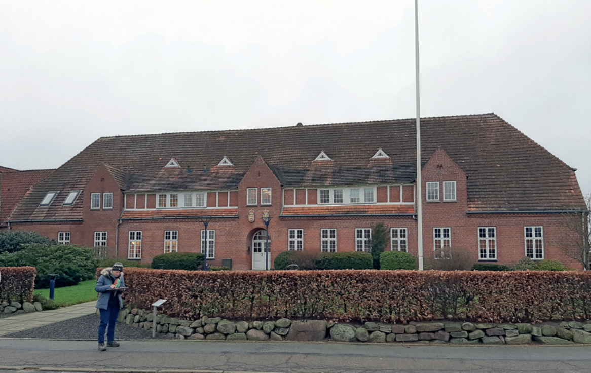
Fig. 2. Forbilledet den tyske højskole i Tinglev (opf. 1907), tegnet af berlinarkitekterne Paulus, Dinklage og Lilloe i typisk slesvigsk hjemstavnstil. Bygningen bruges i dag af Beredskabsstyrelsen.

Bevægelsen kom til provinsen Slesvig-Holsten i 1907, og her blev Tønder og Tønder Kreds et epicenter for bevægelsen under ledelse af landråd Friedrich Rogge. I kraft af sin position som ledende preussisk embedsmand kunne han ikke alene støtte bevægelsen med gode ord, men også med handling.