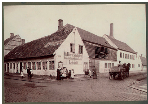
Fig. 7. Garver Rasmussens ejendom på hjørnet af Ringstedgade og Bredgade.

Garverens håndværk udviklede sig ikke meget fra den tidli-