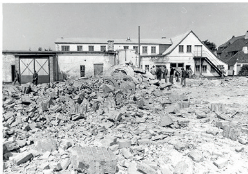
Fig. 19. Nedrivningen af Kemps Garveri i 1980. Skorsten er lige sprængt.

Østrig – Etiopien eller USA produceres lædervarer i Uruguay, Holland eller Taiwan, som sælges i Kina, Danmark og Saudi Arabien. Det lokale kredsløb er blevet erstattet af et globalt kredsløb”. 29