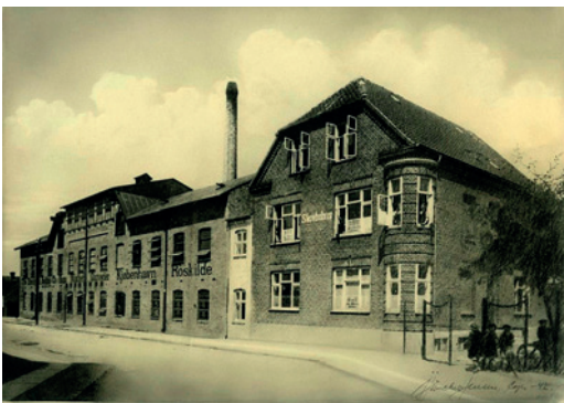
Fig. 14. Dominions Garveri i Skovbogade omkring 1930.