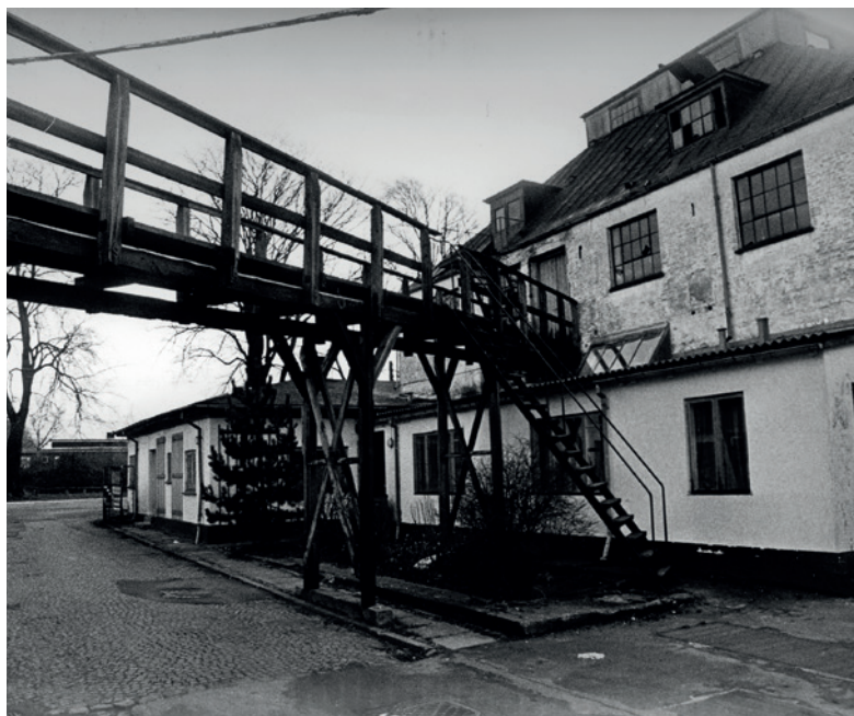
Fig. 18. Kemps Garveri efter lukningen i 1966.

De følgende drastiske ændringer kom ude fra. Industriproduktionen blev globaliseret og mange af de danske industriarbejdspladser blev flyttet uden for landets grænser. Det er beskrevet, hvad det betød for garveribranchen: "I dag er der tale om et fuldstændigt globalt marked. Med råvarer fra Estland –