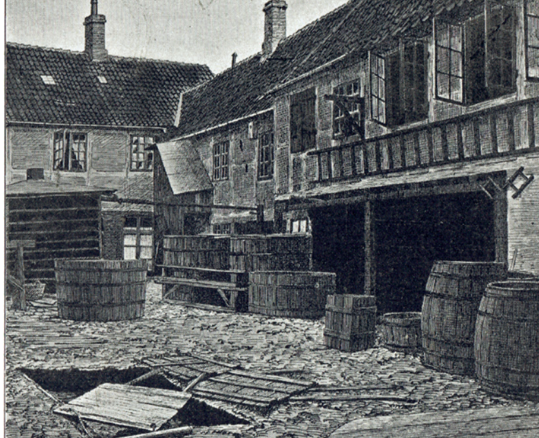
Fig. 5. Tegning fra gården i Winthers garveri i Allehelgensgade.

ofret. Ud fra seletøjsbeslag er det muligt at rekonstruere den seletøjspragt, som jernalderens heste havde. Der var gået meget garvet læder til.