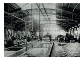
Fig. 10. Kalkhuset på FDB's Garveri.

I de sidste årtier af 1800-tallet var der så småt ved at ske en overgang fra håndværk til industriel produktion på garverierne. Denne udvikling foregik meget hurtigt frem til be-