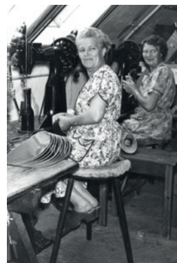
Fig. 24. FDBs træsko-fabrik.

Herudover er der en række gamle garveriboliger på Neergårdsvej. De var oprindeligt opført af Dominion som arbejderboliger, og vejen fik i 1925 navnet Garvervej, men allere-