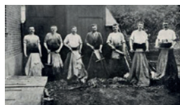
Fig. 9. Garvere hos garver Poulsens i Algade 66.

I 1898 eksproprierede kommunen ejendommen, hvor garveriet lå. Allehelgensstræde var blevet for snæver, og det skulle udvides til den nuværende Allehelgensgade. Garveriet flyttede ind i en ny stor fabriksbygning ude på Skovbogade.