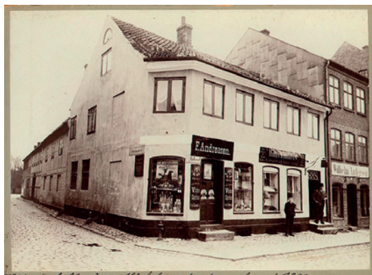
Fig. 8. Garver Winthers ejendom på Torvet.

I Skomagergade 5 havde endnu en Rasmussen et garveri,