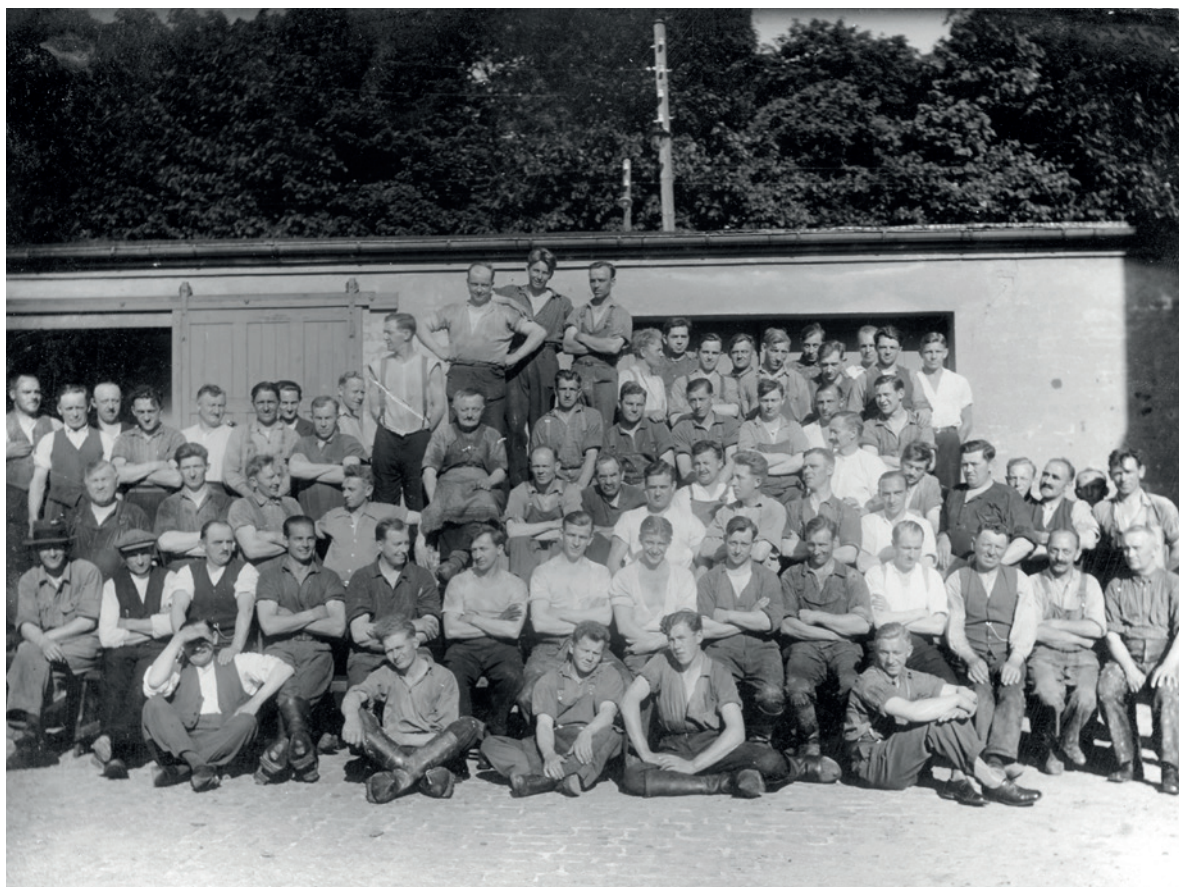
Fig. 23. Personale på FDB's Garveri omkring 1930.

De skete gennem hurtige ændringer af produktionsmetoder og organisering af branchen, som stort set ikke er set inden for andre brancher. Men vi ser også, at de ændringerne i produktionsmetoderne gik meget langsomt i de mellemliggende perioder, og "alt var som det altid havde været".