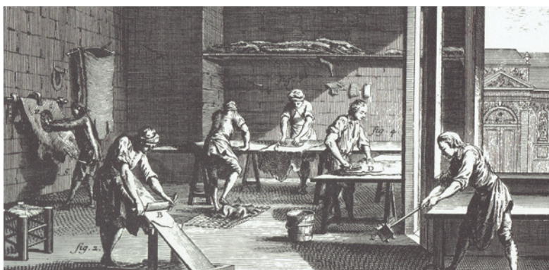
Fig. 4. Lohrgarvere færdiggør læderet. Træsnit fra middelalderen. Trykt fra Børge Dahl, 1981.

stort set samme måde, som det foregik i Danmark indtil for godt 100 år siden.