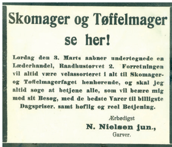
Fig. 25. Annonce i forbindelse med åbningen af Nielsens læderhandel.