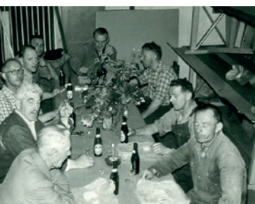
Fig. 22. Dominions marketenderi.