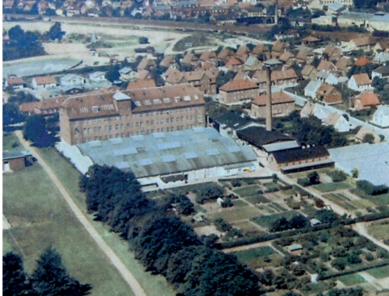
Fig. 21. Loftfoto af FDB' Garveri.