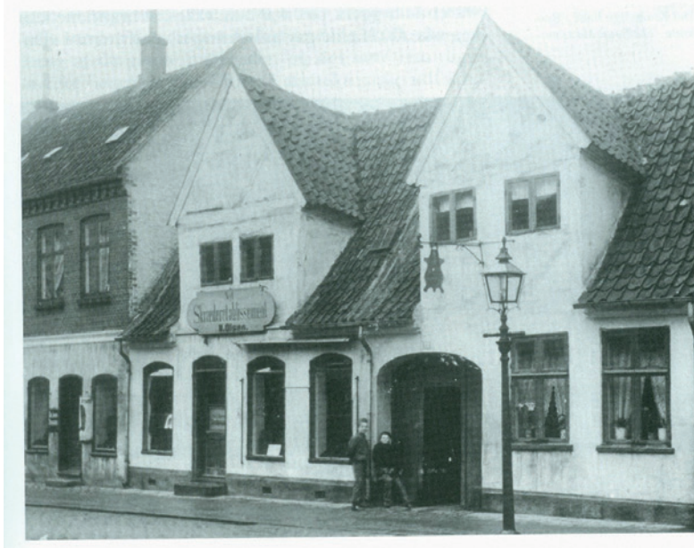
Fig. 6. Feldbereder Kruses ejendom Sko- magergade 12.

Garvning foregår i store kar ved brug af bark, der er malet og opløst i vand. Det er garvesyren i barken, der binder og fikserer proteinerne i huden, så det færdige læder kan holde i årevis.