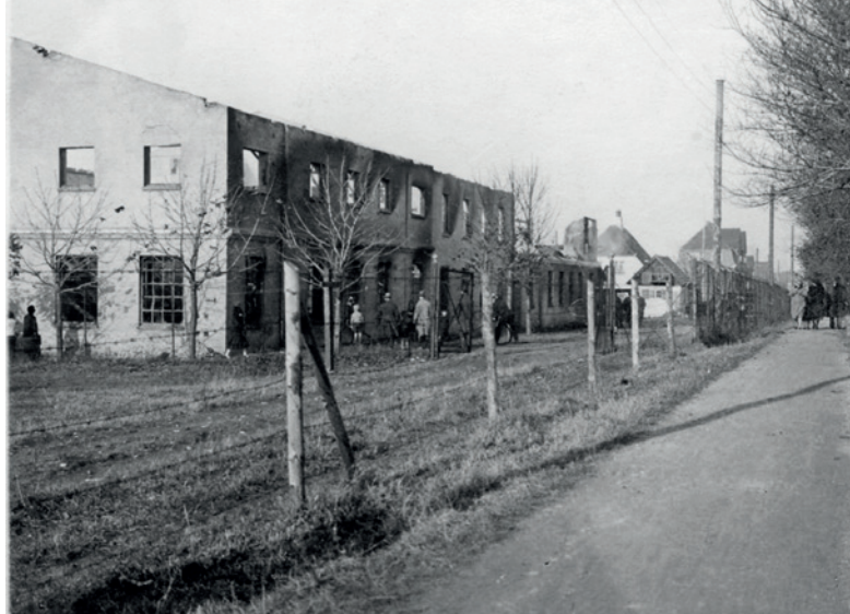
Fig. 15. Chromlæderfabrikken efter branden i 1929.

1920'erne. Men det fik en brat ende, da hele garveriet brændte ned i begyndelsen af november 1929. I branden gik også et stort lager af færdigt læder tabt, som skulle være sendt med banen dagen efter. Privatbanken forsøgte endnu engang at rekonstruere virksomheden. Men det lykkedes ikke, og dermed lukkede det første af Roskildes store industrigarverier efter små 15 år på Eriksvej.