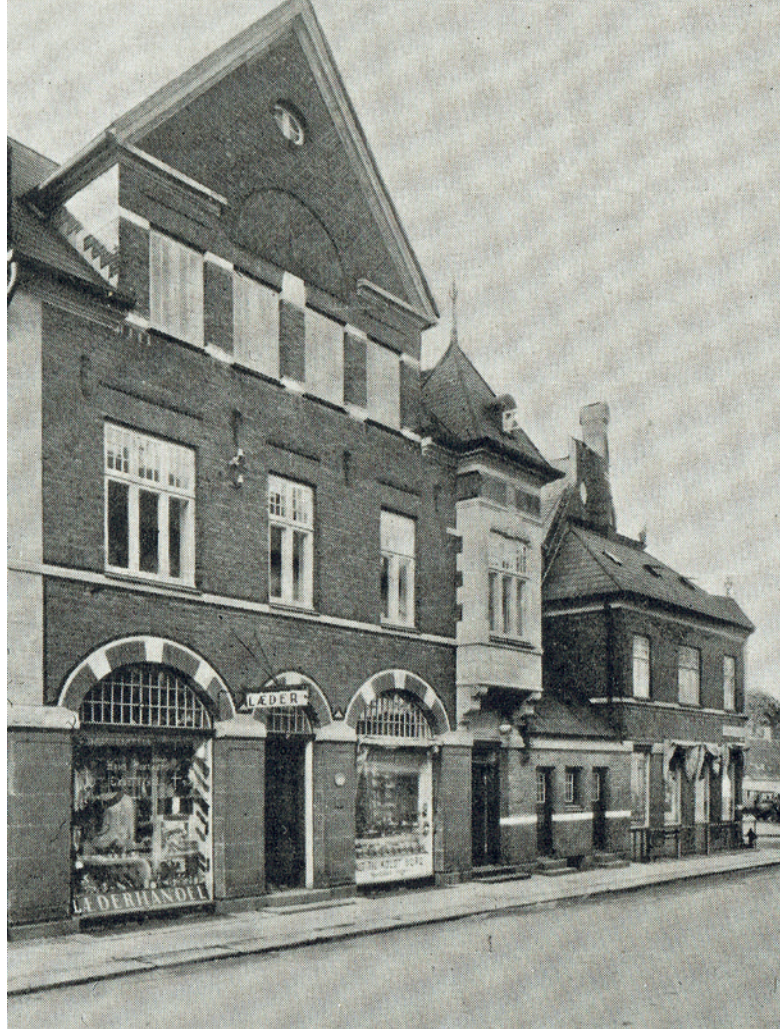
Fig. 12. Winthers nye læderhandel i Allehelgensgade.

ceret med vegetabilsk garvning. Det var usædvanligt for et stort industrigarveri, at det fortsatte med at bruge vegetabilsk garvning, selvom processen dog var intensiveret og produktionstiden nedsat. Først i forbindelse med den stigende produktion af møbellæder i 1960'erne gik man over til kromgarvning.