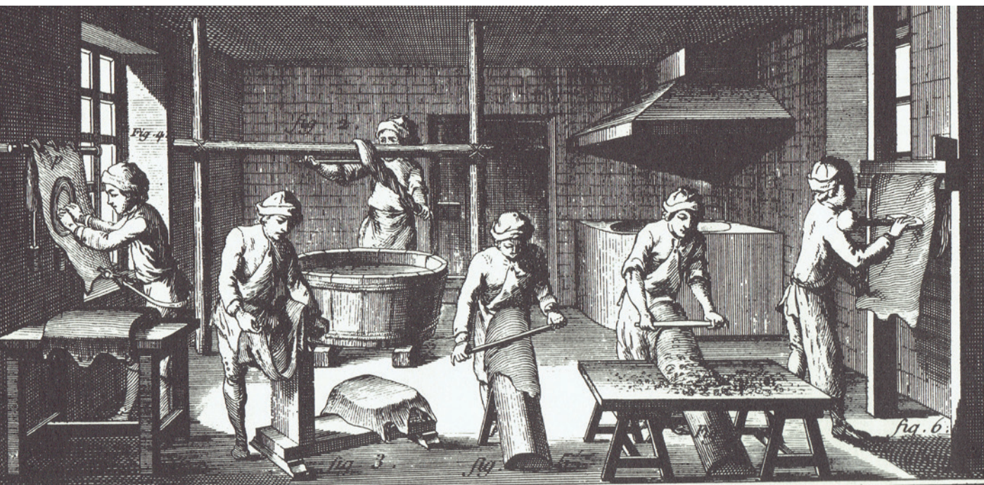
Fig. 2. Feltgarver fremstiller vaskeskind. Træsnit fra middelalderen. Trykt fra Børge Dahl, 1981.

Fra det gamle Ægypten, Rom og Grækenland er der fundet vidnesbyrd om garvning. Der blev den gang garvet på