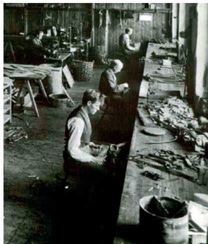
Fig. 26. FDBs seletøjsfabrik.

de i 1933 ændrede byrådet navnet til det nuværende Neergårdsvej. 32