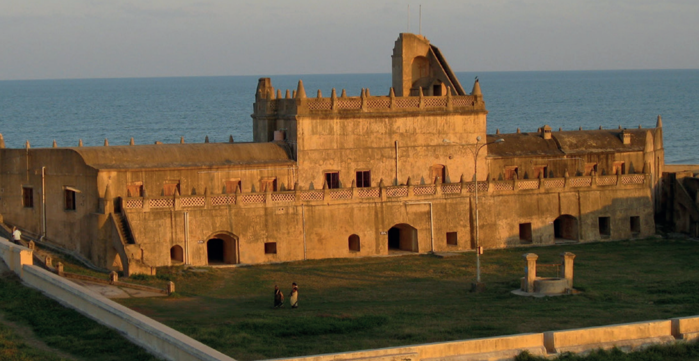
Fig. 5. Dansborg – Tranquebar.

omkring / at beseer Byen. Byen var med skønne dybe oc brede Grave dobbelt Muure / og enkelt Vold omgiven, dog uden nogen Flancqvering. Den 10de lod Kongen hannem iligemaade føris omkring sin Hafve at beseer som var heel plaisant og deylig/ Den 12 lod hand nogle Elephanter ficte for hannem oc Endeel Bøfler kempis med Elephanterne. Den 16 beviste hand hannem den Naade at hand maatte see hans Skatkammer: Og var det fuld aff Guld/Sølf/og Clenodier; enddog hannem siuntes Steenene icke at være aff syndelig høy Værd. Den 18 lod hand hannem føris omkring sit Pallads at beseer /som var heel Køsteligt/ og tog hand der med Affsteed oc reyste til Trangabari igien hvor Festningen efftter giort Accord skulle leggis...”