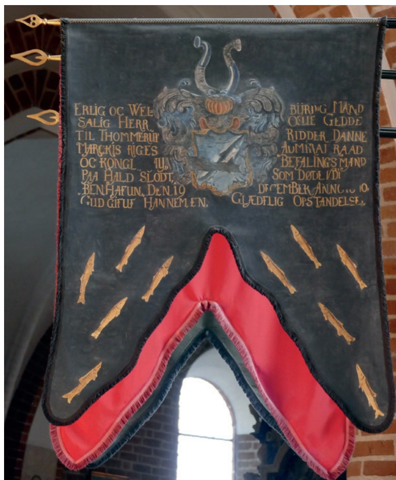
Fig. 8. Fane fra Ove Geddes begravelse i Roskilde Domkirke.

Der er således i Roskilde- og Greveområdet flere centrale minder om rigsadmiral Ove Giedde og hans kone, selvom han i live vist intet havde med området at gøre.