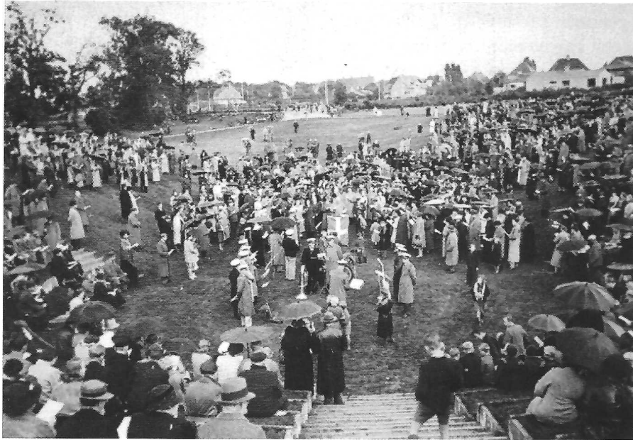
Alsangen i Roskilde begyndte på Højskolehjemmet i Algade, men den første store aften var den 21. august i Folkeparken.

I sommeren 1940 samledes man over hele landet for sammen at synge de nationale sange.