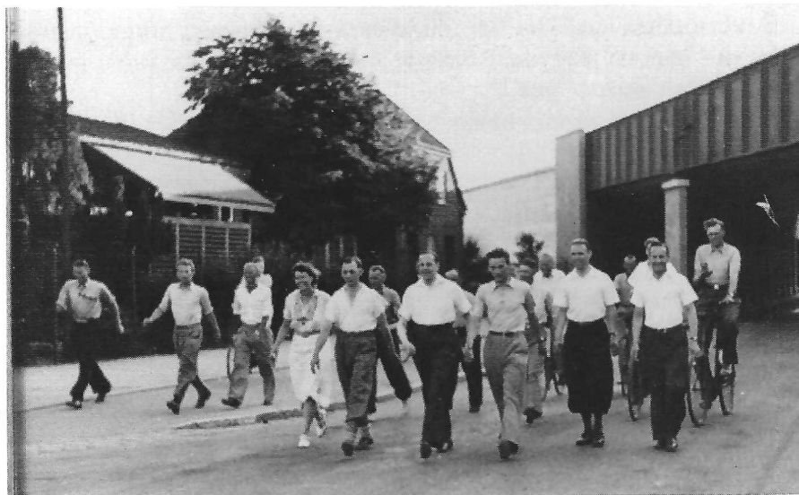
Algang ved Røde Port.

Ruten var på 10 km og skulle gennemføres på 1½ time; damerne fik dog ti minutter mere.