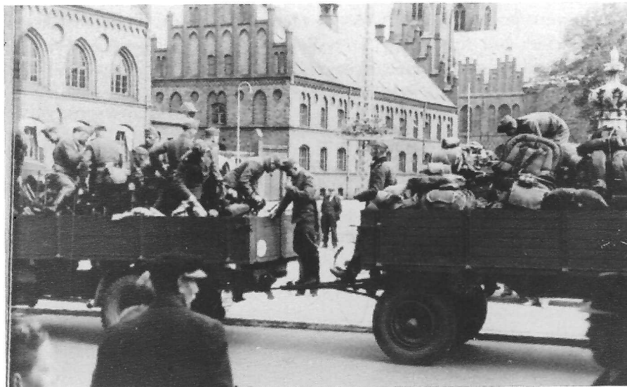
Tyske soldater den 9. april på Stændertorvet i Roskilde.

Den 9. april om aftenen befandt der sig således omkring 200 menige og befalingsmænd fra garnisonen i Roskilde i Sverige. 1) 5. kompagni lå i kvarter ved Slangstrup. I Roskilde blev oberstløjtnant af reserven, C. F. Løkkegaard, beordret til at overtage kommandoen over garnisonen og regimentet.