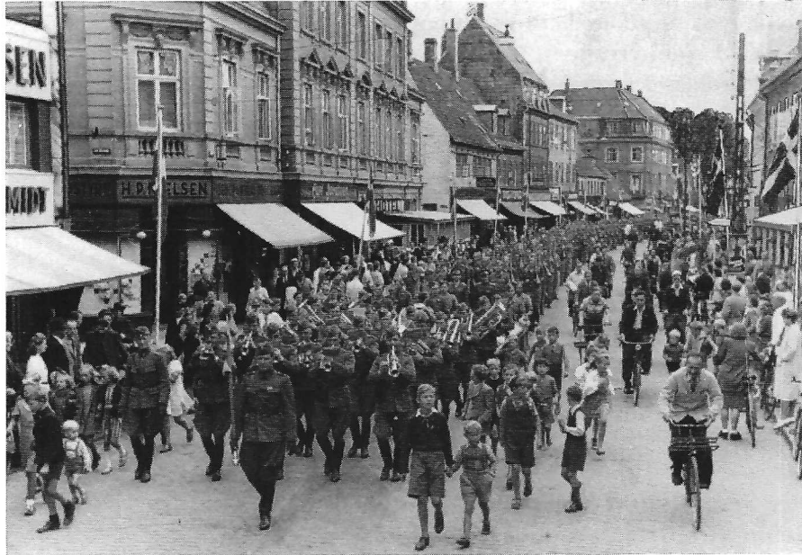
4. regiment på vej til Roskilde kaserne, (se næste side).

En enkelt ulykke i disse første befrielsesdage indtraf, da en 26-årig frihedskæmper omkom ved et vådeskud ved Fjordvilla. Ulykken skete den 8. maj