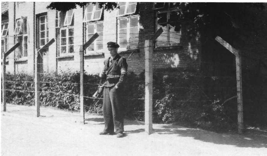
Vagt ved Sct. Jørgensbjerg Skole i sommeren 1945.

navne og adresser blev bragt i lokalaviserne. Endnu den 12. maj kan man læse navnene på et halvt hundrede arresterede, men så klinger det af.