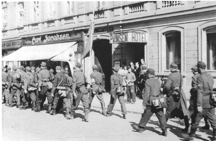
Tyske soldater på vej mod grænsen. Hotellet flagede med engelsk flag i dagens anledning. Indehaveren var engelskfødt. (L.H.A., Roskilde).

De sårede soldater på Allehelgens Skole og på Sct.Jørgensbjerg Skole blev flyttet til kasernen. Tilbage i byen var desuden et betydeligt antal civile flygtninge. 6)