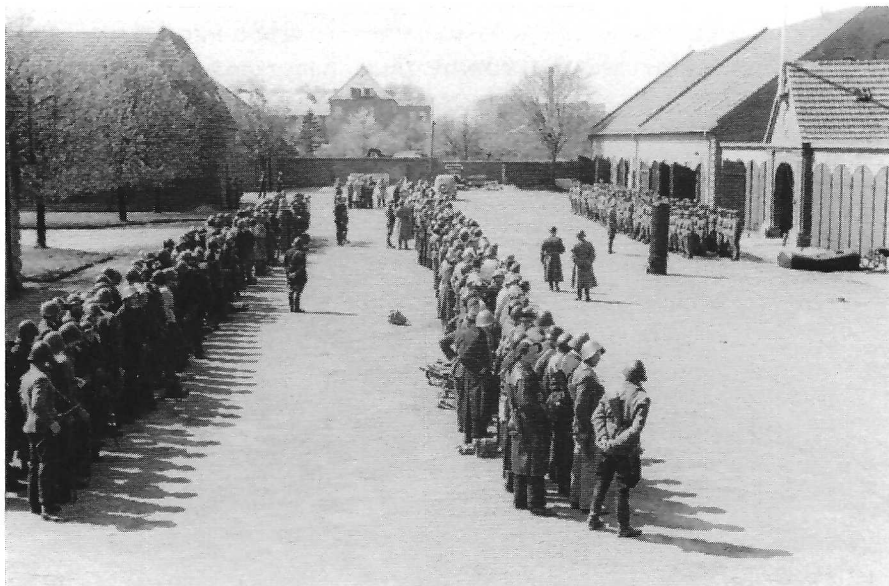
Ringsted kaserne. Frihedskæmpere opmarcheret over for Schalburgkorpset..

forlod kasernen, den 7. maj om eftermiddagen, kunne modstandsfolkene rykke ind og arrestere de tilbageblevne Schalburgfolk.