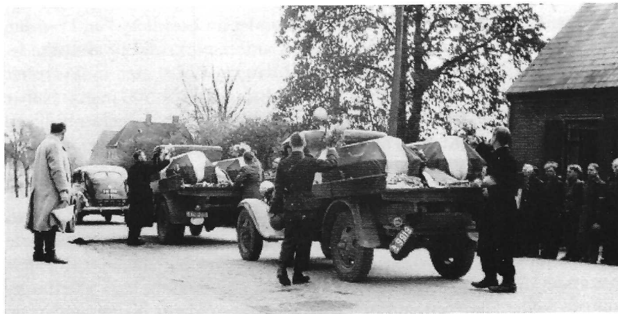
De dræbte fra Sorøtragedien hentes hjem til Roskilde. (Otto Hansen).

Hvad der herefter skete, står meget uklart, men tilsyneladende blev bilen standset af de udlagte punktersøm, og umiddelbart herefter blev der