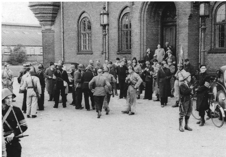
Ting- og arresthuset i Jernbanegade, maj 1945. (Børge Lindegaard Olsen).

På Ting- og arresthuset opslog Amtsledelsen sit hovedkvarter, og herfra styrede man de kommende dage de opgaver, der skulle løses.